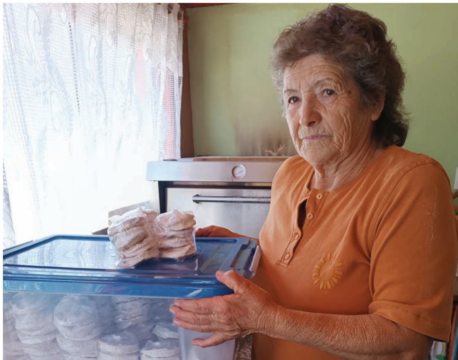
Toda una vida haciendo chilenitos, alfajores y empanadas de alcayota.

Dice que vivía en el centro, a un costado de la carretera, pero hace muchos años se cambió a este terreno, “donde vivo feliz y con las puertas abiertas”. Eso le gusta, la