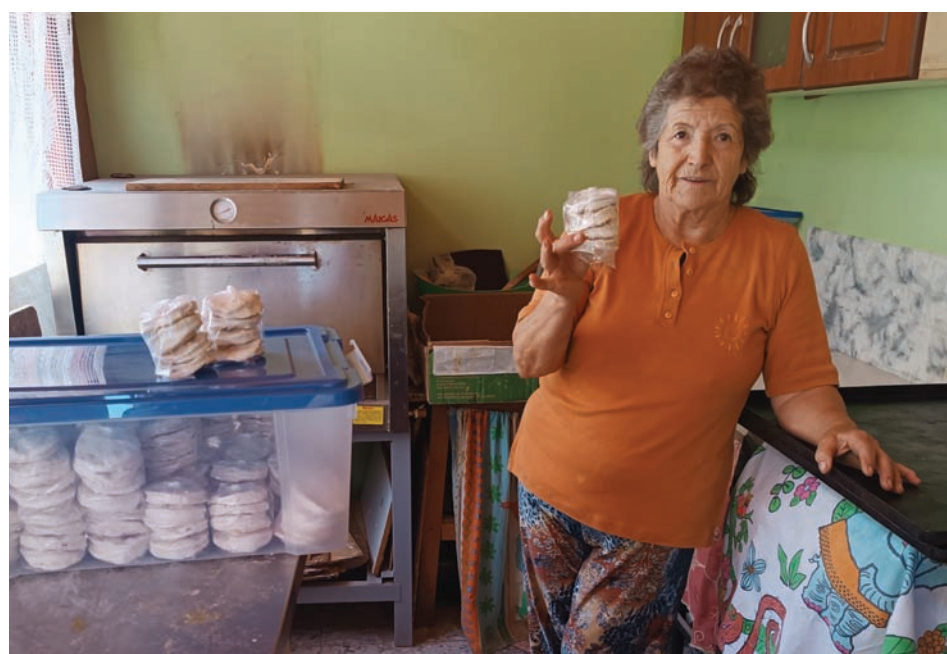
Unos 160 paquetes de dulces entrega diariamente.