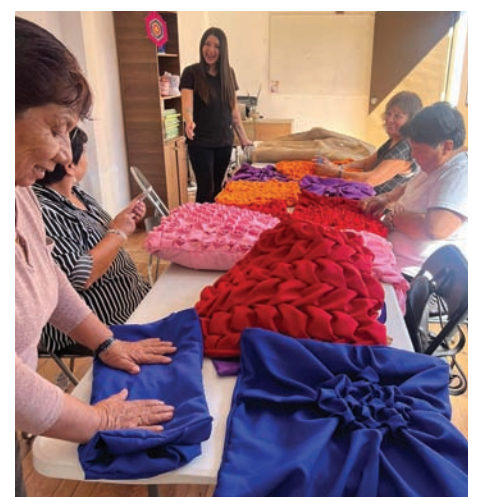
Más de 80 adultos mayores tienen actividades en el CEDAM.