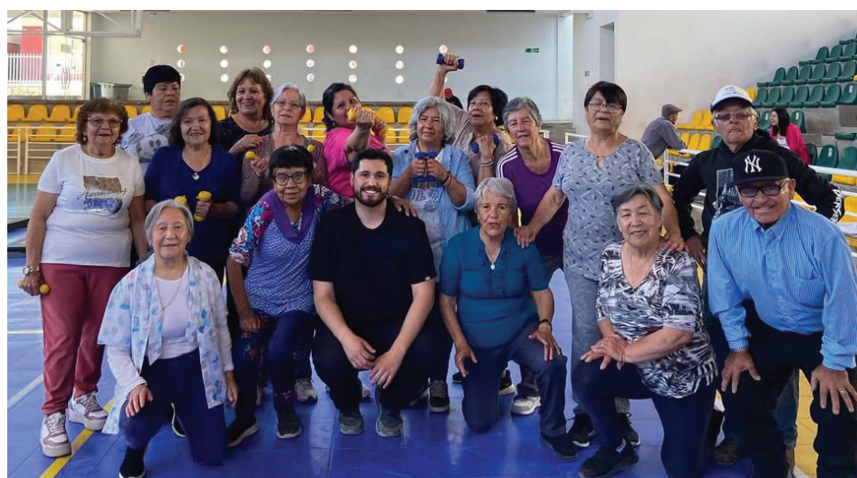
Los talleres se realizan durante todo el año.

Y se realiza porque llegan personas con muchas patologías, como la depresión y ansiedad. También algunos con tipos más bien neurológicos, como el Parkinson o Alzheimer. “Por lo mismo, se realizan talleres en simulación cognitiva para que no vayan perdiendo sus habilidades. Lo que indica que a las personas que llegan con bastón o en silla de ruedas, se les hace un trabajo de gimnasia especial. Es decir, hay planes especiales para los pacientes”.