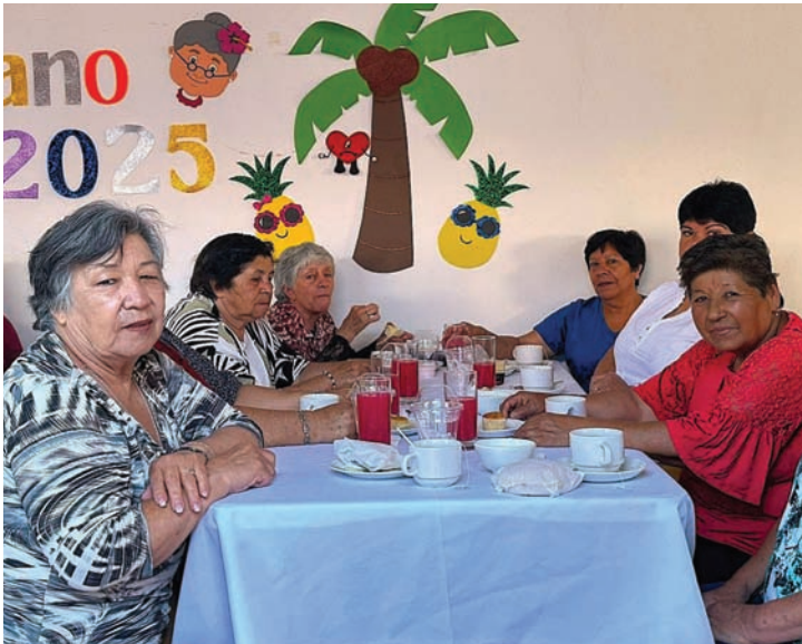
Con un desayuno las personas de la tercera edad comenzaron el 2025.