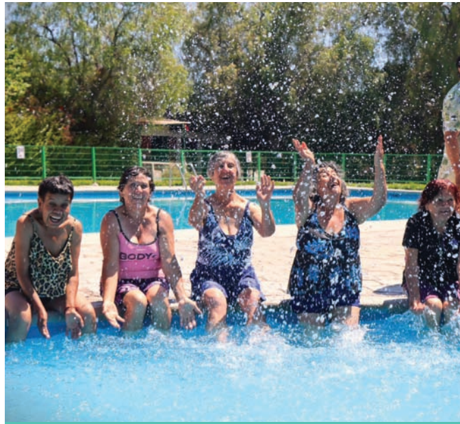
Disfrutando una tarde de piscina espectacular.

Los adultos mayores tienen actividades que les permiten tener espacios de esparcimiento, compartir y recrearse.