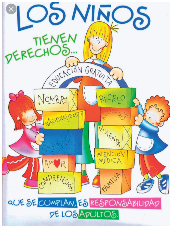
En Chile, el Día del Niño se celebra el segundo domingo de agosto.