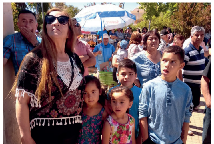
Y no todo es minería, también disfruta el salir a pasear con sus cuatro nietos.

Desde temprano está en el pique, con jornada de mañana y tarde, con un total de ocho horas diarias. Ahí con tiros, un rotomartillo y muchas ganas echa abajo el cerro.