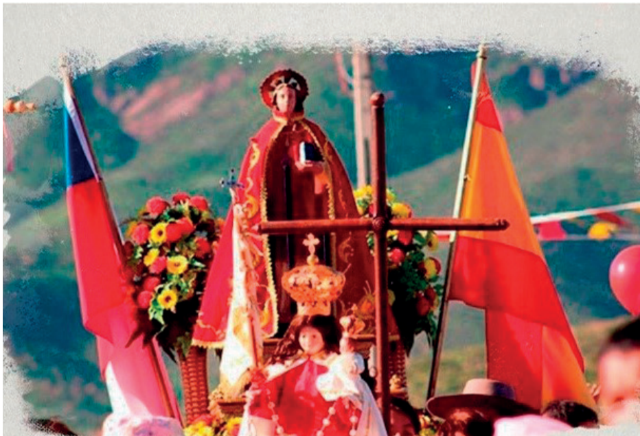
Viernes 9 de agosto a las 11:30 hrs. en el Templo Parroquial de Andacollo.