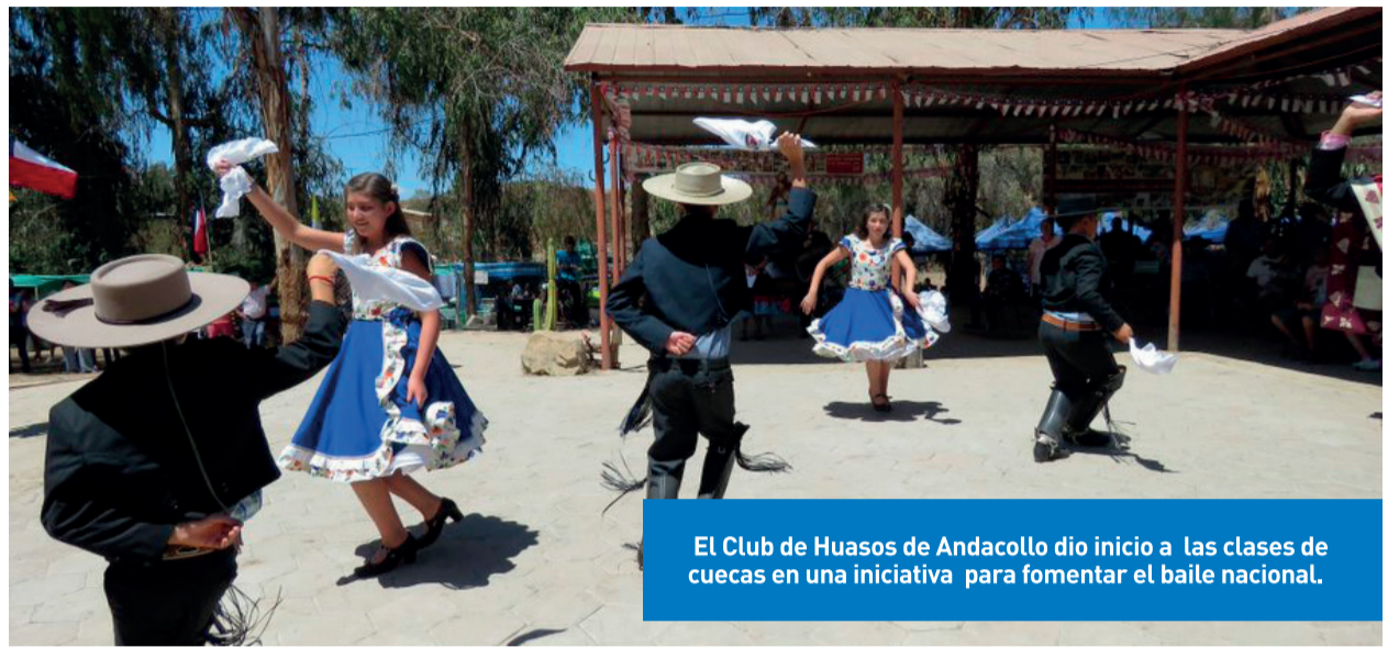
El Club de Huasos de Andacollo dio inicio a las clases de cuecas en una iniciativa para fomentar el baile nacional.