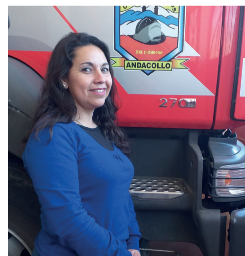
Hasta en sus horas de descanso, que son escasas, también visita el cuartel.

ANDACOLLO CUENTA CON 7 ESTACIONES DE MONITOREO DE CALIDAD DEL AIRE: EL TORO, URMENETA Y CHEPIQUILLA DE TECK CDA ( HTTP://PDA-ANDACOLLO.MMA.GOB.CL ); EL SAUCE, HOSPITAL: DAYTON, ESTACIÓN COMUNITARIA Y MINISTERIO DE MEDIO AMBIENTE ( HTTPS://SINCA.MMA.GOB.CL/ ).