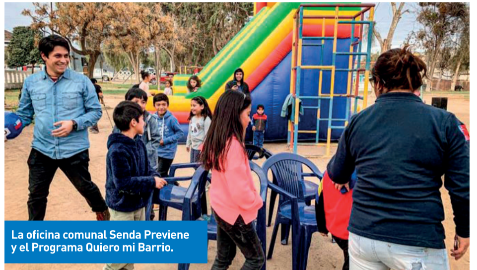
La oficina comunal Senda Previene y el Programa Quiero mi Barrio.