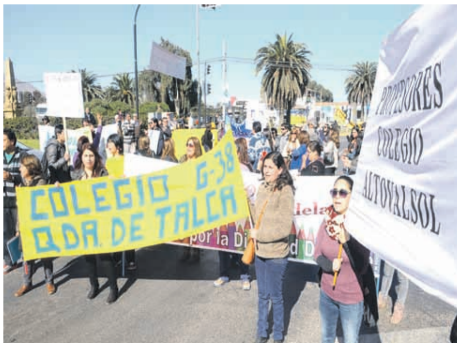
El problema al parecer no sería de pronta solución y habría resoluciones recién el segundo semestre del próximo año.

La resolución agrega que: “de los ingresos recibidos por la Ley 19.933, por el período abril de 2012 a abril de 2017, versus los egresos en el pago de remuneraciones existe un saldo en contra por un valor de $596.222.828, lo anterior según Dictamen de la Contraloría General de la República. (...) Es decir, no sólo se han destinado todos los recursos provenientes de la Ley 19.933 al pago de las remuneraciones de los docentes, sino que la Corporación tiene un saldo en contra, ha gastado más de los que ha recibido para el pago de remuneraciones docentes”.