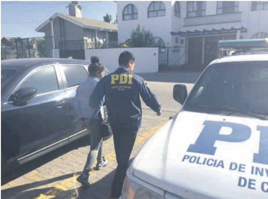
Una de las detenidas en el operativo de la PDI.