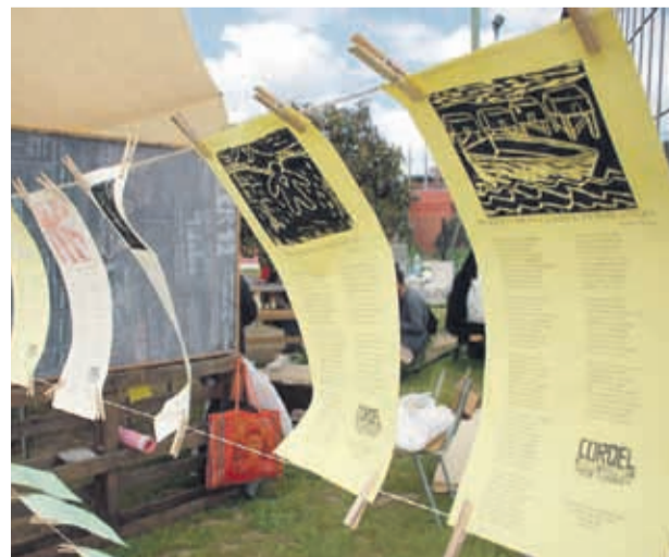
Los poetas populares colgaban sus pliegos con décimas de cordeles extendidos entre dos árboles

En un día, quienes se sumen podrán ser parte de un taller de décimas, donde conocerán los orígenes de esta forma poética, cómo fue utilizada en Chile en décadas pasadas y de qué modo