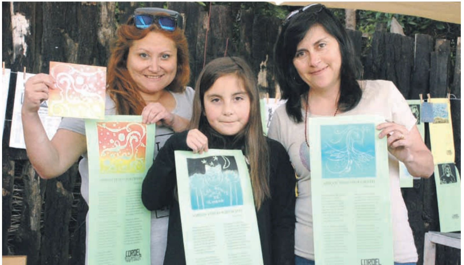
Un taller gratuito, al aire libre, donde se puede aprender a escribir en décimas, el arte de la xilografía y escuchar música en vivo.

TALLER DE TRES DÍAS EN LA COMUNA DE COQUIMBO