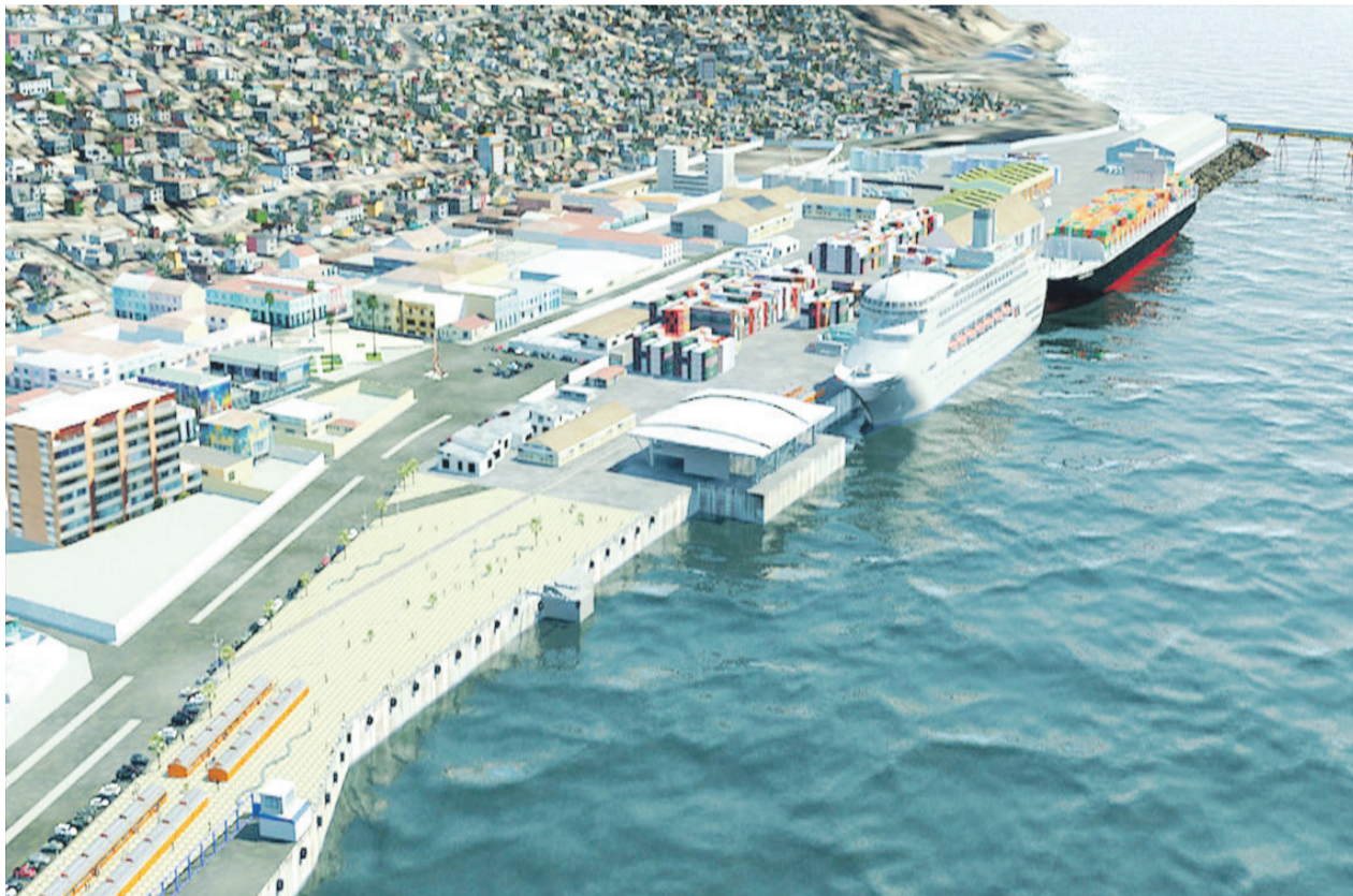
El puerto de Coquimbo, es uno de los puntos más relevantes para los líderes de la región de Coquimbo, en la imagen una maqueta de los proyectos de ampliación.