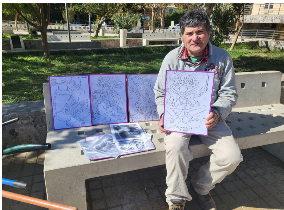
En la Plaza Videla y en su hora de descanso, muestra parte de sus caricaturas.

Presentó sus trazos en una exposición realizada en la Casa del Encuentro Ciudadano.