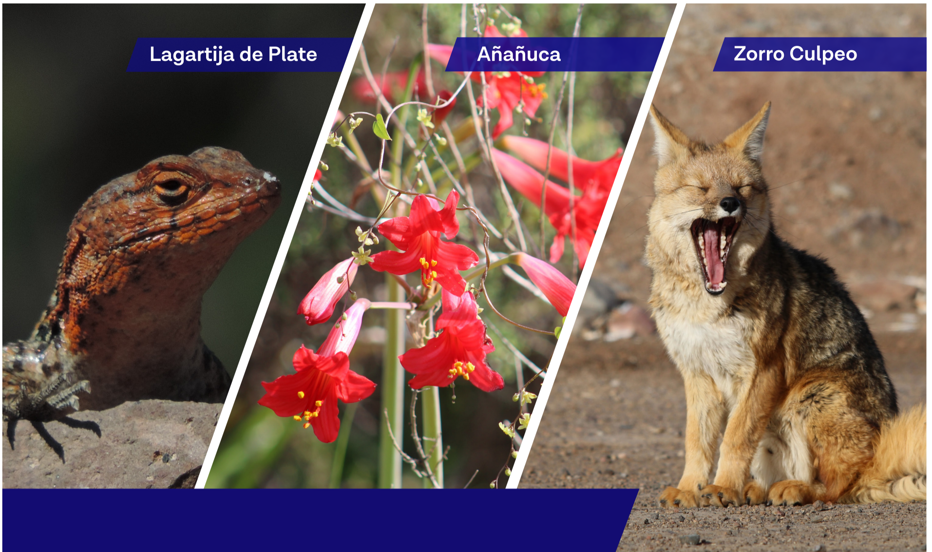
Lagartija de Plate