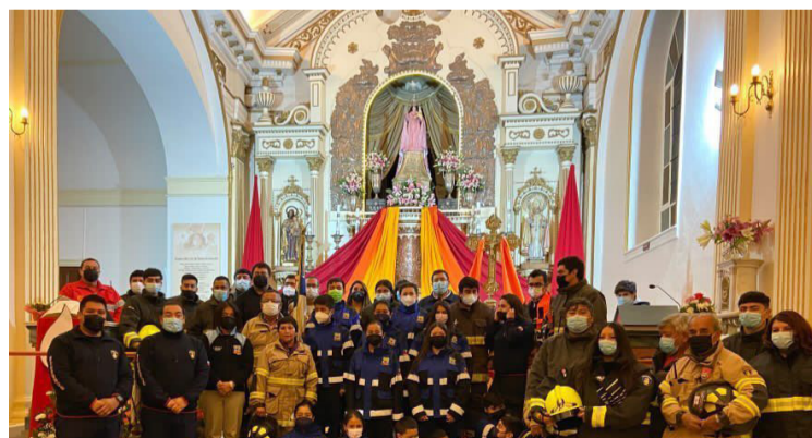
A la Chinita siempre le piden que los proteja en el cumplimiento de su deber.