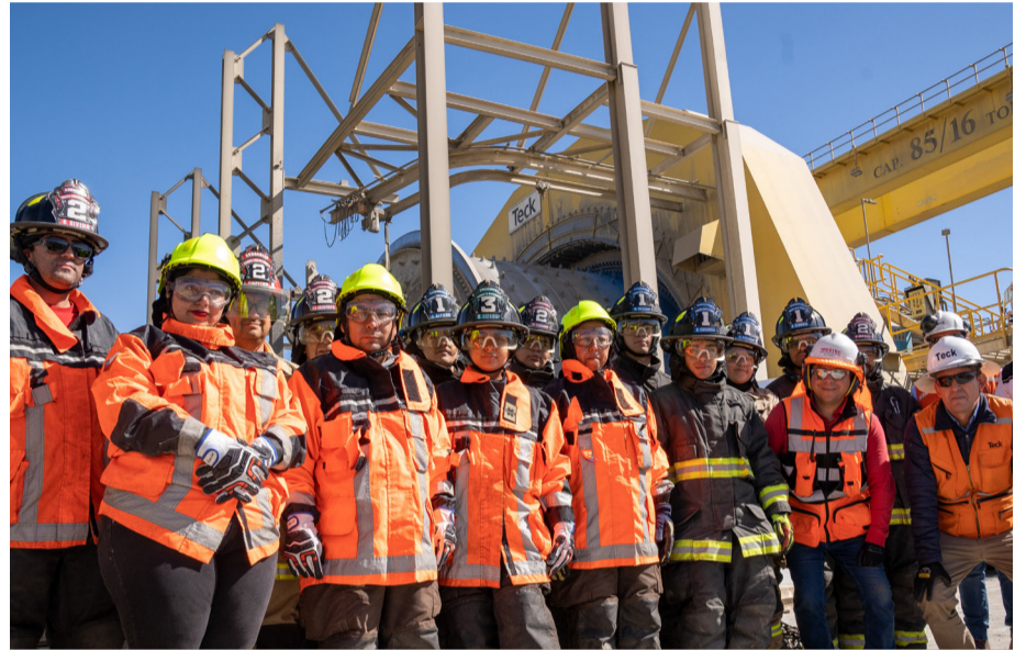
Bomberos de Andacollo y la Brigada de Emergencia de Teck CDA colaboran de manera permanente para mejorar su respuesta ante eventuales emergencias tanto en la operación como en la comunidad.

Para los bomberos es importante ir avanzando, tanto en las capacitaciones como con los nuevos adelantos. Ahora, por ejemplo, gracias a la adjudicación de un Proyecto CAT, cuentan con una Sala de Transferencia. "Después de un incendio o accidente, siempre se observa a los bomberos muy tiznados por el humo, y de acuerdo a un estudio, eso es un agente cancerígeno, por tanto, ahora y luego de una emergencia, los voluntarios pasan por esa sala y salen muy limpios. Es un gran avance en la salud de los voluntarios", resalta el comandante de bomberos.