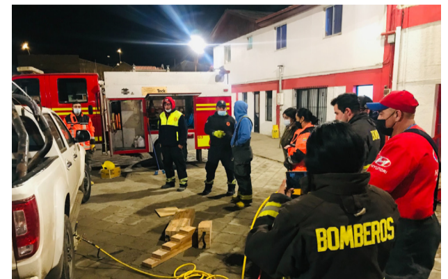
Las capacitaciones suelen ser frecuentes y muy exigentes para los voluntarios.

ANDACOLLO CUENTA CON 4 ESTACIONES DE MONITOREO DE CALIDAD DEL AIRE: EL TORO, URMENETA Y CHEPIQUILLA DE TECK CDA Y HOSPITAL DEL MINISTERIO DEL MEDIO AMBIENTE. LAS TRES ÚLTIMAS DISPONIBLES EN LA PLATAFORMA SINCA DEL MINISTERIO DE MEDIO AMBIENTE ( HTTPS://SINCA.MMA.GOB.CL/ ).