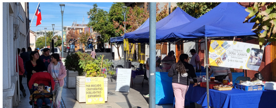
La feria costumbrista y un show se instaló en el Paseo Urmeneta.