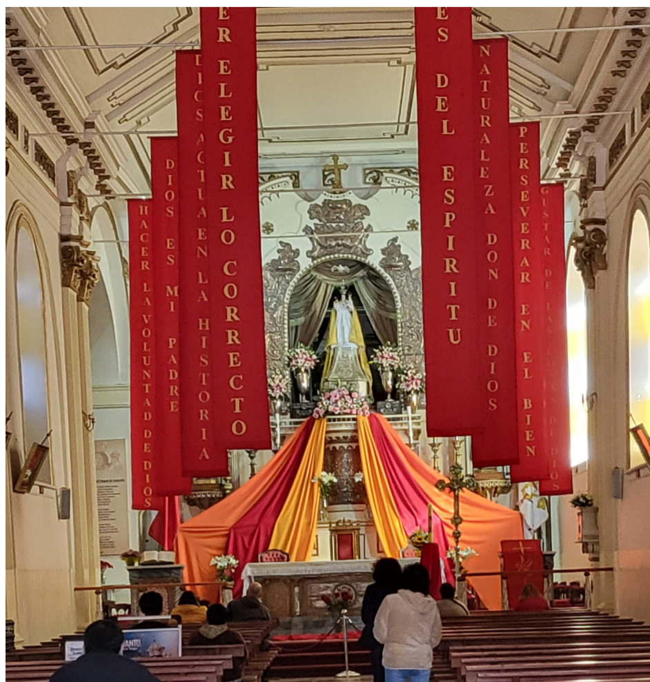
El Templo Parroquial y sus fieles.