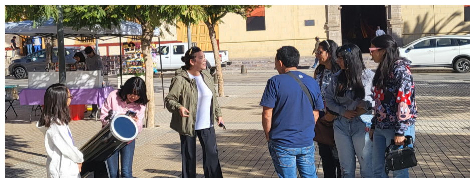
En el Día de los Patrimonios, el Astroclub Infantil compartió con los turistas la cosmovisión que tienen del universo.

Teck CDA dispone de canales directos para recepcionar opiniones, reclamos o sugerencias: