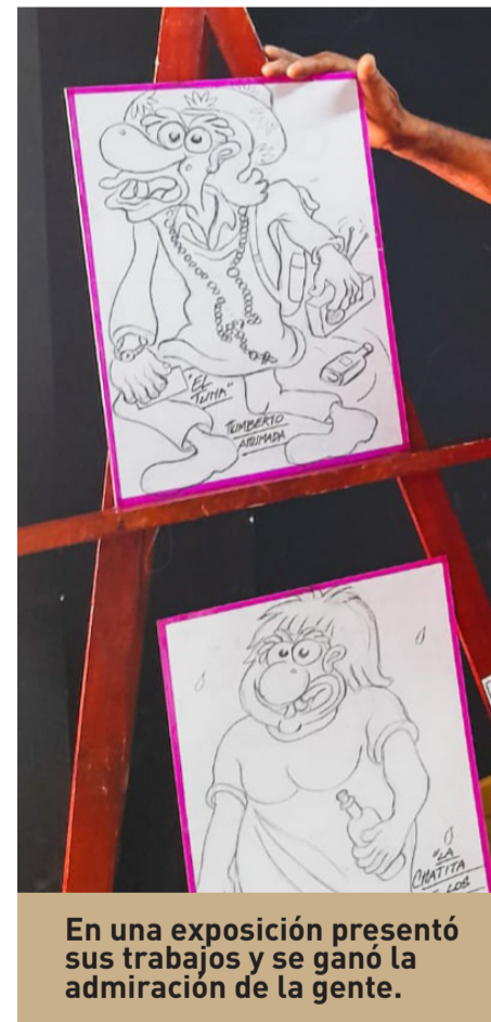
En una exposición presentó sus trabajos y se ganó la admiración de la gente.

INFÓRMATE DE LOS PROCESOS DE TRONADURA WWW.TECK.COM, MUNICIPALIDAD DE ANDACOLLO Y MEDIOS DE COMUNICACIÓN DE LA COMUNA.