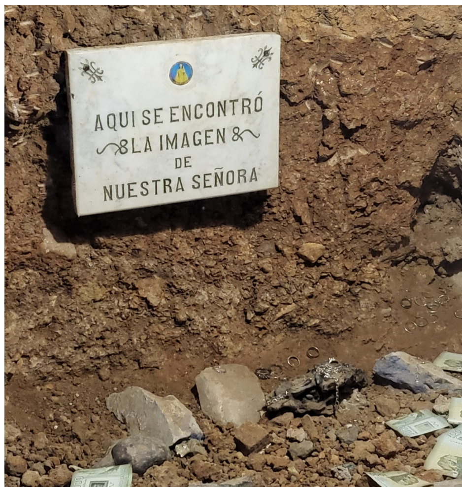
El lugar donde fue encontrada la imagen de la Virgen del Rosario de Andacollo.