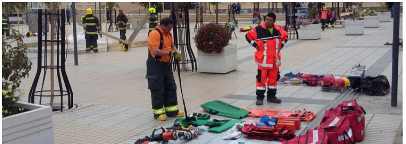
Para la institución es importante que la comunidad pueda conocer su gestión y cómo se preparan ante una emergencia