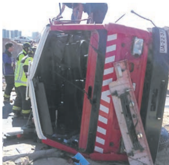
Con pérdida total quedó el camión de bomberos de la undécima compañía de Coquimbo.

camión de emergencias y lograron llevar la máquina a un costado del camino para evitar una tragedia, y por suerte resultaron solo con lesiones menores gracias a la reacción que tuvieron. Respecto al vehículo, este tuvo pérdida total y es un duro golpe, ya que el valor del carro bomba alcanza los $180 millones y la comunidad no puede esperar ante una emergencia", detalló el su-