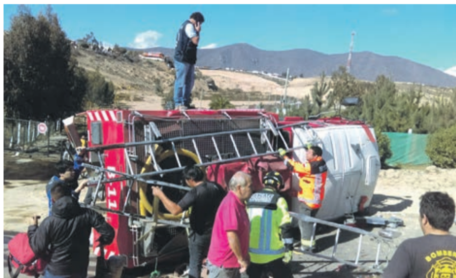
Un total de 4 voluntarios de bomberos lesionados, fue el saldo que dejó el volcamiento del carro de emergencias que transitaba por la quebrada Las Rosas.

"Nuestros efectivos sufrieron el corte de los frenos del