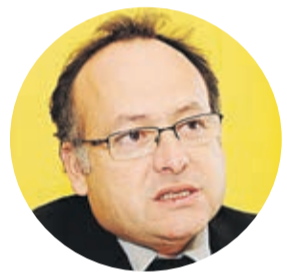
BERNARDO SALINAS, seremi de Gobierno

“Es una cifra muy significativa, pero lo primero que queremos destacar es que toda la región ha participado. La gente expuso todos los temas relevantes que son importantes para la nueva Constitución”