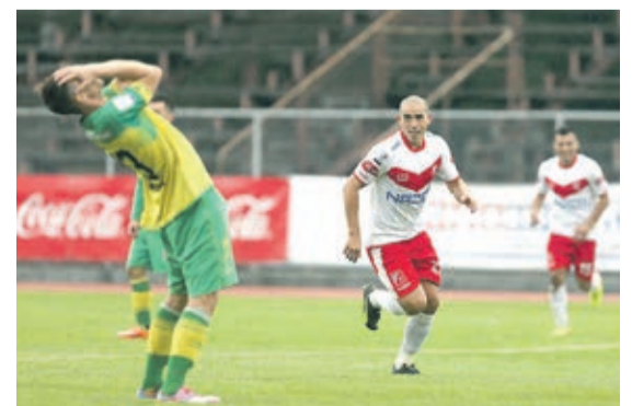
En el Torreón están felices por la resolución de la corte que acogió el recurso de protección.

mil UF debía cancelar el club sureño a la Asociación Nacional de Fútbol Profesional.