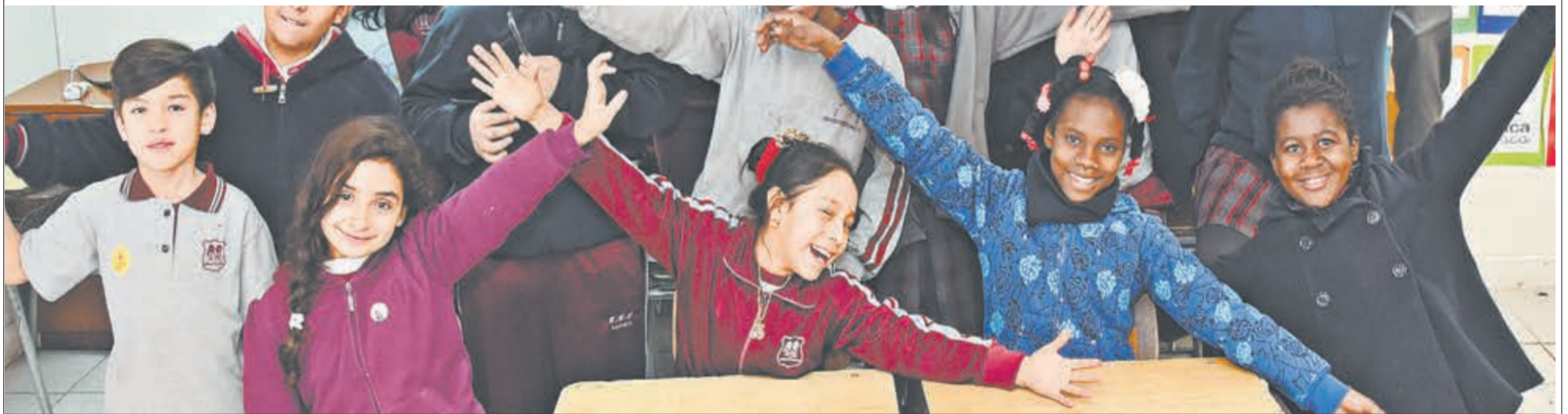
Escuela Básica Cornelia Olivares, Independencia

Consultas y denuncias - www.supereduc.cl - 232431000