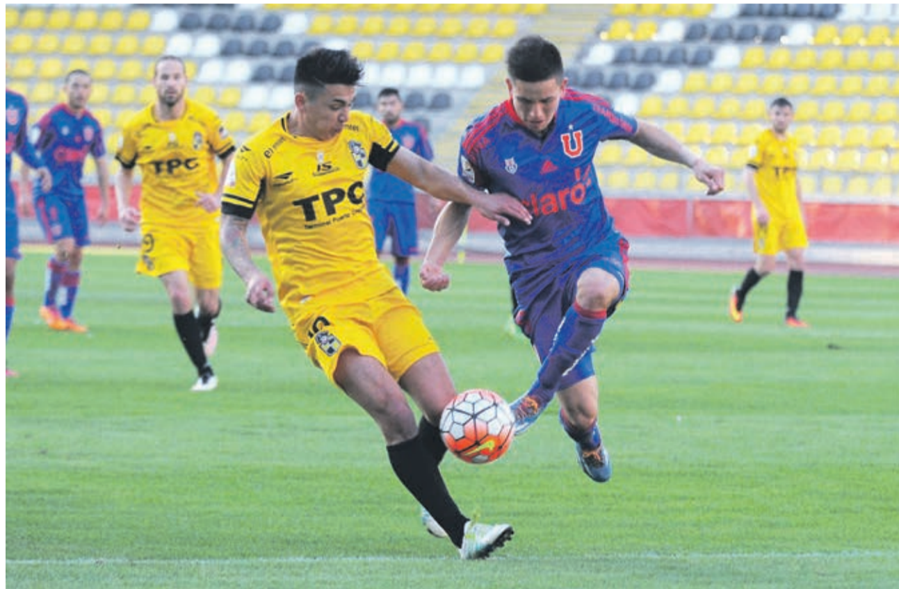
Coquimbo Unido espera arrancar sumando un triunfo ante Palestino. El duelo se agendó para el sábado a las 18.00 horas en el Sánchez Rumoroso.

Ahora la gran pregunta es si este presente podrá sostenerse en el horizonte o si sólo será un espejismo pasajero. Habrá que ver.