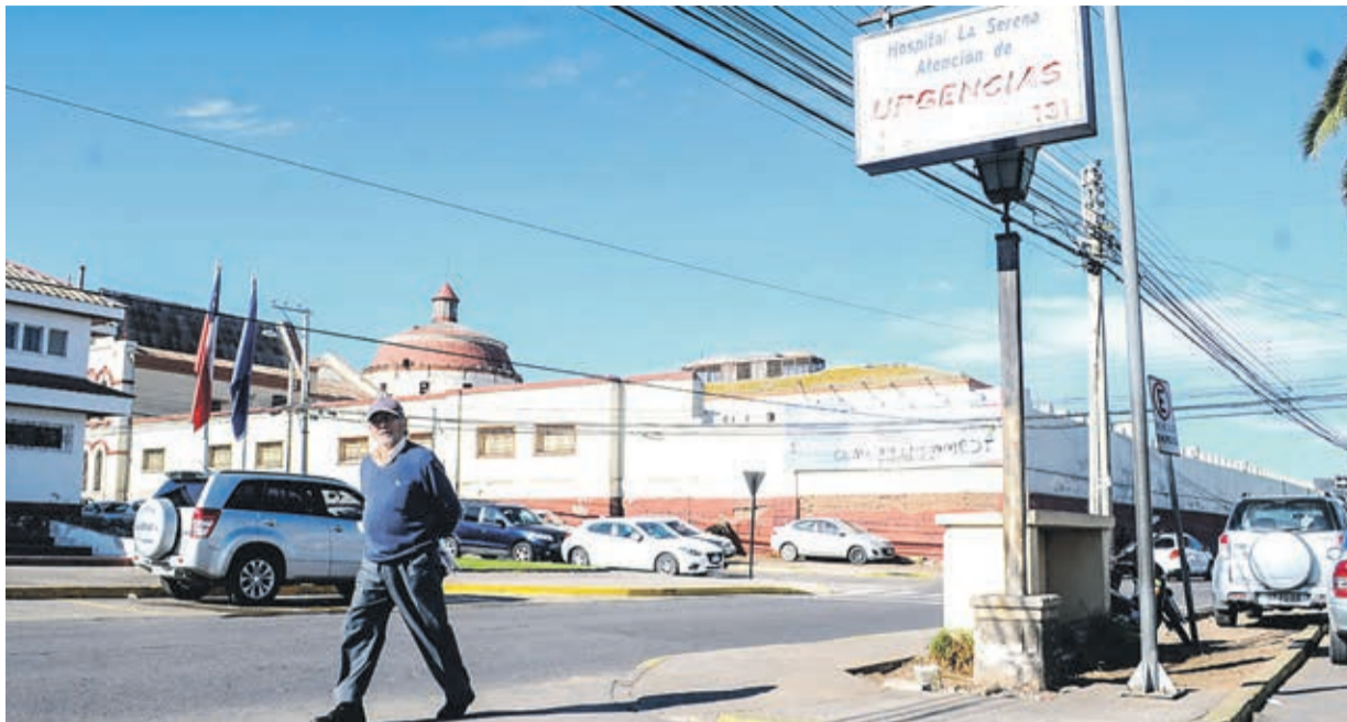
Cuatro compañías ofertaron pero fueron tres las que se ajustaron al presupuesto

“Esperamos iniciar a principio del próximo año, de modo tal que se entregue en