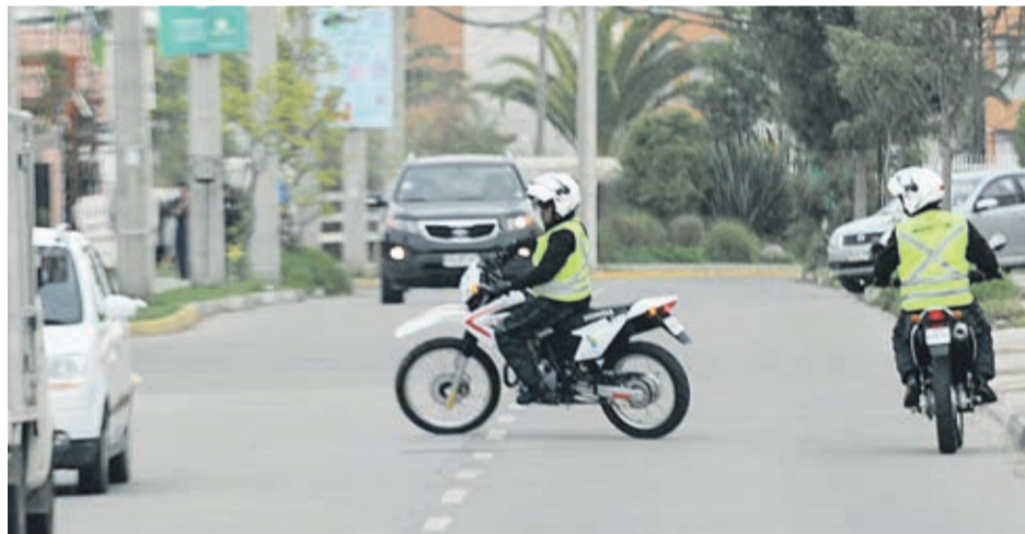
Las motocicletas han sido un implemento importante que han utilizado los funcionarios en el último tiempo para efectuar su labor.