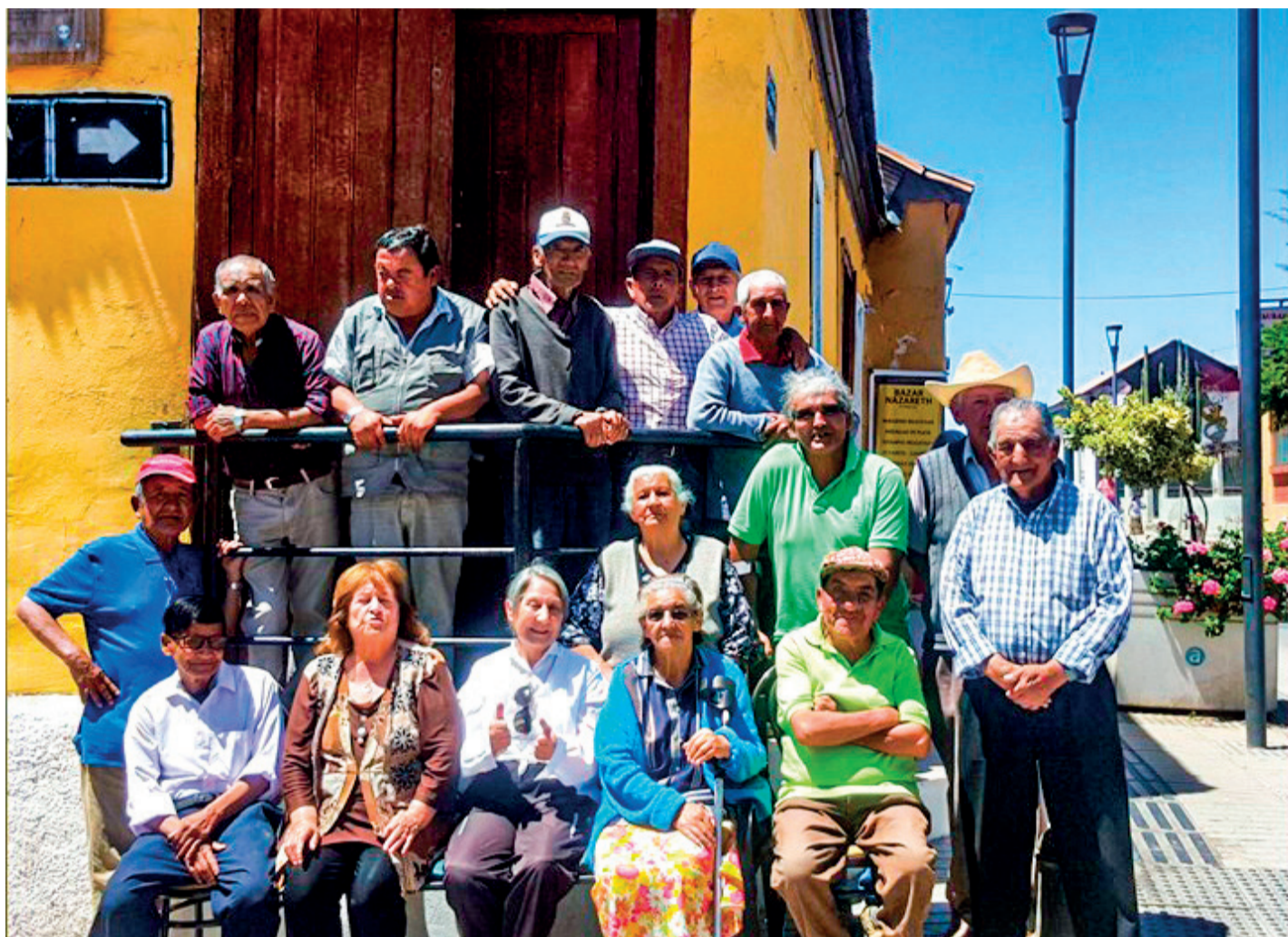
Las voluntarias del Comedor de Ancianos entregan amor y un rico plato de alimento a los abuelitos.

Si bien el local tiene la capacidad para dar almuerzo a 20 personas de la tercera