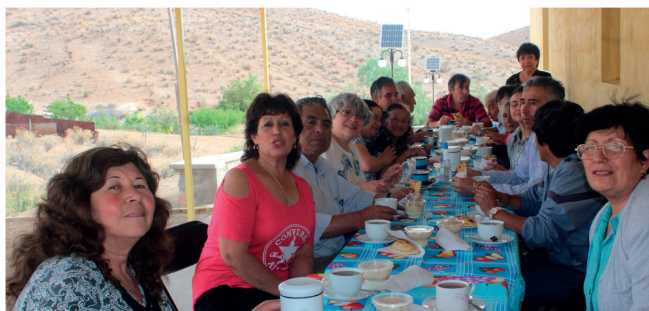
En la localidad siempre hay tiempo para encuentros entre vecinos.