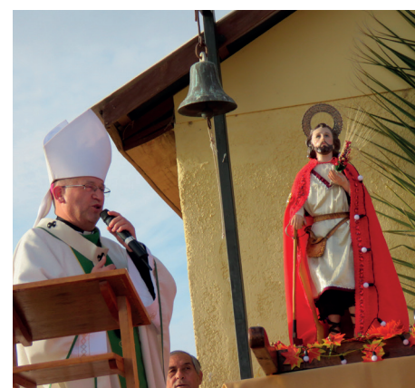
Todos los años los lugareños le piden a San Isidro por la lluvia y la prosperidad en el campo.