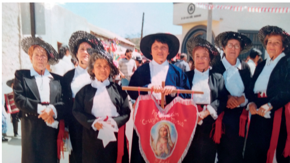
No solo es bailarina de los Chunchos de Andacollo, también participa en agrupaciones de adultos mayores.

Además de conducir el programa de televisión, fue presidenta de la Unión Comunal del Adulto Mayor. “Y si hago un balance de lo que ha sido mi vida, sabiendo que nadie es cien por ciento feliz, me siento realizada. Lo mío ha sido trabajo, trabajo y trabajo. No me quejo, es lo que me gusta y lo que me tocó vivir”.