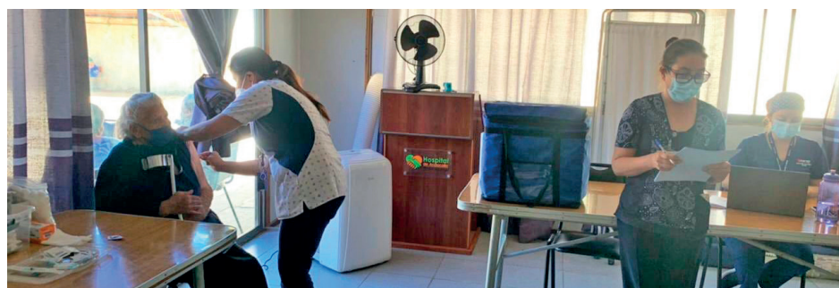
Ya van más de mil personas que se han inoculado en la comuna.