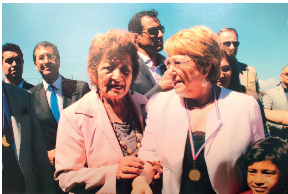
También estuvo junto a la expresidenta Michelle Bachelet.