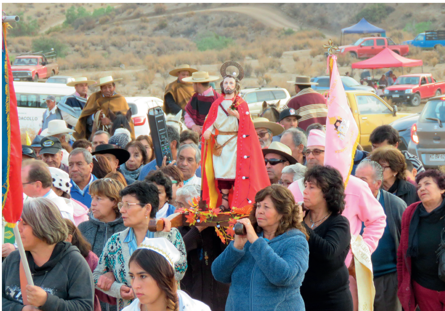
La procesión de la Fiesta de San Isidro que se celebra a fines del mes de mayo.

Esta comunidad agrícola está articulada en varios sectores, entre las que se pueden contar El Runco, Las Carditas, El Cabrito, El Azogue y La Jarilla, siendo este último el centro de la comunidad, pues ahí se ubica la sede social, la capilla y, por cierto, la cancha de fútbol.