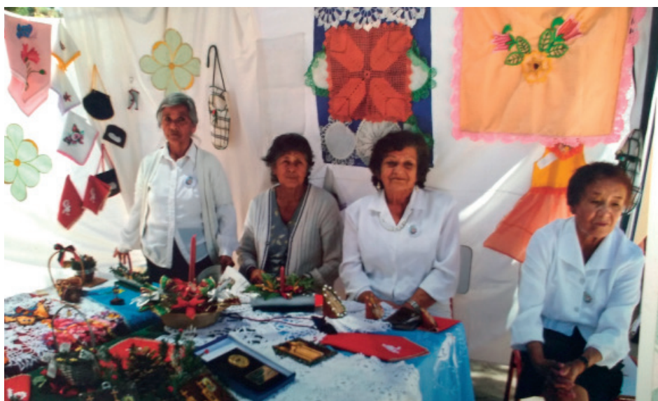
Junto a sus amigas de los centros de adultos mayores.