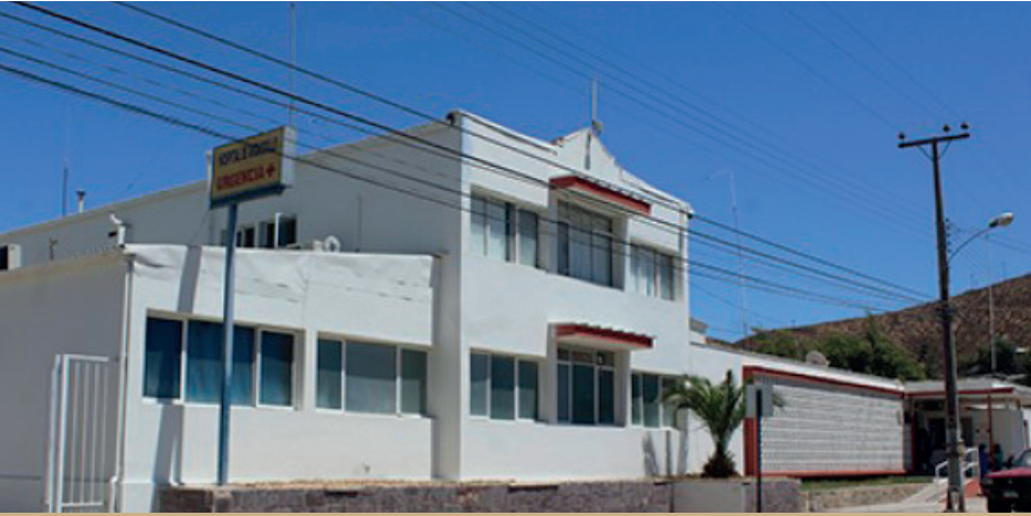
Hospital de Andacollo.

Un convenio celebrado entre Teck CDA y el Servicio Salud Coquimbo, dotará al hospital de Andacollo de nueva y mejor infraestructura en diversas áreas del recinto, lo que va en directo beneficio de pacientes y funcionarios. De la misma forma, el acuerdo también contempla la adquisición de un ventilador mecánico portable, que posibilita una respuesta rápida y oportuna ante emergencias que impliquen trasladar a los usuarios hacia recintos de salud de mayor complejidad, como La Serena o Coquimbo.