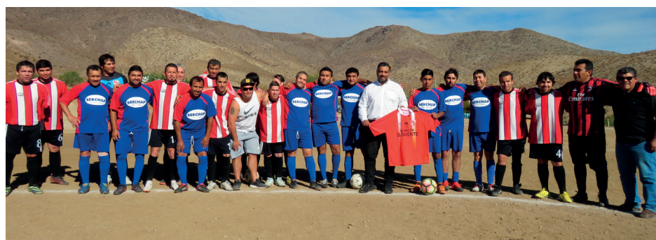
Son pocos, pero buenos los del deportivo Unión La Jarilla.