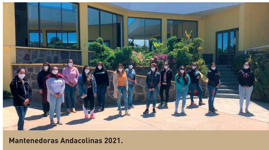
Mantenedoras Andacollinas 2021.

En esta oportunidad, postularon 351 personas y se realizaron más de 80 entrevistas. Luego de un exhaustivo proceso de selección y evaluaciones psicolaborales y preocupacionales, se