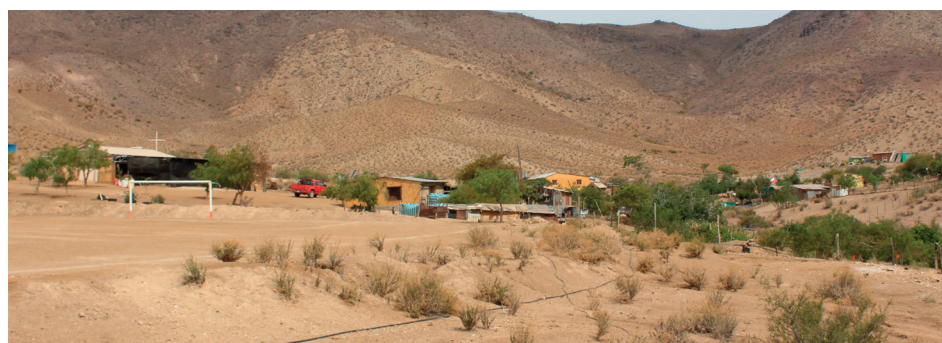
Un paisaje típico de La Jarilla y Azogue.