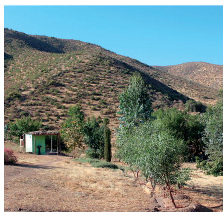
En el sector abunda el arbusto llamado Jarilla, que sirve para el dolor de estómago.