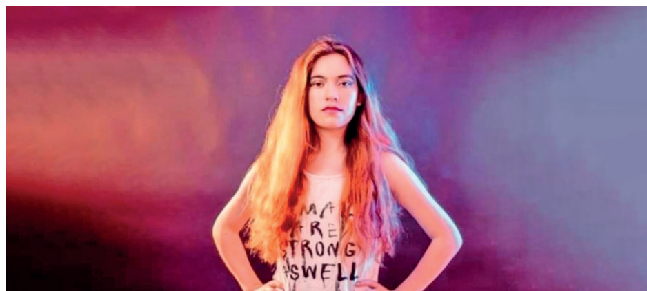
La joven continúa sorprendiendo a sus seguidores con nuevo material.

Pronto estará disponible en las principales plataformas de música online.