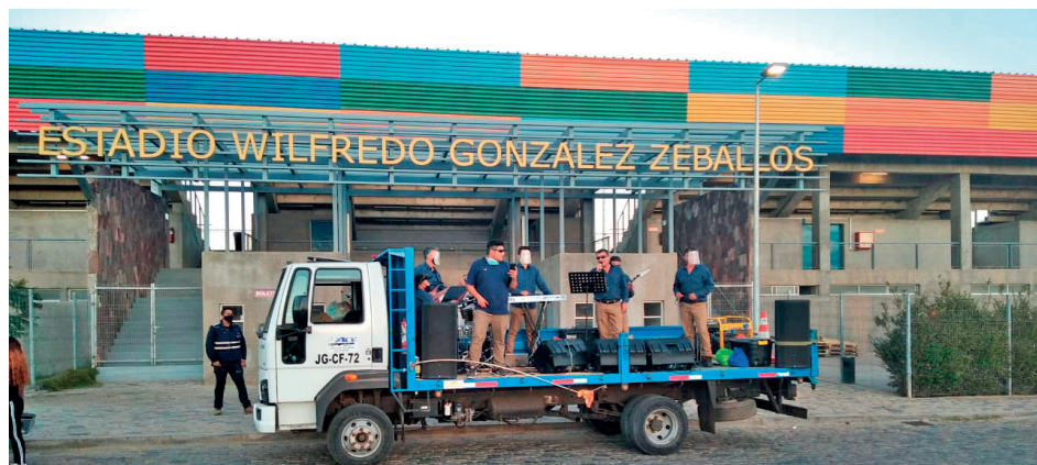
El grupo ADN Tropical llevó alegría a los vecinos y alimentos a los más vulnerables.

En la jornada se reunieron alimentos no perecibles para ir en ayuda de los más necesitados.