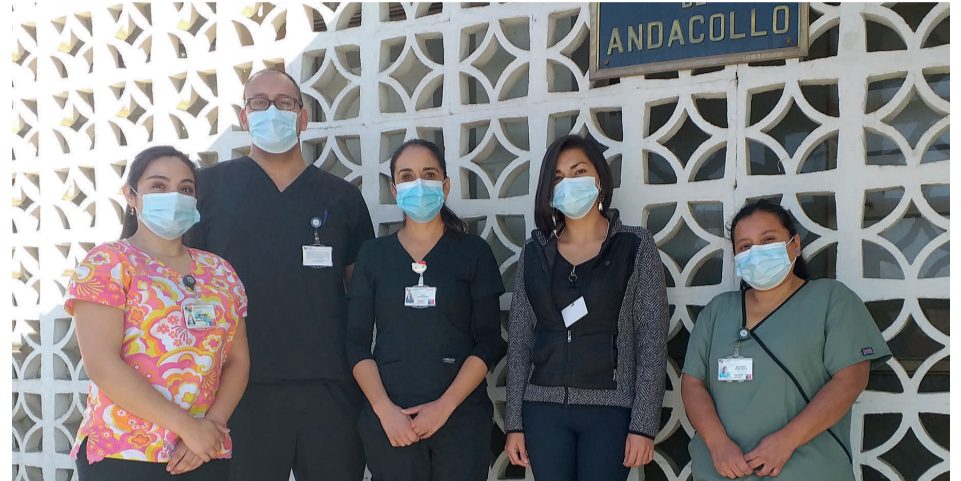
El personal del Hospital J.L. Arraño reitera al llamado al cuidado personal para evitar contraer influenza y el coronavirus.

Este año hay una baja de los cuadros respiratorios y es producto del cuidado personal para evitar el coronavirus.