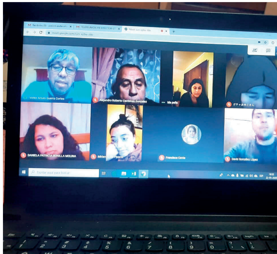
La conectividad ha sido un gran problema para la comunicación de los profesores y alumnos.

La enseñanza es multigrado desde 1° a 6° básico, donde una docente de