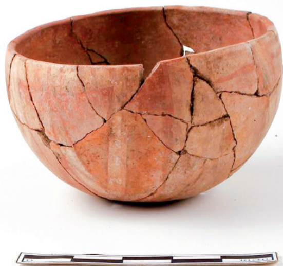
Evidencias arqueológicas encontradas en el sitio El Olivar de La Serena.

tes entregan información sobre los grupos humanos que transitaban y se asentaron en la comuna de Andacollo. Por su parte, las exposiciones temporales están al servicio para que artistas locales, artesanos y gestores culturales, puedan exhibir sus obras, expresiones artísticas y muestras a la comunidad.