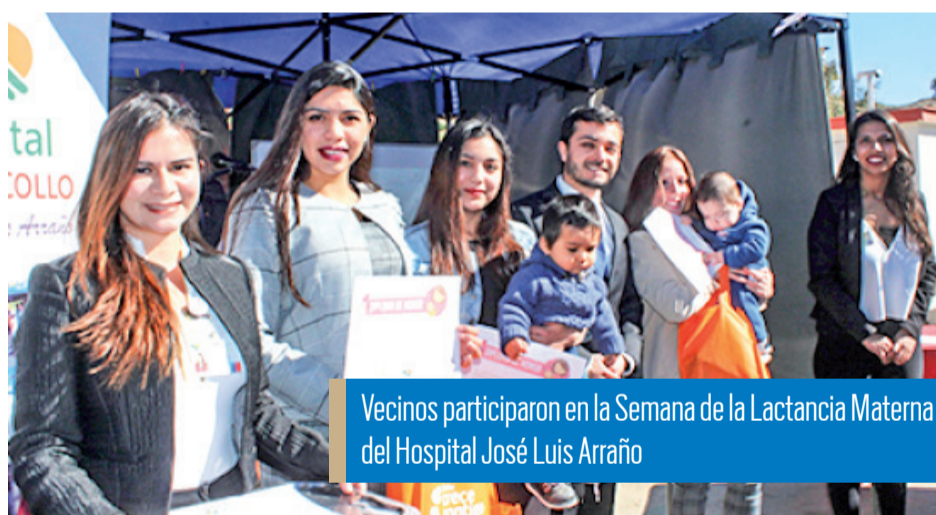
Vecinos participaron en la Semana de la Lactancia Materna del Hospital José Luis Arraño