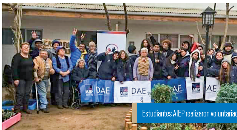
Estudiantes AIEP realizaron voluntariado a viviendas de adultos mayores.