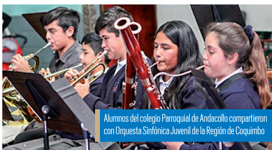
Alumnos del colegio Parroquial de Andacollo compartieron con Orquesta Sinfónica Juvenil de la Región de Coquimbo