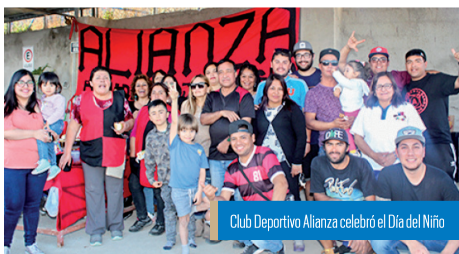
Club Deportivo Alianza celebró el Día del Niño