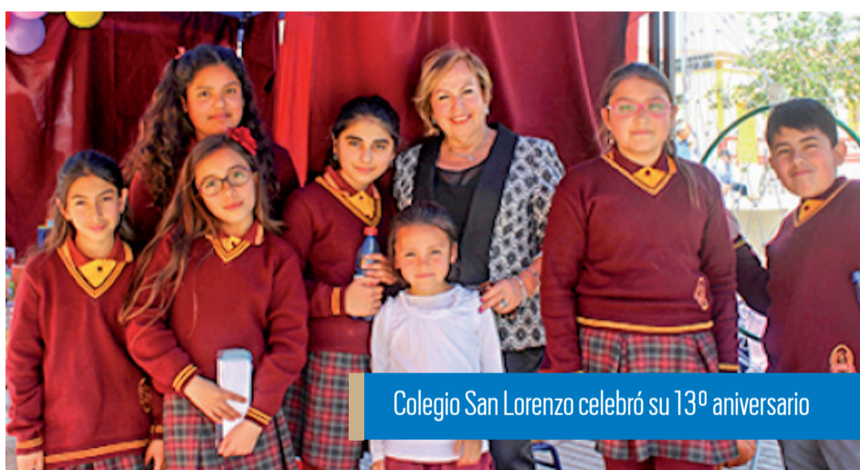
Colegio San Lorenzo celebró su 13º aniversario