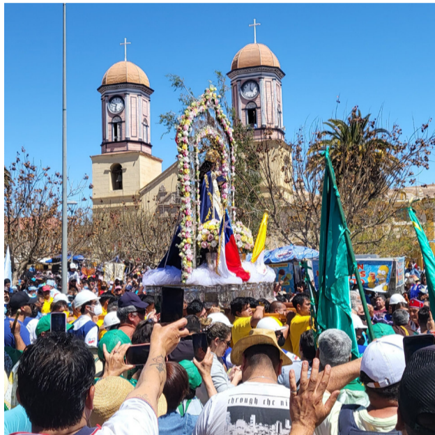
Los peregrinos saludan a La Chinita en su traslado a la Basílica Menor.

El día 26 está dedicado solo a los bailes chinos y algunos bailes que han quedado rezagados en la presentación ante la Virgen, puesto que vienen agrupaciones de danzantes desde Antofagasta, Copiapó, Valparaíso, La Ligua y Cabildo. Ese día se celebra la Solemnidad de Nuestra Señora del Rosario, además de una misa cada una hora y la procesión, debido a que ese día la Virgen regresa al Santuario Parroquial desde el Basílica Menor. Y el 27 es último día de las festividades de la Chinita, donde se oficia una misa de despedida a las 10 horas, en la Plaza Videla.