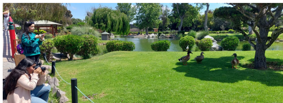
En el Parque Japonés de La Serena, los participantes del taller de fotografía mostraron sus virtudes.

Teck CDA dispone de canales directos para recepcionar opiniones, reclamos o sugerencias: