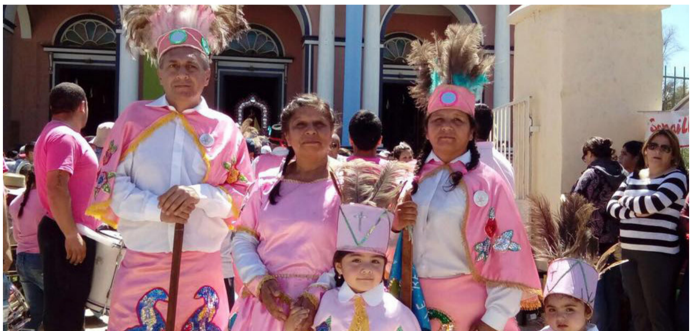
La devoción a La Chinita trasciende generaciones y son muchas las familias que rinden honor a la imagen de la Virgen a través del baile.