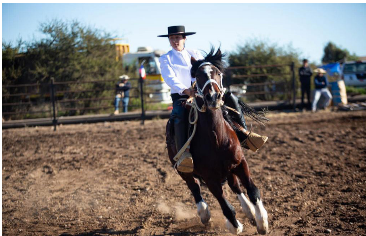
La médica veterinaria mostrando sus destrezas en la yegua Altiva.

La oriunda de El Curque es veterinaria y una apasionada de los caballos