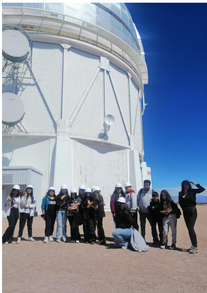
Los estudiantes se familiarizan con las estrellas visitando el Observatorio Tololo.