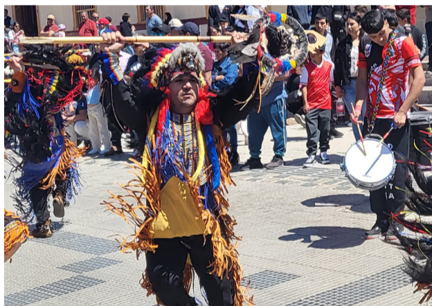
Gran esfuerzo realizan los bailarines en homenaje a la Chinita.