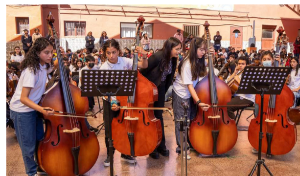
La orquesta sinfónica del Colegio Parroquial en el 5º encuentro de orquestas.