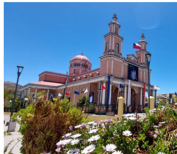
Los patrimonios de Andacollo en las fotografías de los estudiantes del taller.

Alrededor de 500 estudiantes participaron en los 12 talleres