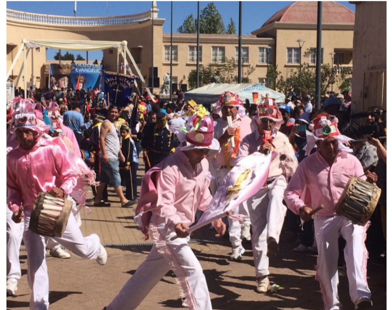
Bailes religiosos de todo Chile se darán cita en Andacollo durante la Fiesta Grande.