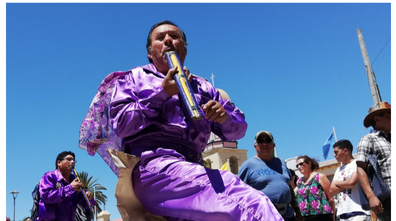
Los Bailes Chinos son los primeros en bailarle a la Virgen.