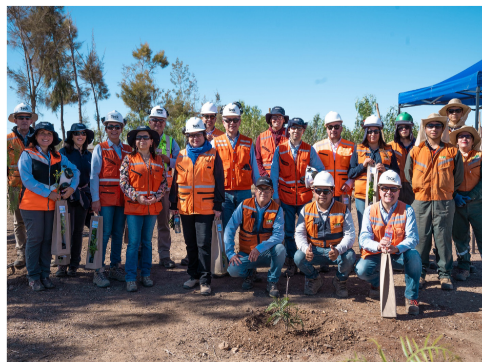
Integrantes del comité ejecutivo, trabajadores y trabajadoras y colaboradores de Teck CDA cumpliendo por sexto año con este compromiso ambiental.

La actividad contó con el respaldo de la empresa contratista local "Tres Patitos", en colaboración con miembros del Comité Ejecutivo y los trabajadores de Carmen de Andacollo, quienes se unieron para revitalizar la zona mediante la plantación de estos árboles.