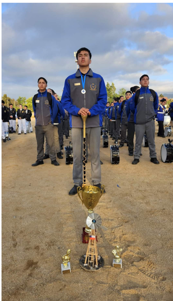
La banda instrumental suma logros en sus presentaciones.