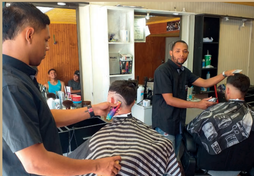
Los dominicanos llegaron a la comuna para ofrecer nuevos cortes a los jóvenes.

Los martes hay una promoción por la manicura y acrílico permanente. Puedes hacer tu cita al +56972823972.