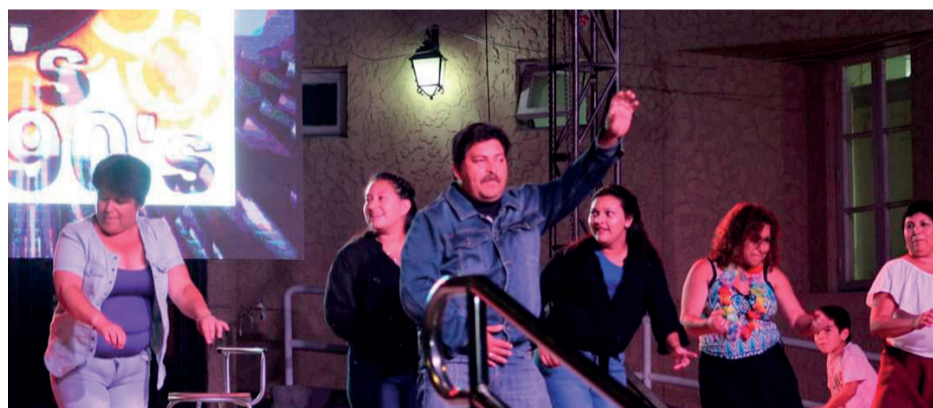
Todos participan para ganar cada una de las atractivas competencias.

El segundo puesto, que se adjudicó 300.000, fue para la agrupación Los Litres, mientras que el tercer lugar lo