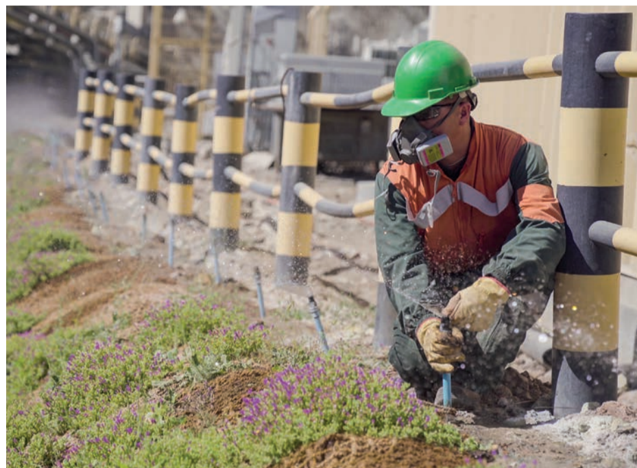
Los trabajadores de los Tres Patitos han plantados cítricos y guayacanes en la comuna.

Este emprendedor señala que su empresa fue premiada por sus buenas prácticas laborales por la Inspección del Trabajo el año 2015 y es porque “yo trabajo con personas y las trato bien”.