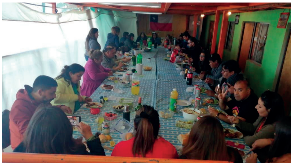
La hoperdería cuenta con un amplio y familiar comedor.