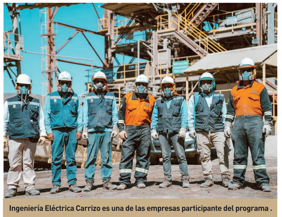
Ingeniería Eléctrica Carrizo es una de las empresas participante del programa .

y señaló que "Teck CDA tiene un compromiso muy fuerte con la comunidad y eso se ve reflejado en actividades como esta, donde tenemos empresas locales, que implican sueños que se están forjando y que quieren ir un poco más allá. Hoy lo escuchamos de la voz de distintos actores y lo que se busca es que la visión de los emprendedores de Andacollo pueda ir mucho más allá de la comuna y para eso Teck, junto a Corfo, les están dando una tremenda herramienta para que sus sueños se puedan convertir en realidad", afirmó la autoridad.