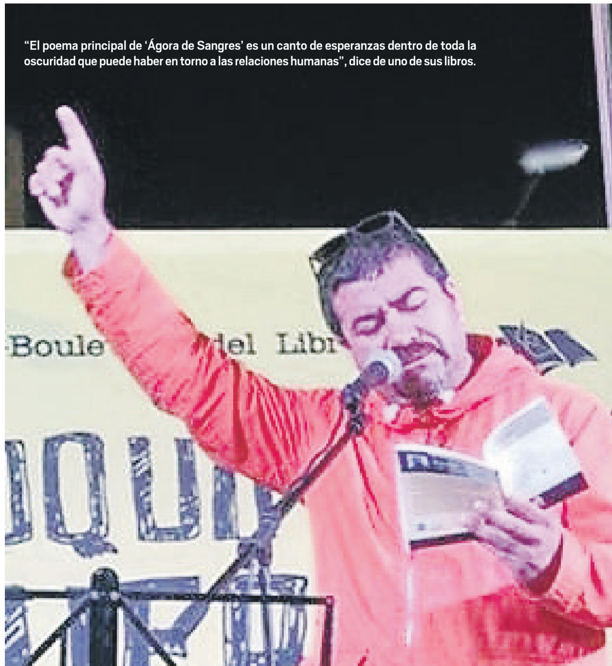
“El poema principal de ‘Ágora de Sangres’ es un canto de esperanzas dentro de toda la oscuridad que puede haber en torno a las relaciones humanas”, dice de uno de sus libros.

-Fuiste becario del Programa Movilidad de la Organización de Estados Iberoamericanos