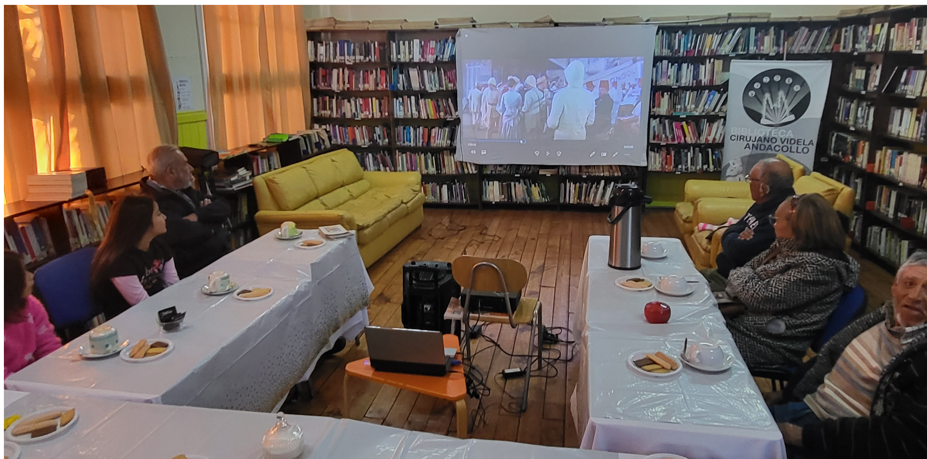
Películas clásicas y otras más contemporáneas son del gusto de los adultos mayores de las viviendas tuteladas.

En la sala de la Biblioteca "Cirujano Videla"