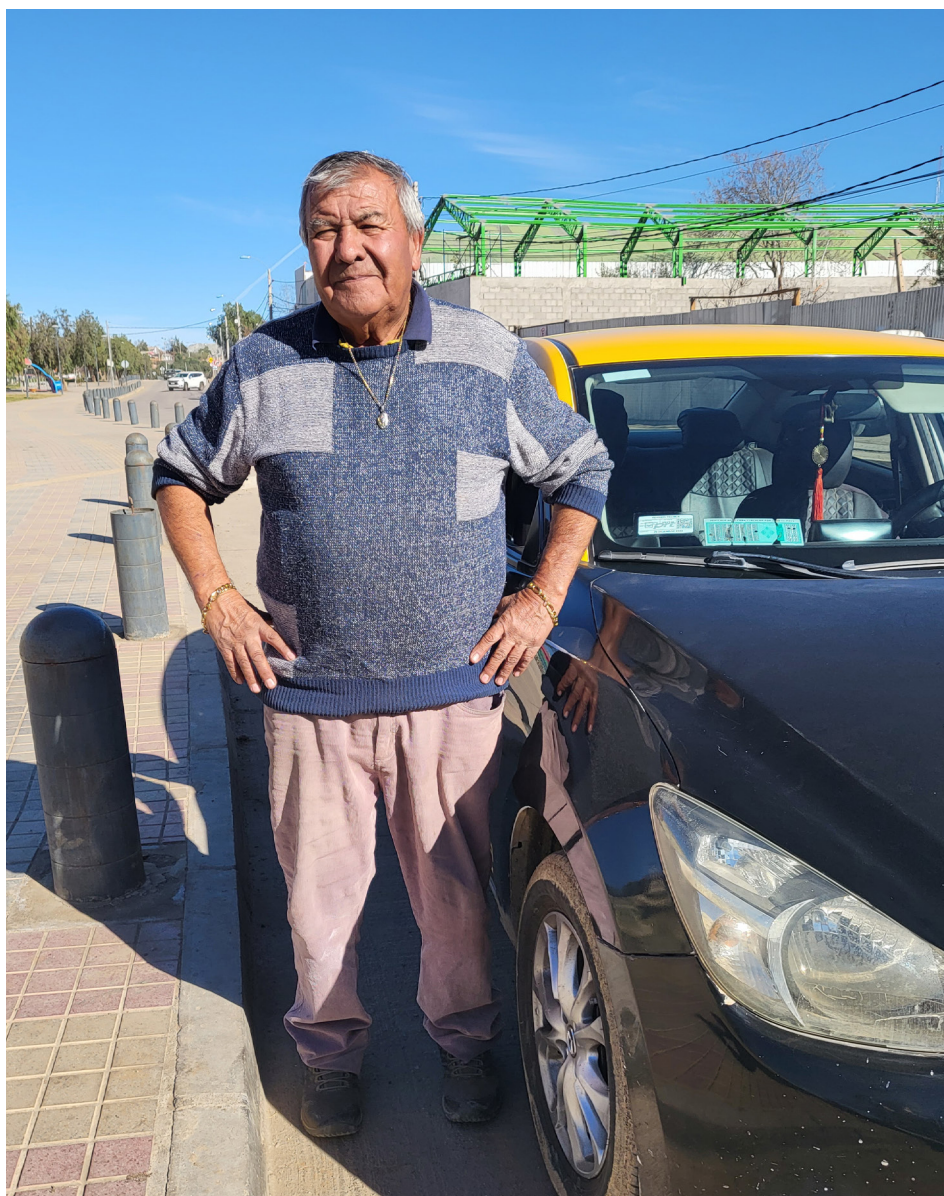
El dirigente lleva 27 años ganándose la vida con su taxi.

Fue tanquista, campeón de boxeo en Olimpiadas Militares y también minero, “pero solo fui arroz graneado”, afirma.