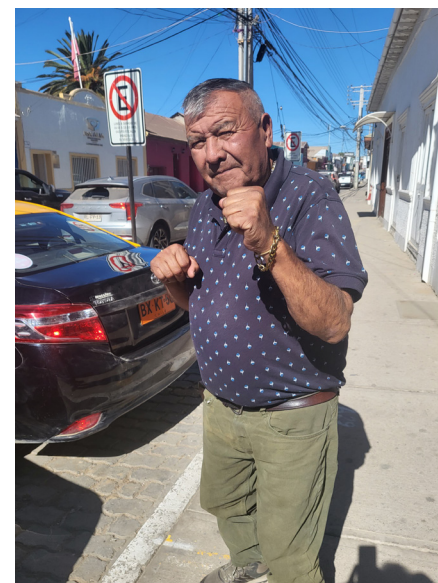
Así se paraba en el ring el presidente de los taxistas.

El sindicato de adjudicó un terreno en comodato en Calle Urmeneta y eso en el centro significa que tiene agua, luz y alcantarillado. “Lo logramos bajo mi gobierno. Además, postulamos un proyecto CAT y nos adjudicamos $50 millones para la construcción de muros de contención, los baños y los portones. Nos ha ido espectacular y en septiembre podríamos estar inaugurando nuestra sede. Un sueño cumplido para el gremio, que lleva muchos años sentado en la calle, y una medalla para este humilde servidor”.