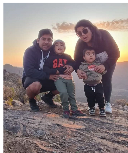
Junto a su familia en un día de recreación.