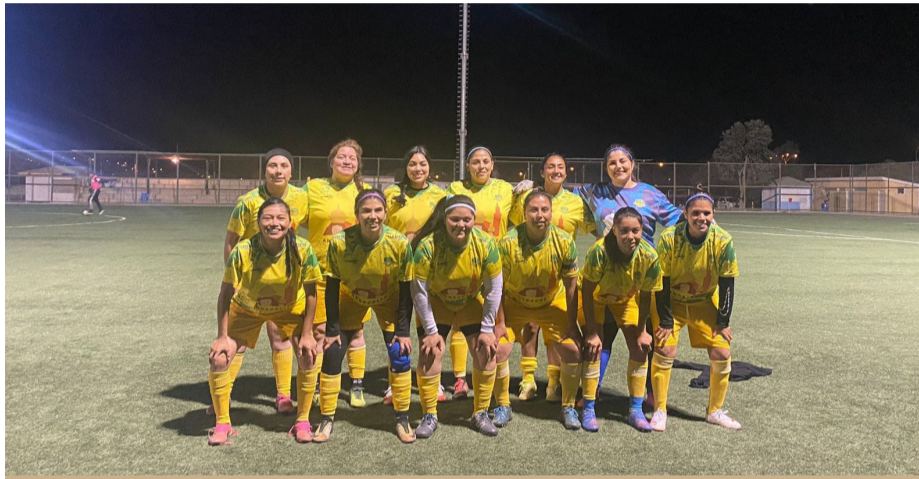
Una intensa preparación está realizando la selección para disputar el hexagonal de Salamanca.

Su objetivo es ganar los pasajes para el campeonato nacional que se jugará en Villarrica y Licán Ray.