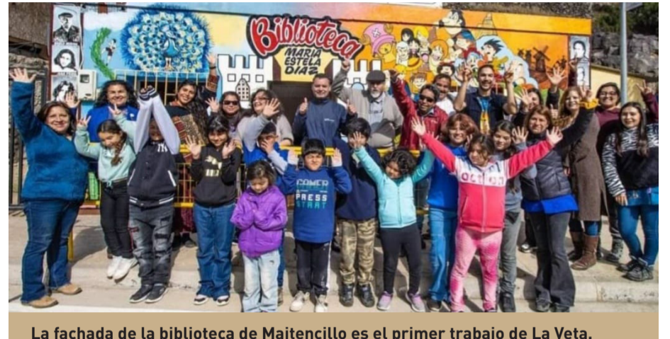
La fachada de la biblioteca de Maitencillo es el primer trabajo de La Veta.

La agrupación también pintó la fachada de la biblioteca de Maitencillo.