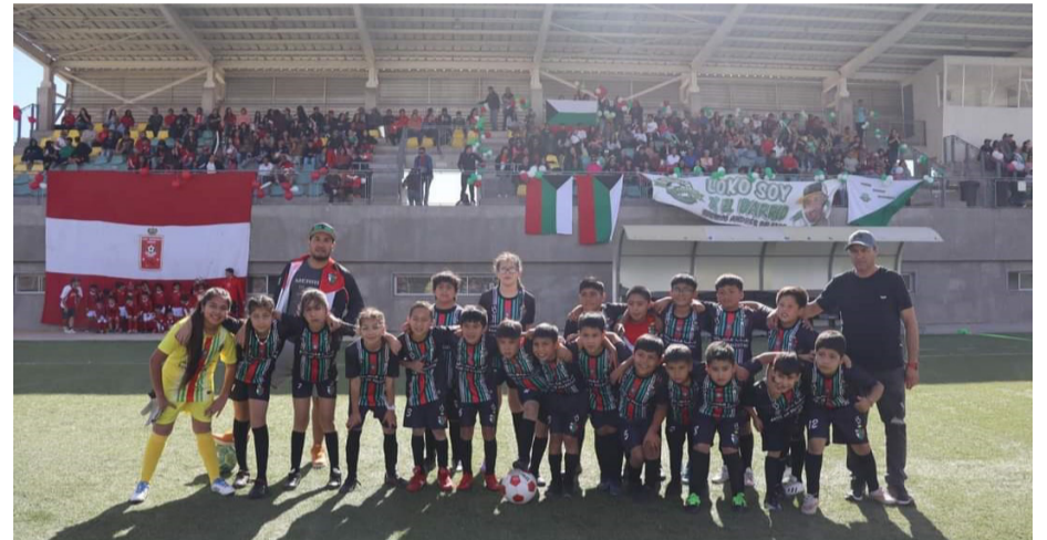
El equipo mixto de Palestino tienen gran coraje.