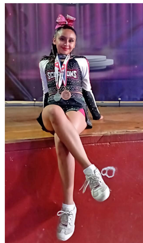
La animadora de Scorpions Allstars de La Serena tiene grandes sueños.