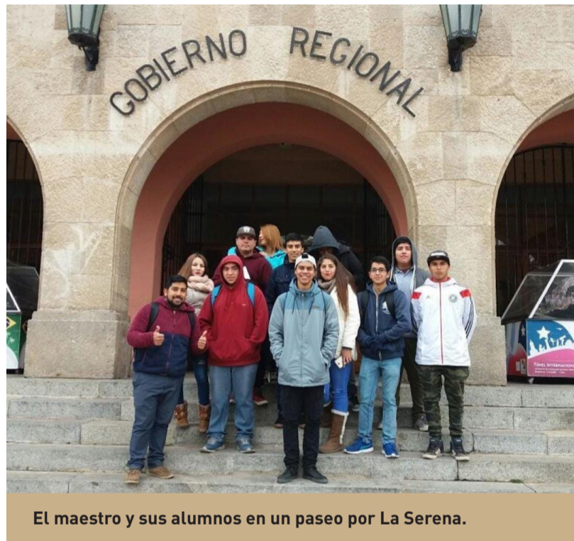
El maestro y sus alumnos en un paseo por La Serena.

Para el docente del PRVO, además de las letras, la filosofía es lo que más le apasiona enseñar, “porque hay que transmitirles el pensamiento crítico, posturas distintas frente a la vida y abrirles un poco su capital cultural a los niños y niñas”.