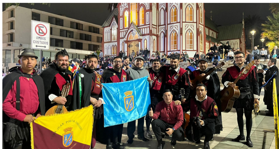
La agrupación andacollina ha tenido un año con muchas actividades.

Y antes de festival de tunas en Punitaqui, el director quiere hacer una intervención en la comuna para hacer un llamado, además de juntar algunos pesos con serenatas y tocar en algunos locales. “Somos baratos, porque la idea es mostrar nuestro arte”, concluye el director.