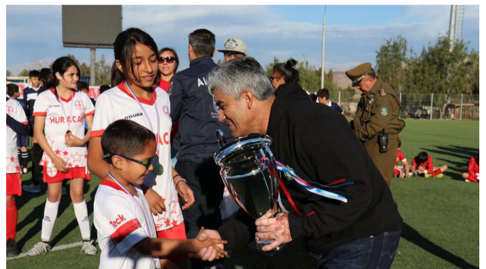
El presidente de la AFA, Javier Vicencio, entregando una copa al futuro de Huracán.