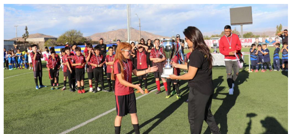
Las niñas disfrutaron jugando y también con la copa.