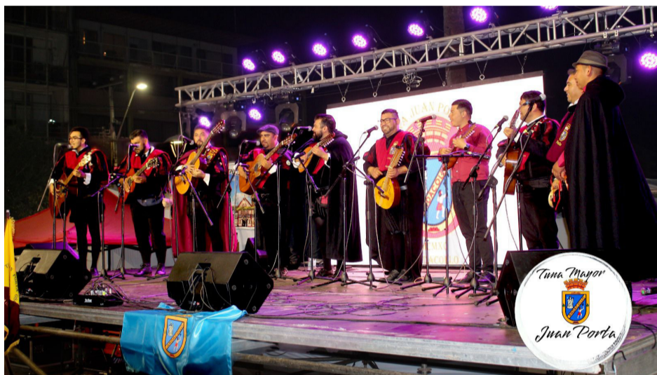
En los escenarios del norte chileno han mostrado su arte.

Para costear su permanencia en el arte de la música están disponibles para serenatas y tocar en locales.