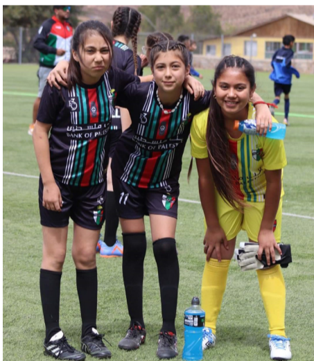
Además de buenas para los estudios, también la pisan y no se caen.

Y en lo relacionado al equipo que dio la vuelta olímpica, el presidente de la AFA fue muy salomónico porque en el campeonato de marcha blanca “Todos son campeones”. Y así quedó demostrado en el desfile de clausura, puesto que los ocho clubes participantes recibieron una copa.