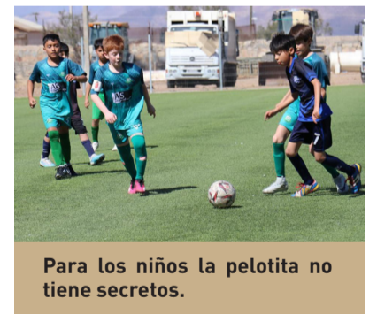
Para los niños la pelotita no tiene secretos.