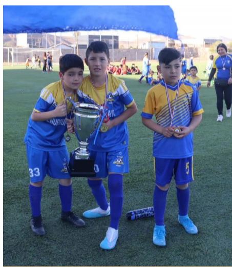
Felices quedaron estos pequeños de Churrumata con su trofeo.