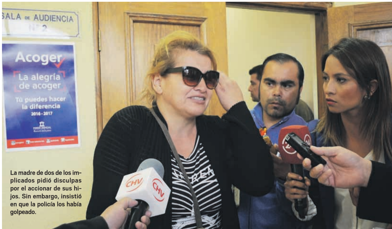
La madre de dos de los implicados pidió disculpas por el accionar de sus hijos. Sin embargo, insistió en que la policía los había golpeado.