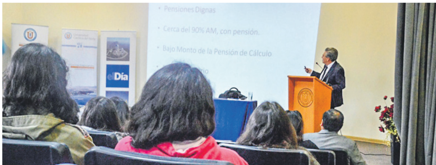
El 10 de noviembre se efectuó la cuarta versión de las Cátedras de Economía Social y Solidaria, cuyo tema central en esta oportunidad fue "Repensando el sistema de pensiones y AFP en Chile".

A esto se suma la participación de alumnos de último año en el IX Congreso Chileno de Ventas: "Vacas Flacas. Ideas Gordas".