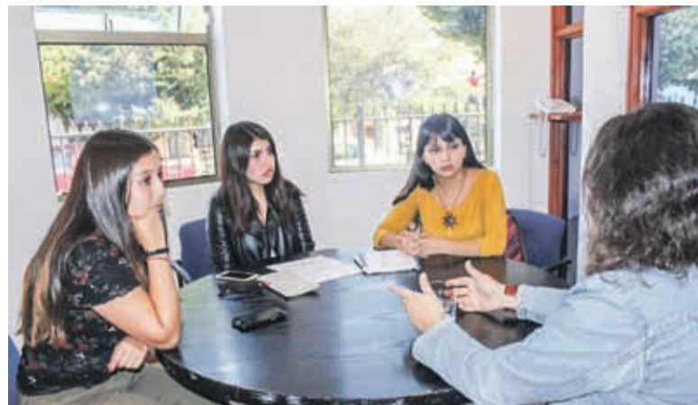
Alianza con el Centro de Desarrollo de Negocios de Sercotec en La Serena. CDN – UCN .