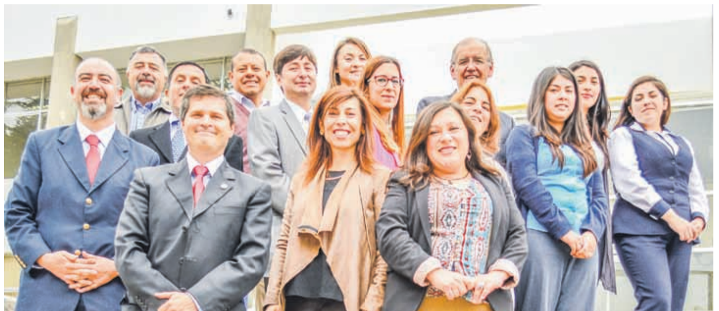
Un equipo de profesionales de excelencia académica y funcionaria da vida a la Escuela de Ciencias Empresariales de la Universidad Católica del Norte.

Esta unidad académica nació formalmente el 4 de enero de 1993, día en el que se firmó el decreto que le dio vida.