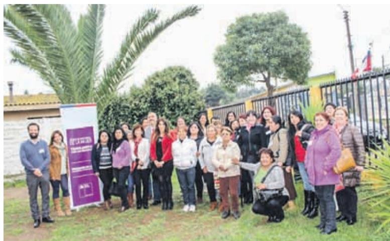
Escuelas de Emprendimiento Femenino. SERNAMEG – UCN.

Los convenios de intercambio permiten todos los semestres el intercambio de alumnos y académicos con instituciones tales como la Neoma Business School de Francia; la Universidad de Flensburg, en Alemania y la Universidad de Mondragón, en España.