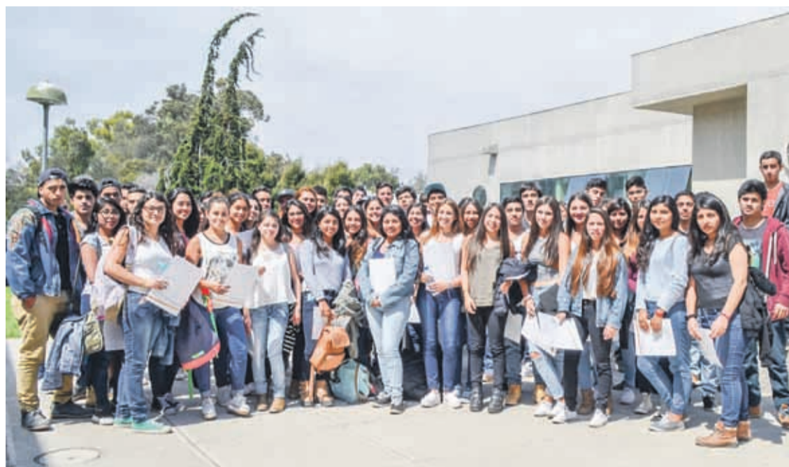
Más de 800 alumnos hoy son parte de la Escuela de Ciencias Empresariales, la más importante escuela de negocios de la zona norte.

Su proyecto educativo le distingue como una escuela de excelencia, innovadora y fuertemente vinculada con su entorno.