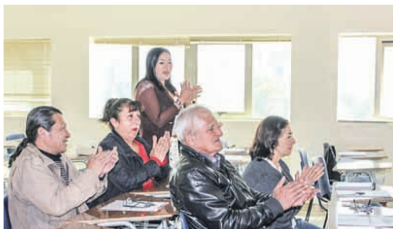
Formación de red emprendedores, microempresarios y empresarios indígenas. CONADI – UCN.