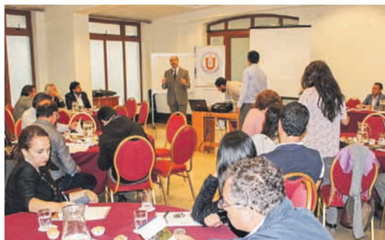
Programa Estratégico Regional Bioproductos Marinos. CORFO – UCN .