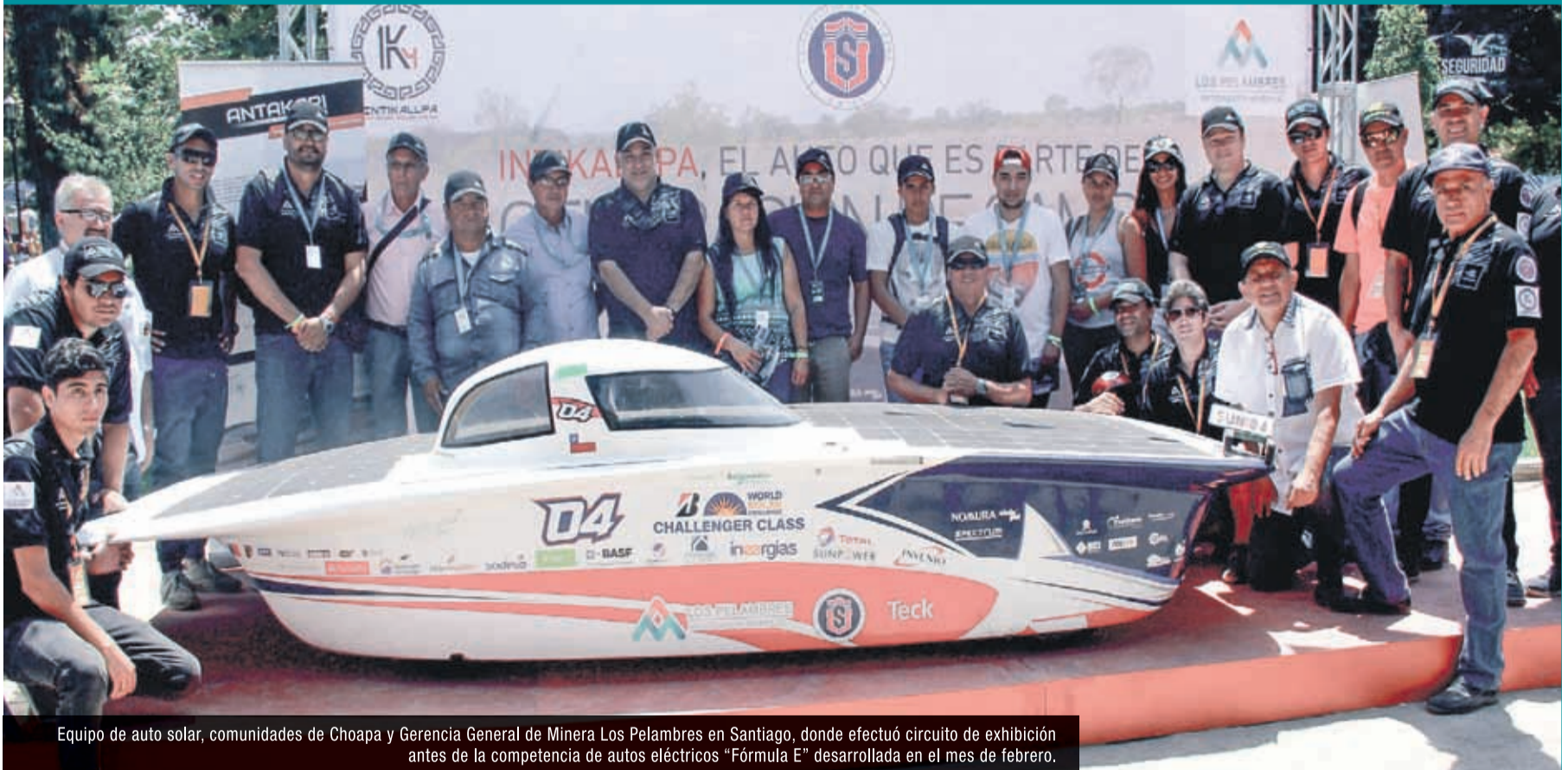
Equipo de auto solar, comunidades de Choapa y Gerencia General de Minera Los Pelambres en Santiago, donde efectuó circuito de exhibición antes de la competencia de autos eléctricos “Fórmula E” desarrollada en el mes de febrero.