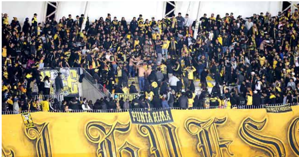
La inscripción en el registro aún es voluntaria y se debe realizar en 'registrodelhincha.cl'.

"Su implementación no es algo de un día para otro, se deben realizar gestiones desde la ANFP, como también gestiones públicas desde el legislativo, que amparen a los clubes y otorguen la facultad de poder exigir este requisito a todo hincha y así evitar una lluvia de recursos de protección, como también un pronunciamiento del SERNAC respecto de los abonos ya vendidos por