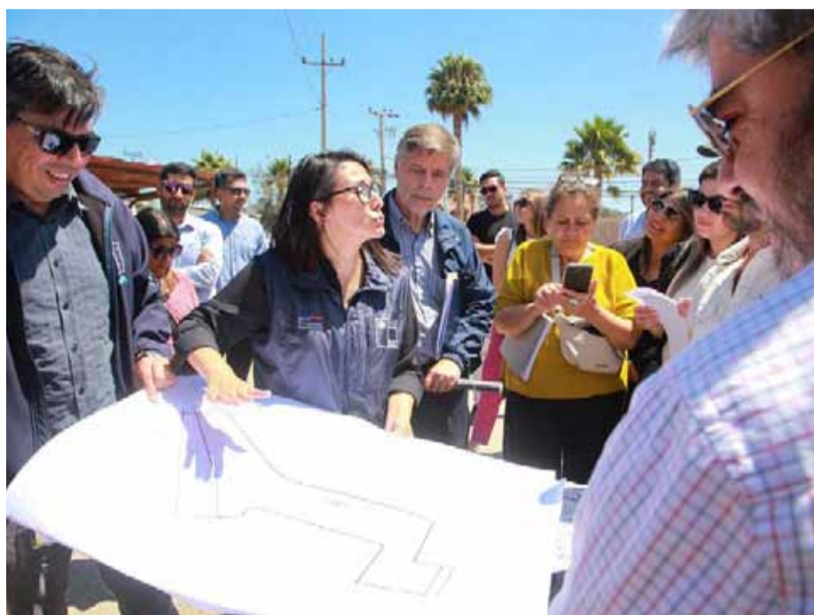
Las bases exigen contratación de trabajadores de la zona.

Cabe recordar que este proyecto es parte del plan de reactivación económica, generando cientos de empleos en su etapa de construcción en una comuna golpeada por la crisis económica. Por ello, dentro de las bases se exige que sean contratados trabajadores de la zona y también se dará un puntaje especial a la contratación de mano de obra femenina.