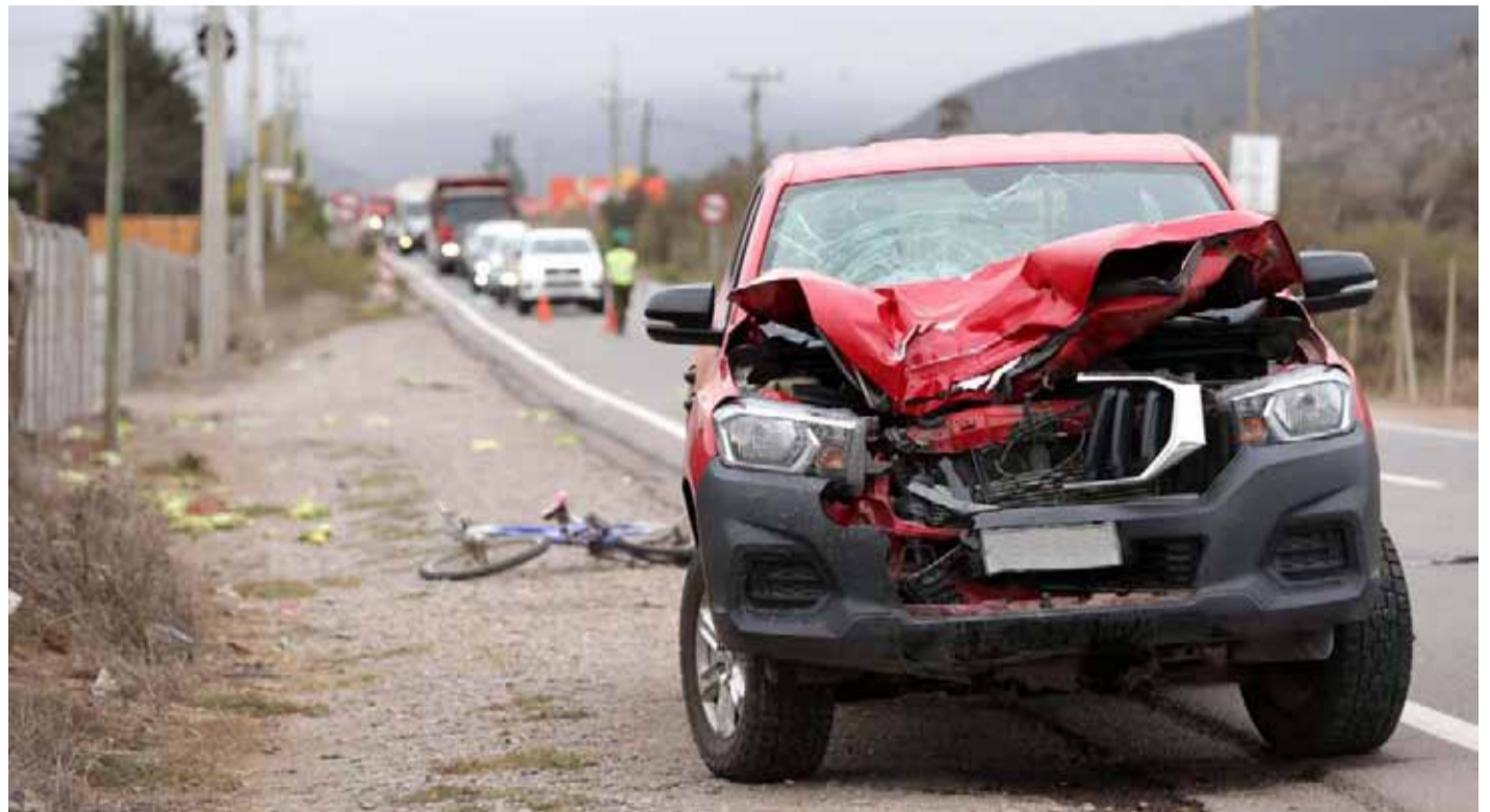
El atropello ocurrió a las 6.30 horas, cerca de la localidad de Pelicana.

En conversación con El Día, la hermana de la víctima lamenta que el conductor de la camioneta se encuentre libre a la espera de citación. Afirma no haber recibido disculpas por la tragedia y buscan asesorarse con un abogado.