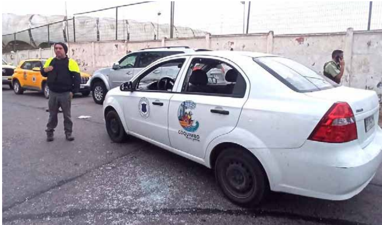
Fue el 8 de septiembre cuando ocurrió el atraco en las cercanías del estadio Francisco Sánchez Rumoroso.