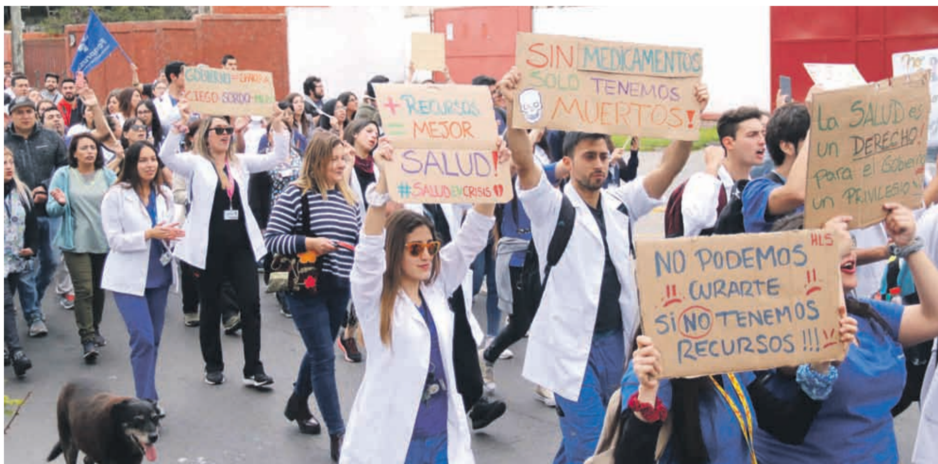
Para las 11 horas está programada la manifestación pacífica que se enmarca en el paro nacional convocado por la Mesa de Unidad Social.