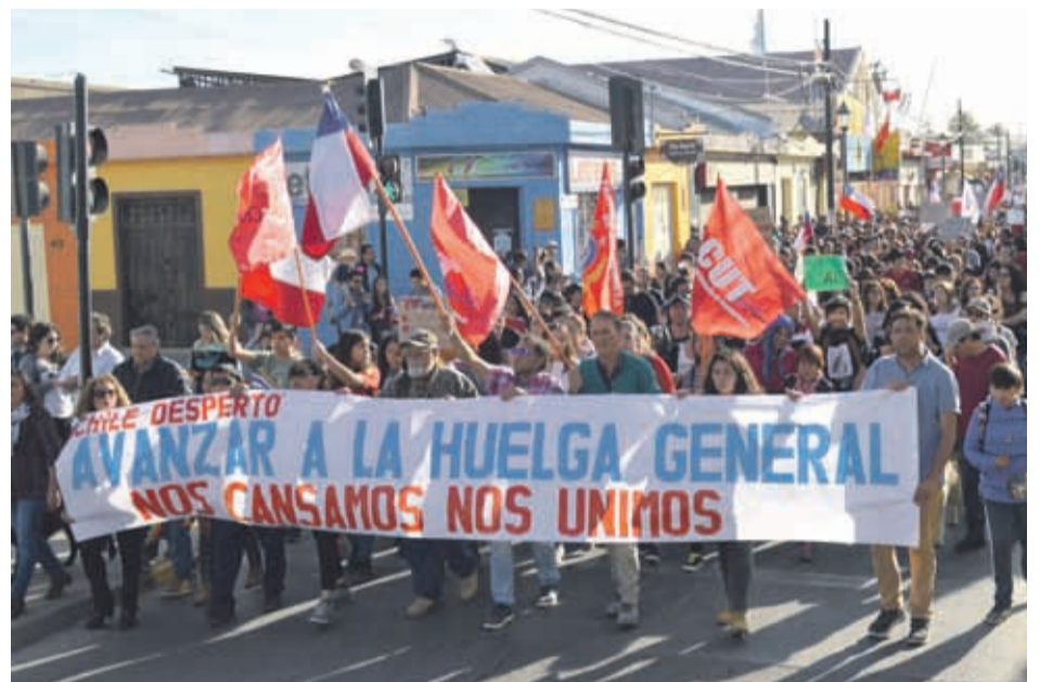
Miles de manifestantes han salido a las calles de Ovalle.