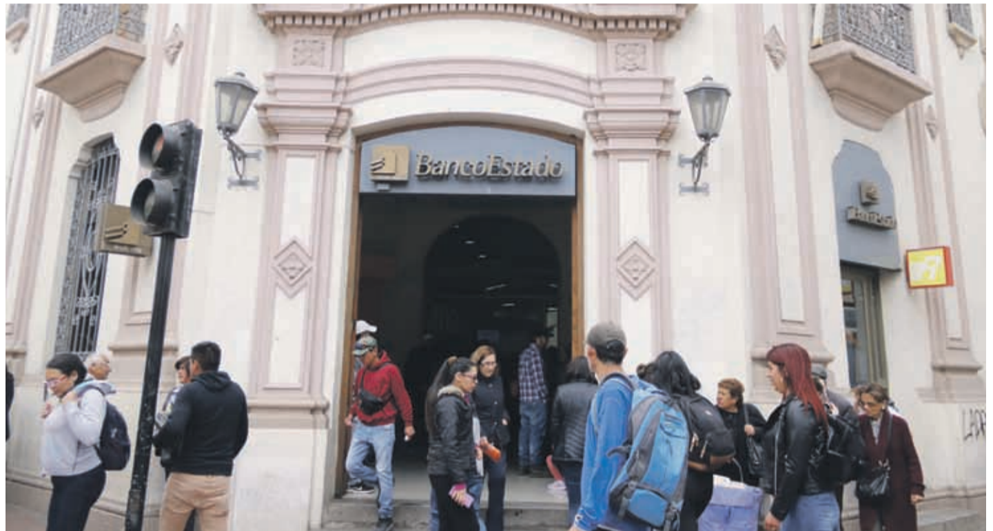
El BancoEstado, uno de los más concurridos, ayer atendía con normalidad, aunque se vio un número inusitado de personas que llegó a sus dependencias. Atendió como siempre hasta las dos de la tarde.