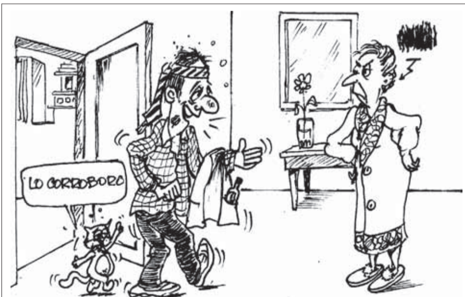
EXCUSA CON TOQUE

Vieja... No tenía Salvoconducto y me quedé toda la noche en la oficina.