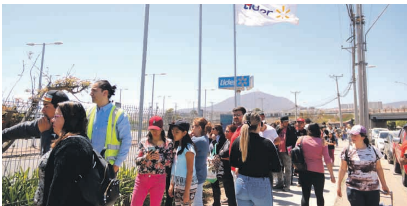
Este martes siguieron viéndose largas filas a la salida de los supermercados.