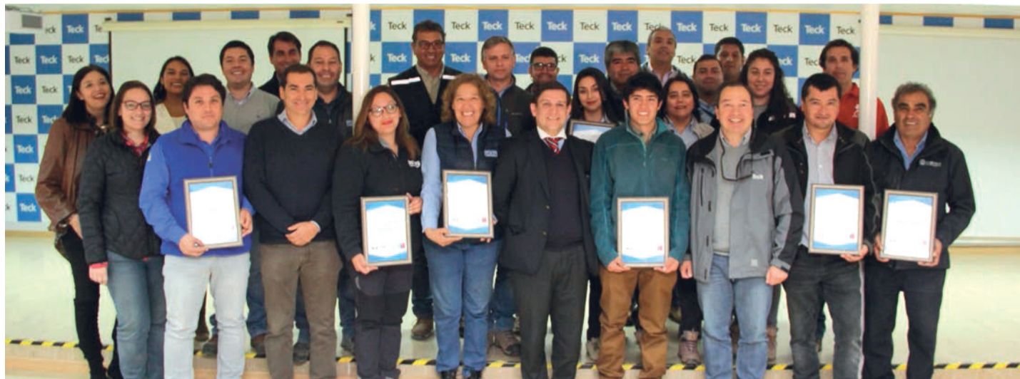
Empresas andacollinas reconocidas por su participación en el Programa de Desarrollo de Proveedores Locales (PDP).