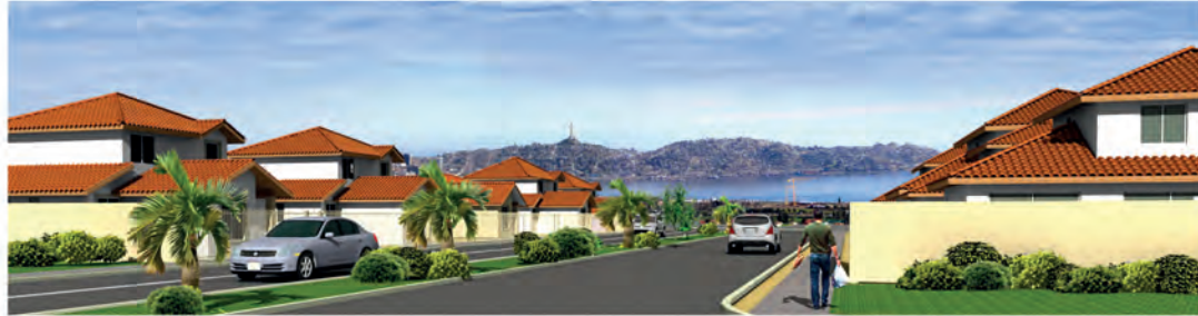
CASA TIPO A-116

Conozca nuestro Nuevo Proyecto en Coquimbo