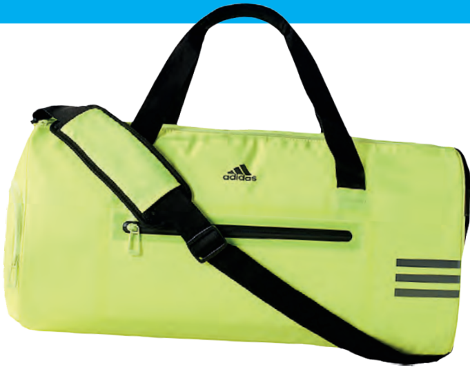
Bolso deportivo Adidas.