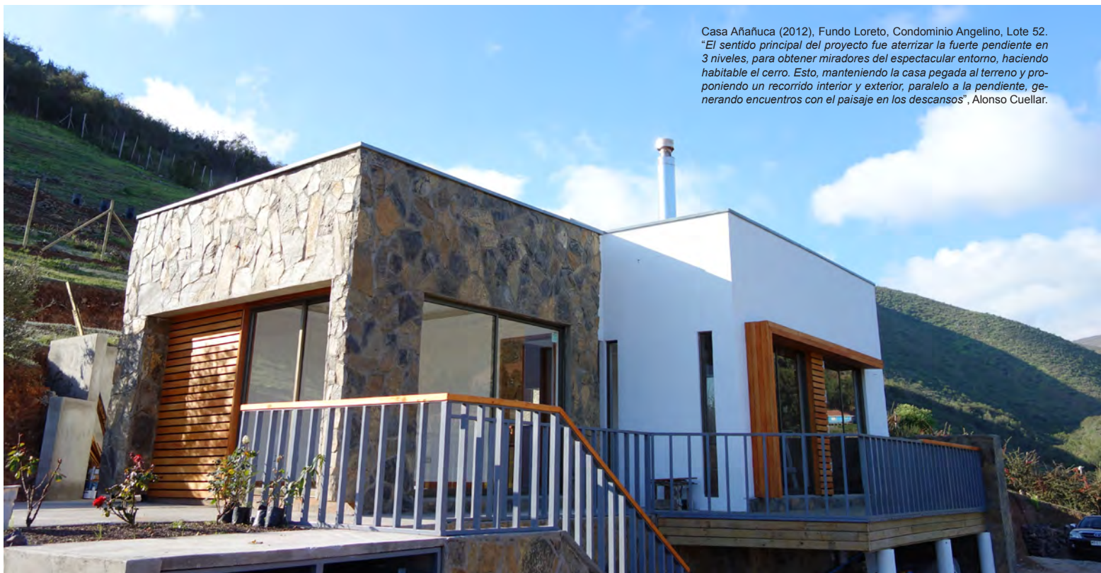
Casa Añañuca (2012), Fundo Loreto, Condominio Angelino, Lote 52. "El sentido principal del proyecto fue aterrizar la fuerte pendiente en 3 niveles, para obtener miradores del espectacular entorno, haciendo habitable el cerro. Esto, manteniendo la casa pegada al terreno y proponiendo un recorrido interior y exterior, paralelo a la pendiente, generando encuentros con el paisaje en los descansos", Alonso Cuellar.

Se trata de casas que están diseñadas exclusivamente para el entorno en el cual se ubican, ya que de esta forma se puede lograr un 30% de ahorro energético aproximadamente.