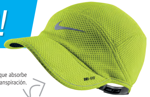
Gorro Nike que absorbe la transpiración.