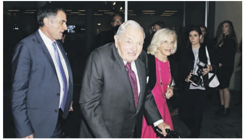
El millonario estadounidense David Rockefeller asiste a la Fiesta en el Jardín 2015 del Museo de Arte Moderno de Nueva York.

En su faceta filantrópica, ha financiado la creación del Rockefeller Center; el Museo de Arte Moderno;