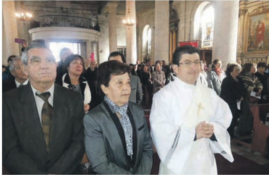
Aquí junto a sus padres el día en que fue ordenado sacerdote. Una jornada que jamás olvidará.