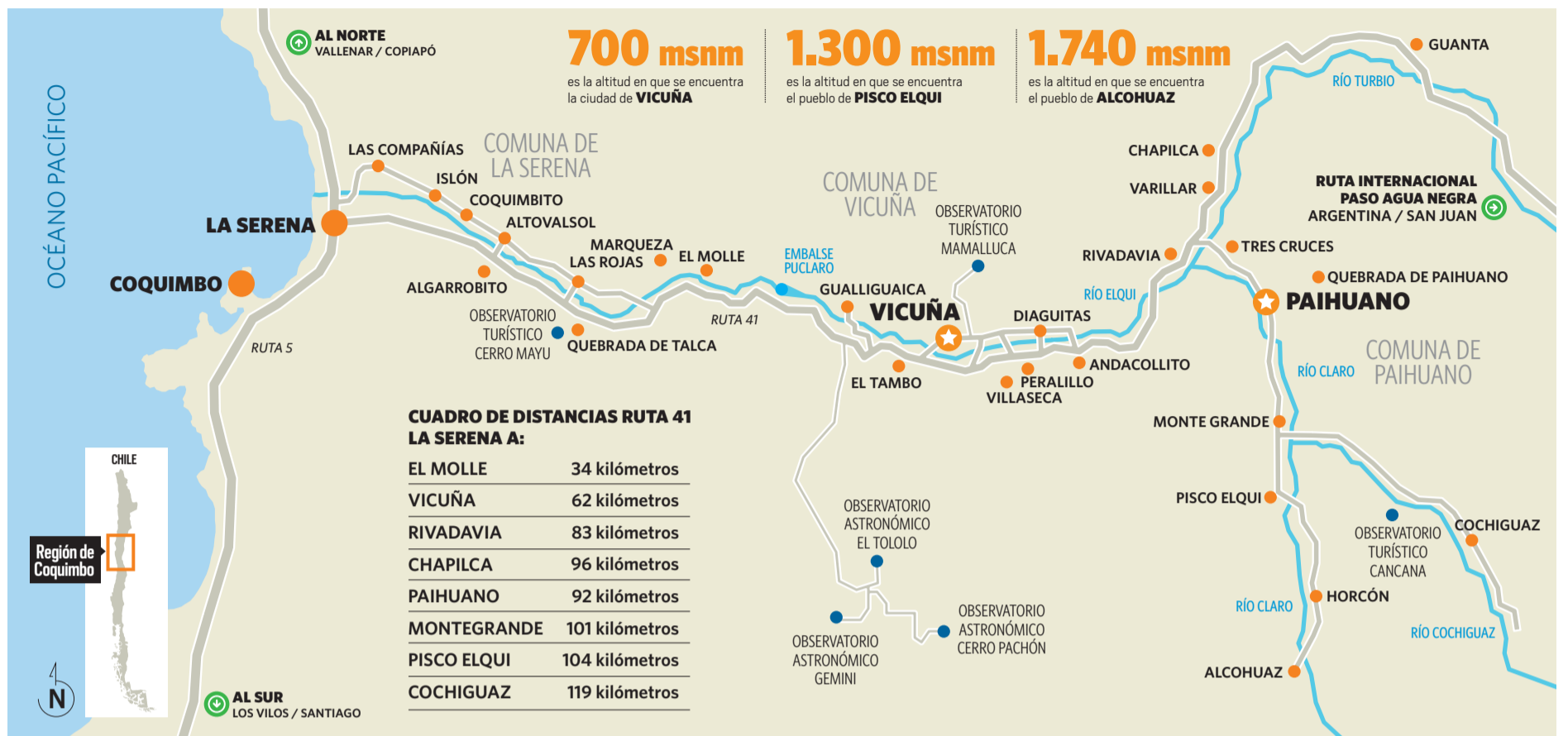
Infografía Javier Rojas D.

tualmente, con más espacio modificada, se ubica el Museo Gabriela Mistral.