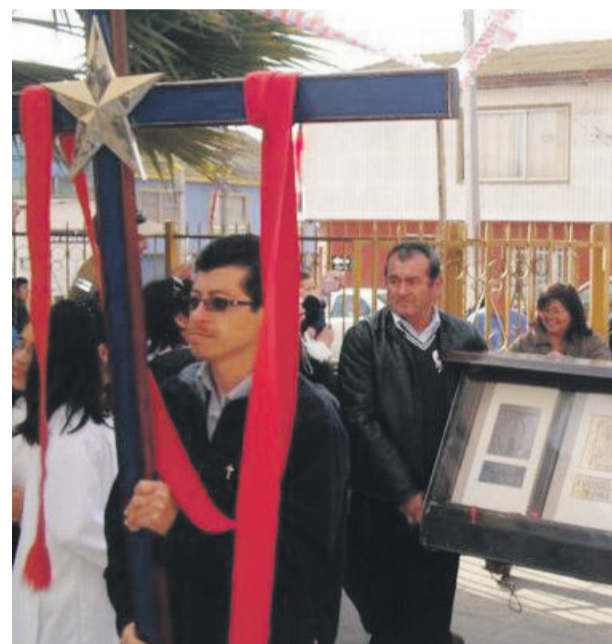
Durante una misión religiosa el año 2005 el sacerdote lleva una cruz con los colores de Chile.

estudios de enseñanza media el camino natural sería que ingresara inmediatamente al seminario para convertirse en sacerdote. Pero aquello no ocurrió. Cuando recuerda ese momento, su expresión parece cambiar y un tono de seriedad invade su voz. “Fue algo que pensé mucho, que lo medité, pero creo que no era el momento indicado. Sentí el llamado, pero no fue tan fuerte como el que sentí