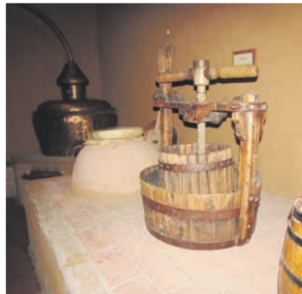
Máquinas e implementos antiguos con los que se trabaja antiguamente para la elaboración del licor.