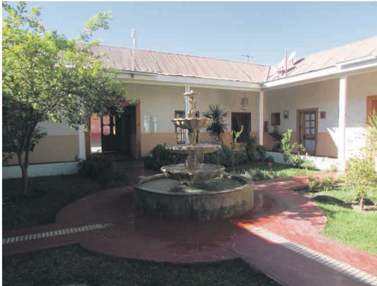
Hostal Terral de Elqui, ubicado a una cuadra de la Plaza de Armas de Vicuña, lleva el nombre del viento cordillerano típico del valle.

Otro de los puntos gastronómicos a visitar, se ubica a un costado de la Plaza de Armas, en calle San Martín. El “Club