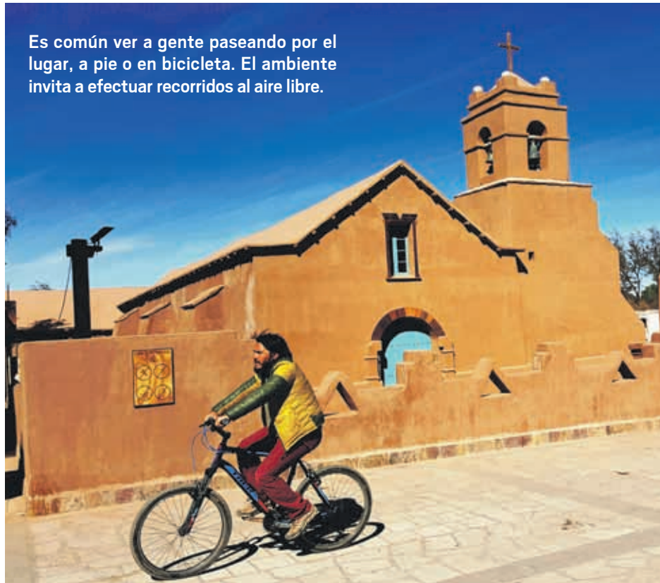
Es común ver a gente paseando por el lugar, a pie o en bicicleta. El ambiente invita a efectuar recorridos al aire libre.

Esto fue posible gracias al trabajo del padre jesuita Gustavo Le Paige, quien dedicó gran parte de su vida en la zona a la búsqueda, la recolección y estudio de restos arqueológicos de la zona. El sacerdote nacido en Bélgica, se radicó en San Pedro de Atacama el año 1955. Dos años más tarde abrió en la que era su casa parroquial el primer museo abierto a la comunidad. Ya en 1963, inauguró el primer