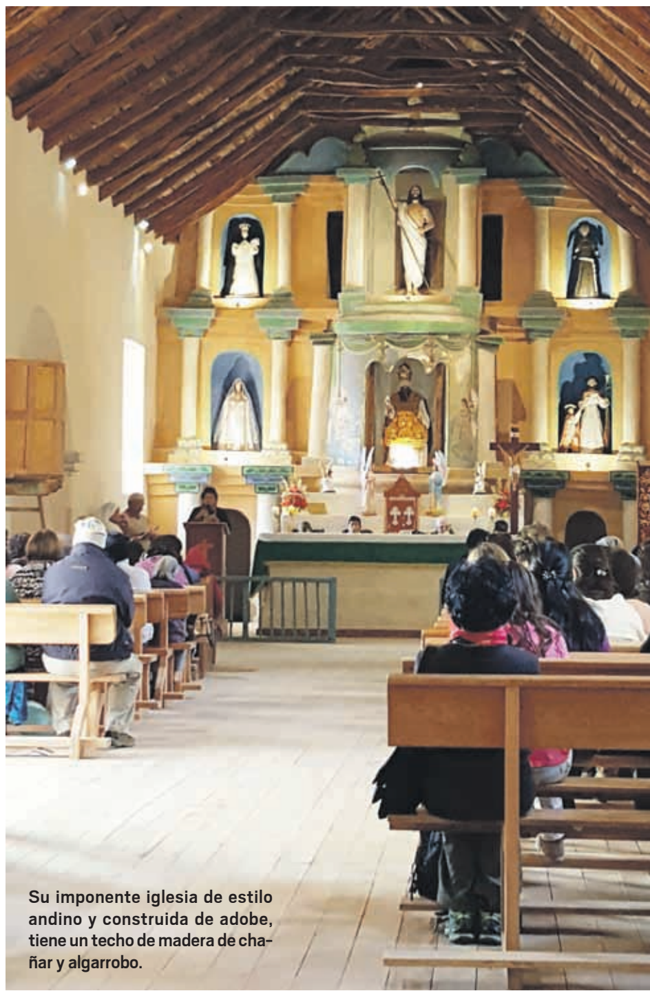
Su imponente iglesia de estilo andino y construida de adobe, tiene un techo de madera de chañar y algarrobo.

➔ Uno de los principales destinos de nuestro país se destaca por la llegada de visitantes de todos los lugares del mundo y la protección a su patrimonio arqueológico y cultural.