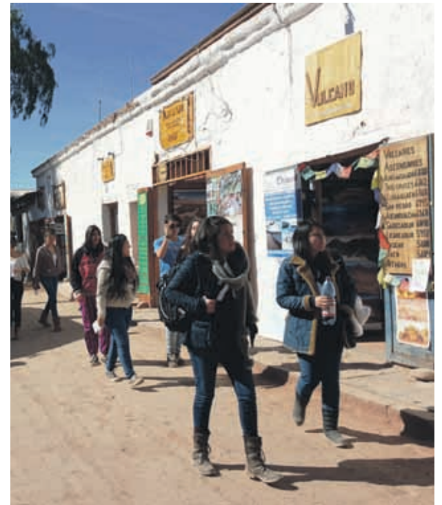
Las construcciones antiguas mezcladas con el comercio son uno de los atractivos de San Pedro de Atacama.

indicó que buscan poner a disposición de los visitantes las miles de piezas que están guardadas en sus bodegas debido a la falta de espacio. “El museo que tenemos hoy no cumple con los requerimientos para que la gente pueda disfrutar de toda las piezas