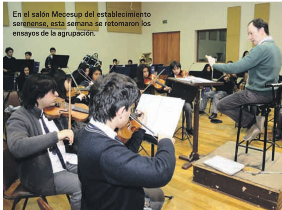
En el salón Mecesus del establecimiento serenense, esta semana se retomaron los ensayos de la agrupación.