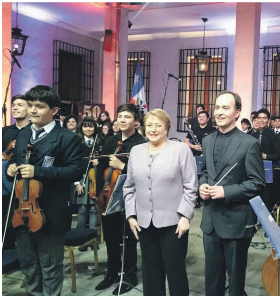
Una imagen para el recuerdo y para la historia. La Escuela Experimental de Música Jorge Peña Hen en La Moneda, con la Presidenta.

Los representantes de nuestra zona aprovecharon de dar a conocer el quehacer cultural que realizan como establecimiento y que han mantenido activo durante 50 años, a través de giras y conciertos en otros recintos educacionales, tanto de la Región de Coquimbo como de diversas ciudades del país.