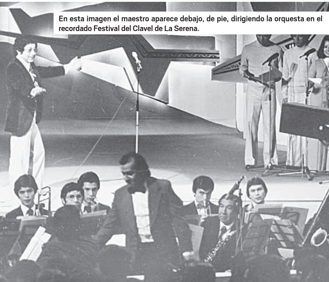
En esta imagen el maestro aparece debajo, de pie, dirigiendo la orquesta en el recordado Festival del Clavel de La Serena.