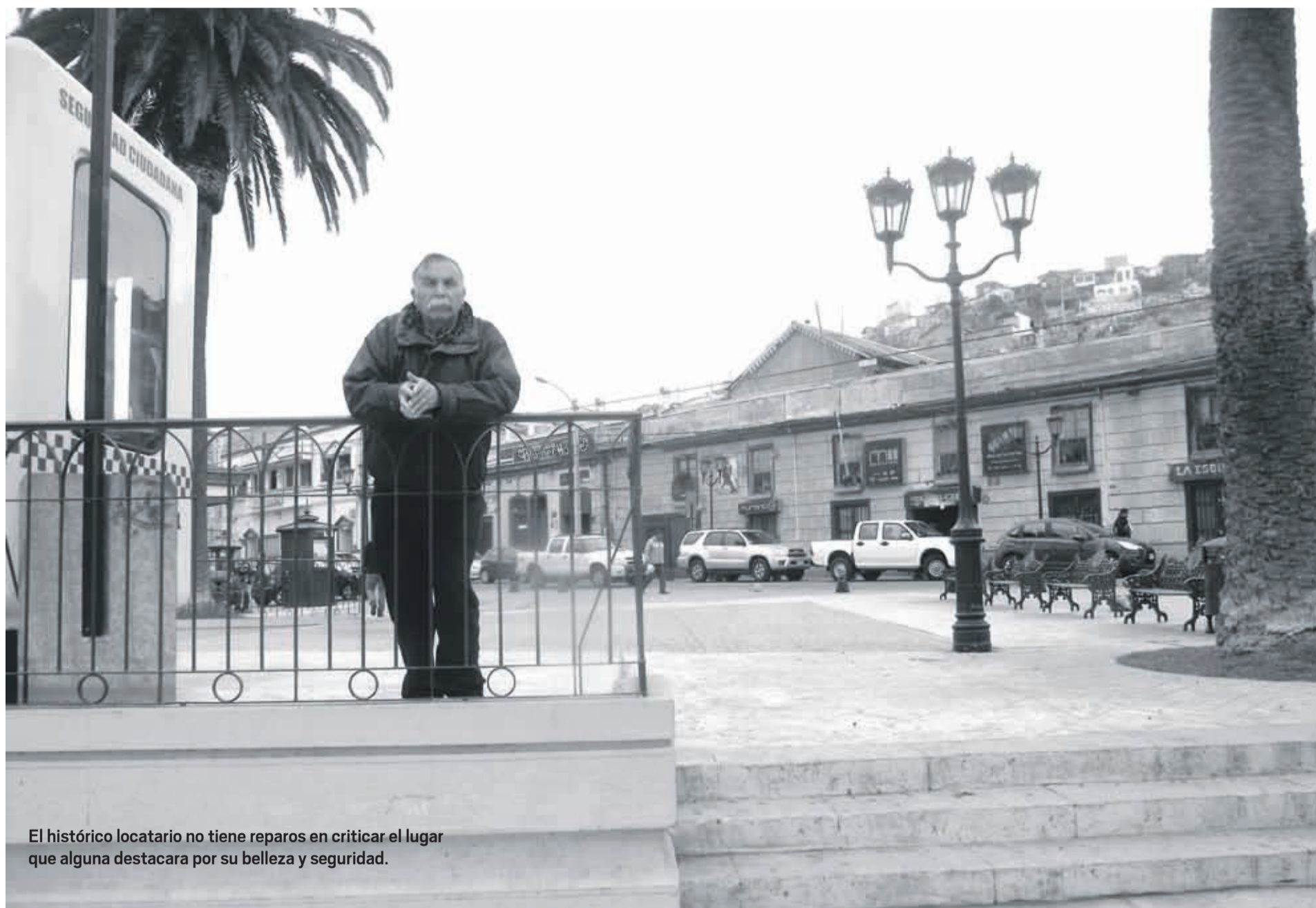
El histórico locatario no tiene reparos en criticar el lugar que alguna destacara por su belleza y seguridad.

→ “Siempre debió haberse respetado el reglamento del barrio inglés que impedía la instalación de discotecas generadoras de conflictos”. El encargado de uno de los locales posee la firme convicción de que hoy más que nunca necesitan conocer el Plan Maestro de Turismo para saber dónde están insertos como eje productivo de la actividad turística empresarial. Además, piden a las autoridades realizar un proceso de reordenamiento e ingeniería para revertir la situación actual que se genera en el área céntrica.