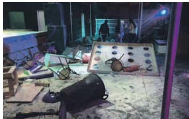
Durante el pasado mes de mayo se registraron serios incidentes al interior de una discoteca.

Luego, Rivera monologa. “Cuando en 2007 se produjo la crisis de autoridad en la municipalidad, la llegada del nuevo alcalde significó que al mes se apagaran las luces de los faroles, y la de los frontis de los edificios. Y lo más lamentable: se eliminó el servicio de seguridad ciudadana, que cubría el sector y las calles aledañas”, dice. Y agrega. “Pero el mayor error en que se incurrió, fue el de autorizar la instalación de discotecas en forma indiscriminada. Ese tipo de local era absolutamente incompatible con un Barrio Cultural, familiar, patrimonial y turístico. Se producen algunas riñas entre indeseables, que ocasionaron un gran desprestigio. Esto hizo que un programa sensacionalista del canal Megavisión, realizara un reportaje, sesgado, que intentó reflejar una realidad que no era efectiva, a través de pequeñas escenas montadas para el efecto. Esto fue el resultado del desacierto municipal, al permitir las discotecas”.