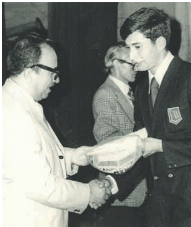
Aquí durante su graduación en el Liceo N° 10 Confederación Suiza, en Santiago.

Estudio en el Colegio Nacional en la Región Metropolitana, en donde también destacó por ser un estudiante inquieto. Admite que en lo académico era más bien "del montón". Sin embargo, por esos años ocupaba sus energías en el deporte. Practicó hockey, ciclismo y natación.