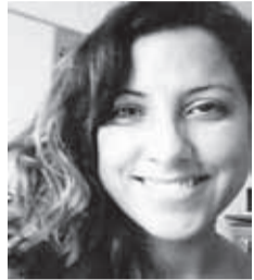
Por: Pilar Baeza Carvajal

➔ Cada padre, madre, apoderado u/o tutor puede marcar la diferencia en la conducta de sus hijos, afectividad y caricias.