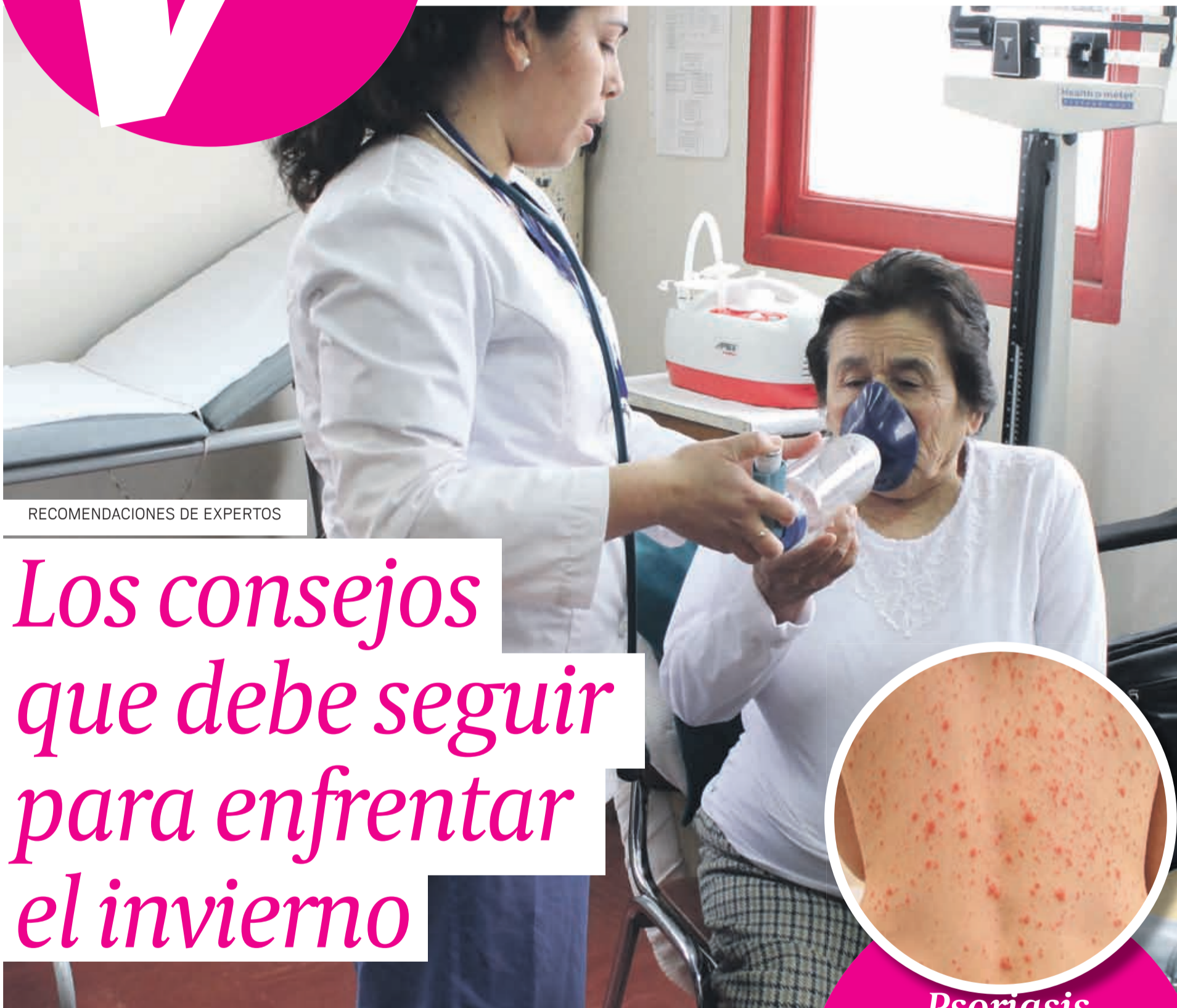
RECOMENDACIONES DE EXPERTOS