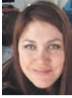
Por: Lorena Figueroa C. Vocera regional Autismo Chile