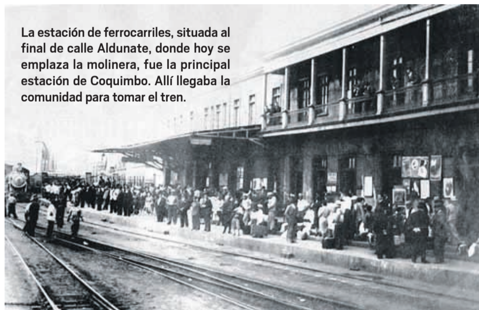
La estación de ferrocarriles, situada al final de calle Aldunate, donde hoy se emplaza la molinera, fue la principal estación de Coquimbo. Allí llegaba la comunidad para tomar el tren.

municipales para caminos e instalaciones, además de la liberación de impuestos para maquinarias y herramientas útiles en las faenas, dando cabida al proyecto.