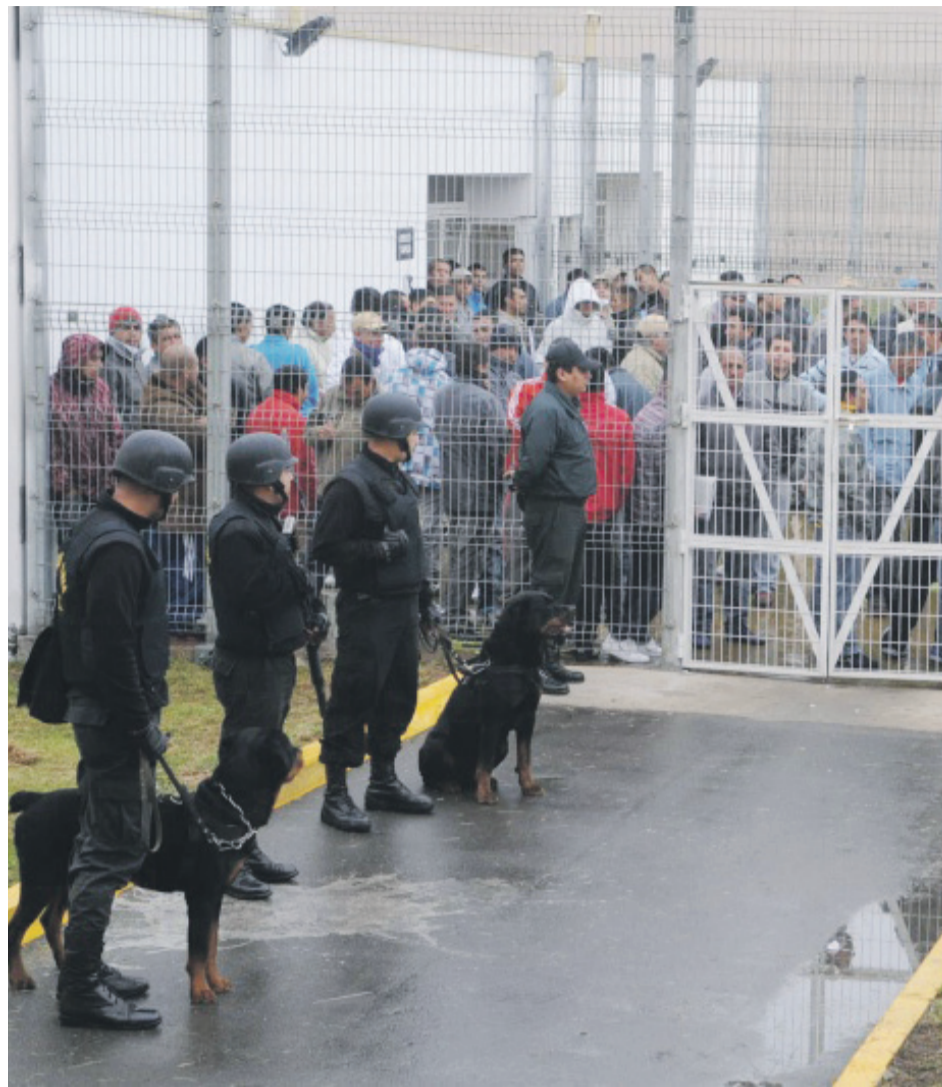
La gran población penal que tiene la cárcel y el traslado de reos desde otras ciudades ha sido blanco de crítica de algunos sectores.