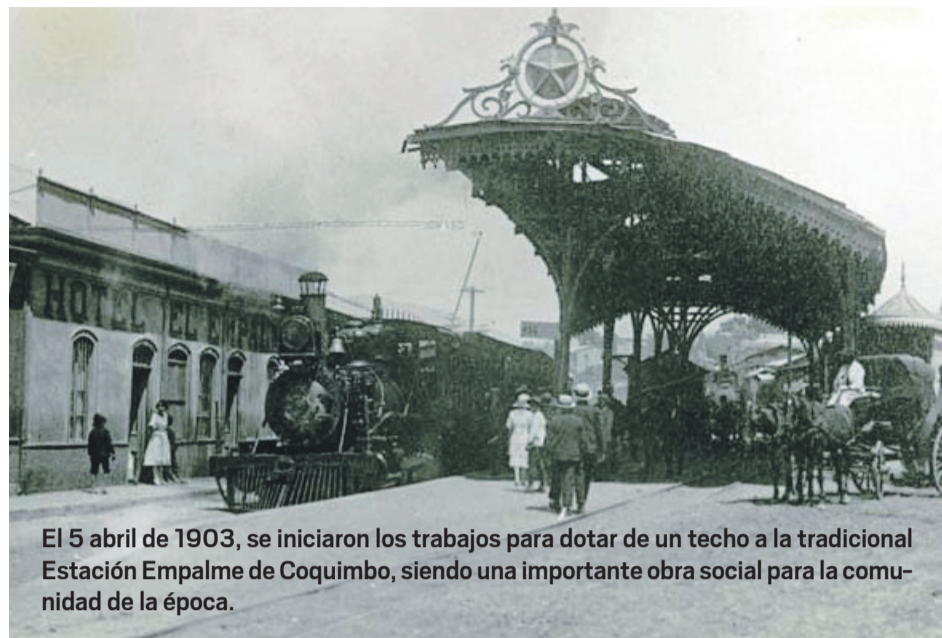
El 5 abril de 1903, se iniciaron los trabajos para dotar de un techo a la tradicional Estación Empalme de Coquimbo, siendo una importante obra social para la comunidad de la época.