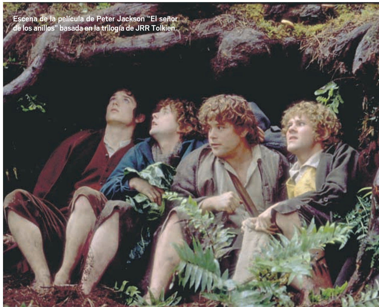
Escena de la película de Peter Jackson "El señor de los anillos" basada en la trilogía de JRR Tolkien.