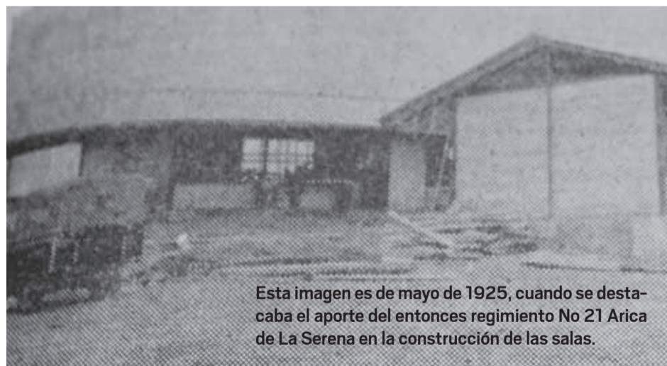
Esta imagen es de mayo de 1925, cuando se destacaba el aporte del entonces regimiento No 21 Arica de La Serena en la construcción de las salas.

ron las primeras seis salas de emergencia.