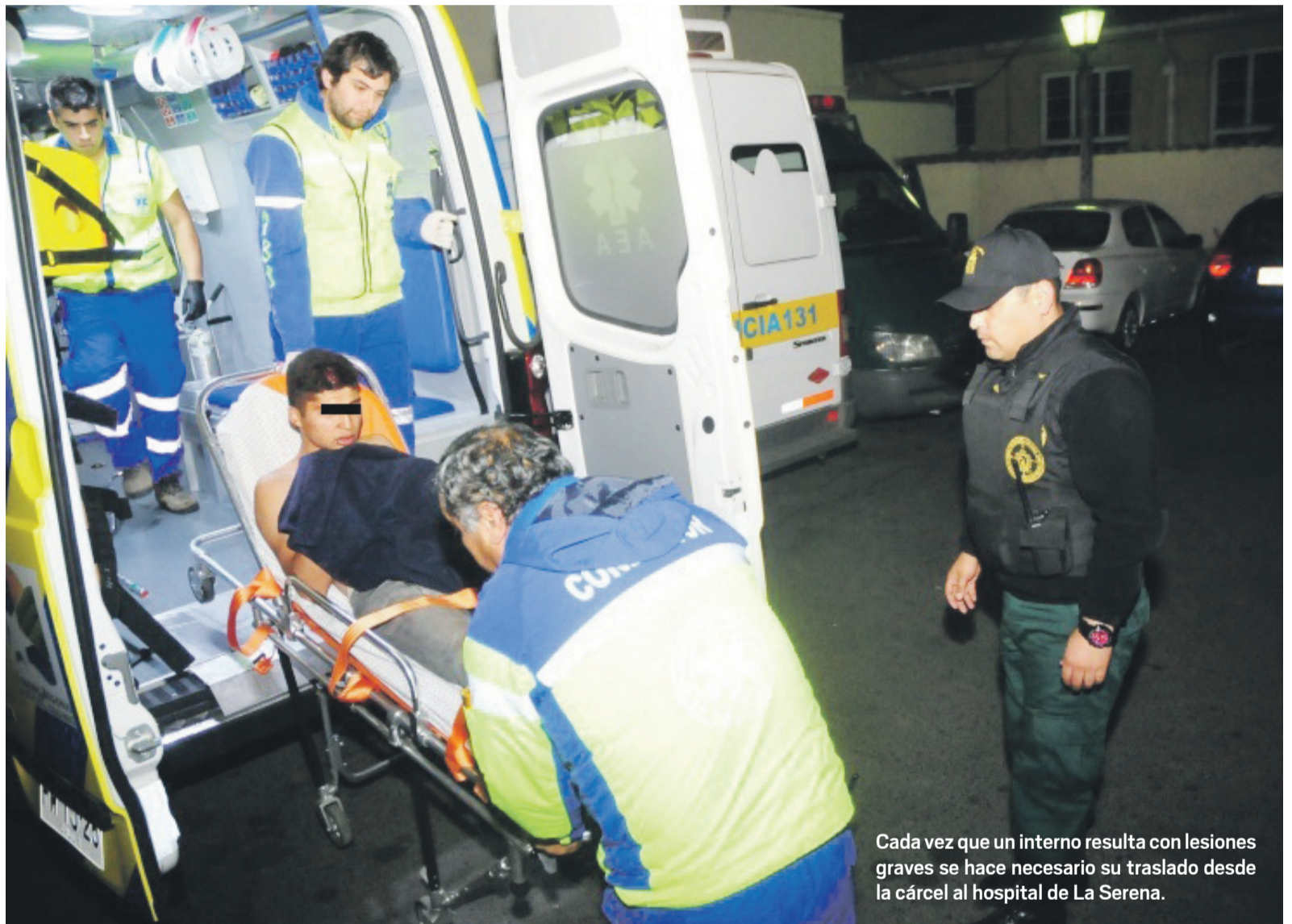
Cada vez que un interno resulta con lesiones graves se hace necesario su traslado desde la cárcel al hospital de La Serena.

Ahora hay otro coronel a cargo de la dirección regional de Gendarmería. Y la problemática se repite. Tanto así que, recién