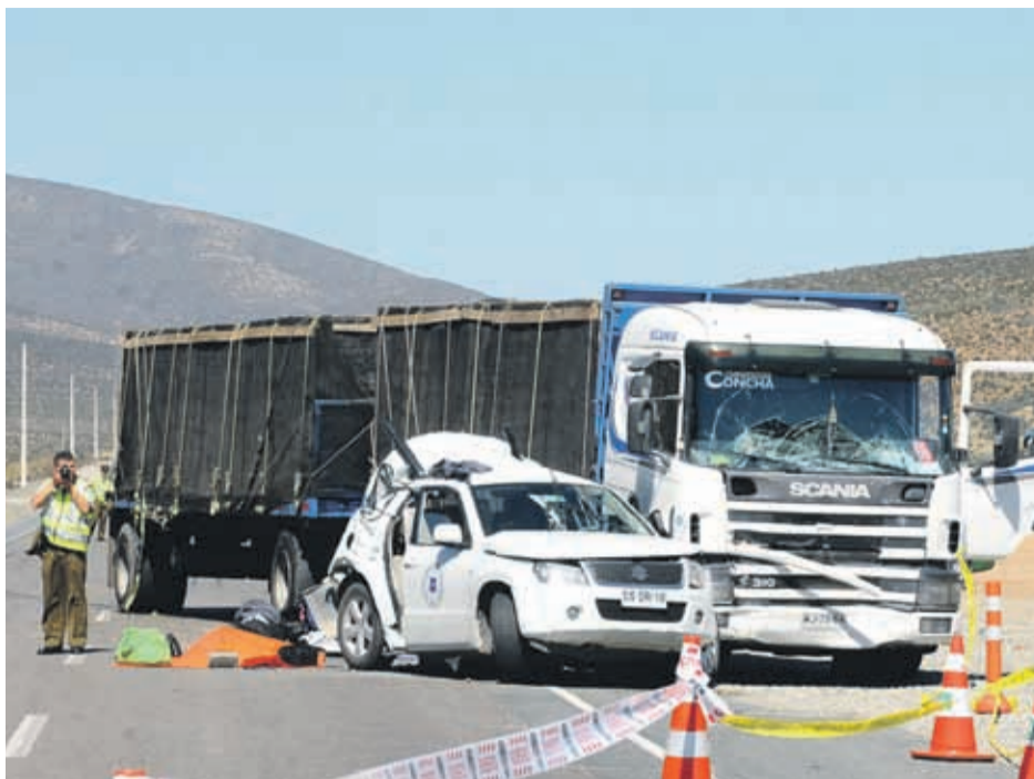
El trágico día en que las dos funcionarias del Serviu perdieron la vida luego del accidente en La Higuera.

Llega un minuto en el que no puede contener la emoción. Las lágrimas afloran cuando recuerda el lugar en donde se encontraban en esos tiempos, el mismo en el que el pasado fin de semana le tocó