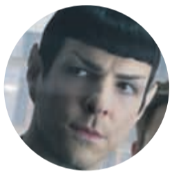
ZACHARY QUINTO EN EL PAPEL DE SPOCK, DURANTE UNA ESCENA DE LA NUEVA SECUELA DE LA POPULAR SAGA "STAR TREK".