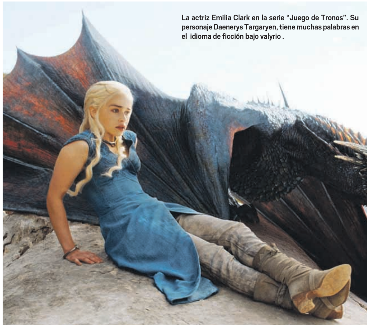
La actriz Emilia Clark en la serie "Juego de Tronos". Su personaje Daenerys Targaryen, tiene muchas palabras en el idioma de ficción bajo valyrio.

➔ Libros, películas y series de televisión dan vida a idiomas ficticios. Desde el dothraki al klingon, pasando por el élfico, estas lenguas inventadas tienen seguidores en el mundo real. ¿Se atreve con alguna de ellas?