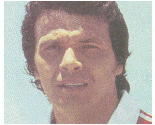
Don Elías Figueroa, tres veces el mejor de América.

a quienes vivimos en este sector. Esta historia, que el Uruguay campeón entrenó en Las Compañías, espero contarla algún día a un nieto (que aún no tengo), regalarle una camiseta de la Selección Chilena, peinarlo ordenadamente, tomarle una fotografía y regalársela como un recuerdo de su tata futbolero.