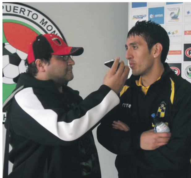
En los años que lleva en La Serena, ha combinado la labor en su restaurante con la del trabajo en prensa deportiva.

Pero no todo resultó como lo planeaba. Al poco tiempo de su retiro definitivo vino la muerte de su padre, algo que le costó demasiado su-