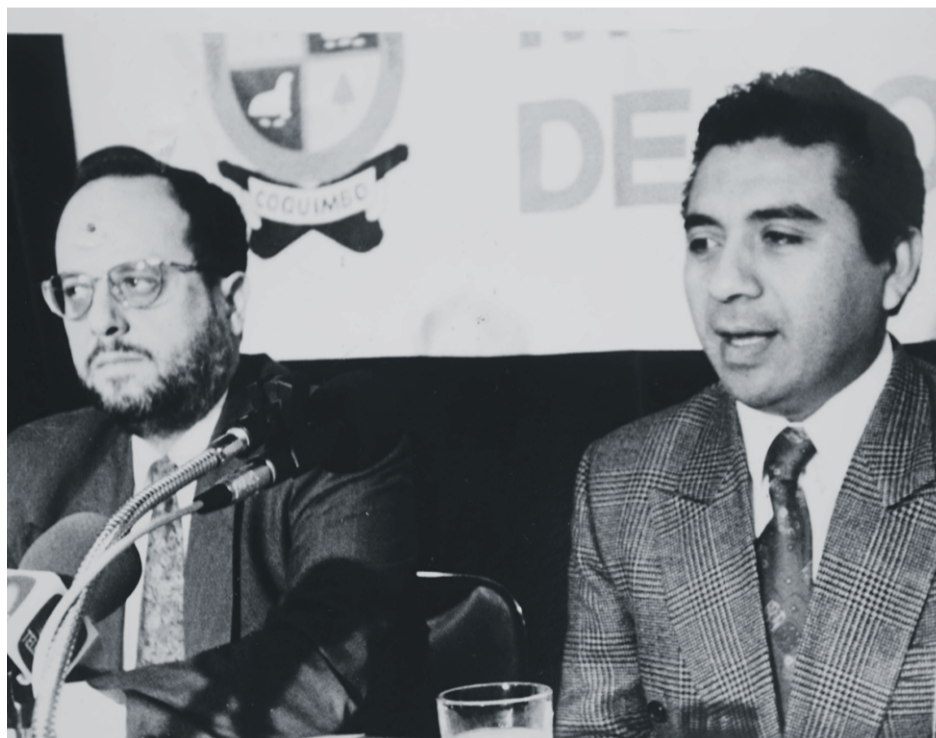
Cuando Pedro Velázquez fue electo alcalde de Coquimbo, Auger continuó su carrera política como integrante del Concejo Comunal.

Su otra salida de rigor es la que realiza todos los fines de semana, oportunidad que cumple el rito de almorzar con sus hermanos y sobrinos. Es el tercero de cinco (uno fallecido).