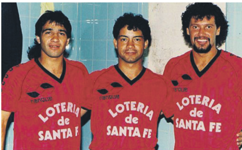
A la izquierda, el “Cacho” nunca perdía ocasión para jugar al fútbol.

Debió buscarse la vida. Empezó como chofer en una cuadrilla de trabajadores de la construcción. Allí, cuenta que aprendió mucho de la idiosincrasia local y comenzó a convertirse en un chileno más. Luego estuvo laborando de barman en un local de la Avenida de Mar hasta que finalmente logró independizarse y con la ayuda de un amigo se instaló con el Minuto 90, su querido local. A partir de ahí, la historia es conocida. “Aquí estamos todavía, después de muchos años hemos logrado sacar adelante esto con mucho esfuerzo, y ha servido para ayudar a la familia, a vivir. La verdad que esto es uno de mis mayores logros acá en Chile, pero lo más valioso que encontré acá fue a mi mujer, con ella seguimos dando la pelea y siempre tirando para adelante”, concluye, el xariete de Colón, el trasandino que ya es prácticamente un chileno más y que tiene el corazón serenense. 4602IR