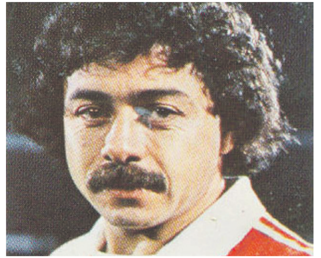
Carlos Caszely, el "Rey del metro cuadrado".