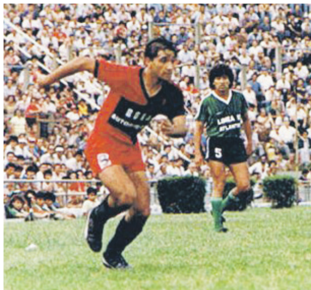
Como jugador destacaban sus cualidades físicas, siendo un veloz ariete.

Las cosas iban bien y en 1990 recibió una oferta que no pudo rechazar. The Strongest de Bolivia lo quería en sus filas, nada más y nada menos que como refuerzo para jugar la Copa Libertadores. Vera no lo dudó y aceptó. Sin embargo, la experiencia no fue del todo feliz. Se trasladó al país altiplá-