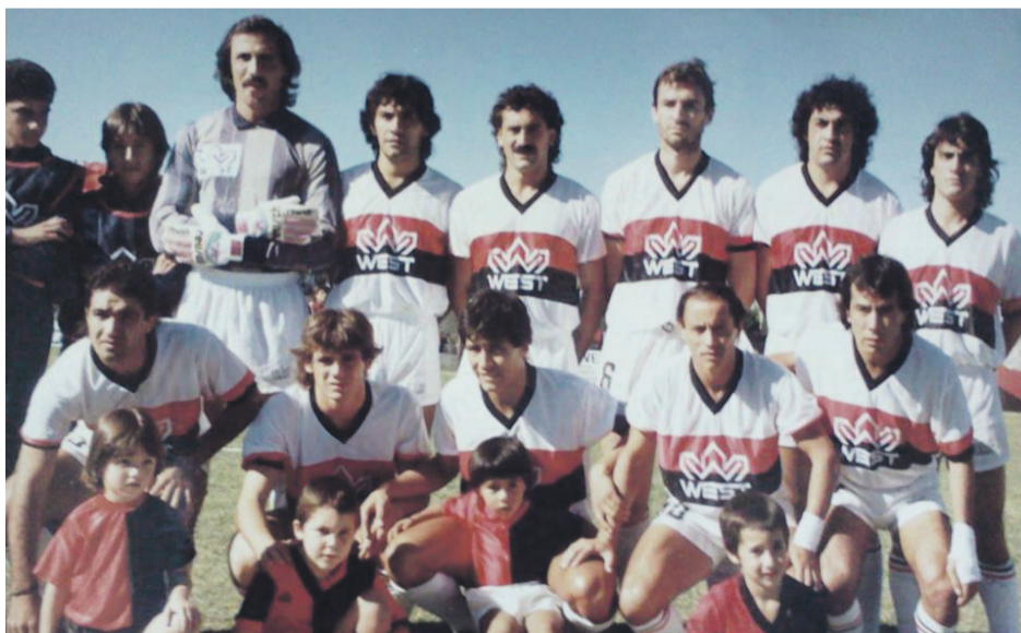
Abajo a la izquierda, defendiendo al club de sus amores.