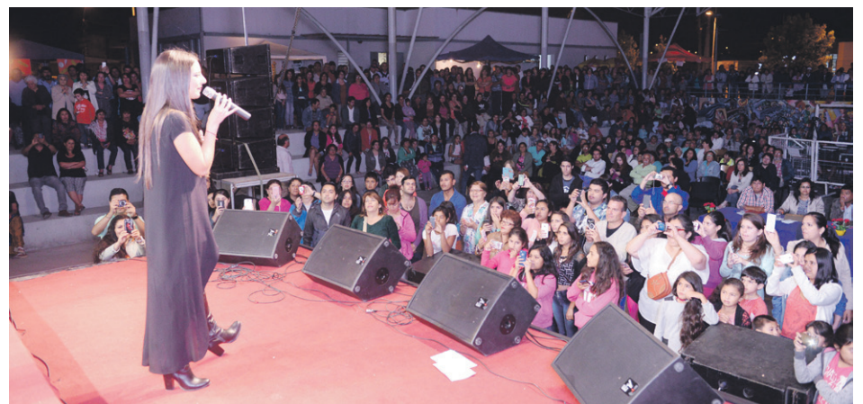
La cantante chilena Daniela Castillo lució su talento en el exitoso festival del sector Antena, en el parque 18 de Septiembre.