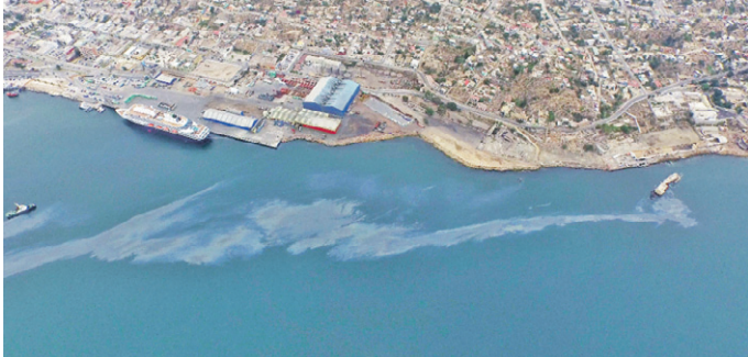
FOTO AÉREA DE LA MANCHA OLEOSA QUE SE REGISTRO EN TORNO AL BARCO DON HUMBERTO.

Los casos de contaminación por petróleo en Chile más graves: