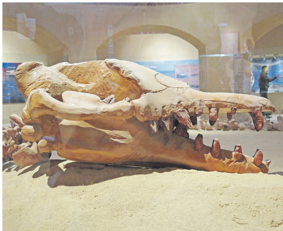
Museo de Fósiles y de Cambio Climático en Wadi al Hitan, el valle desértico egipcio en el que nadaron ballenas en la prehistoria, al suroeste de El Cairo.

Además de hospedar a la gran ballena, el Museo de Wadi al Hitan muestra el impacto del cambio climático sobre la Tierra y la evolución de