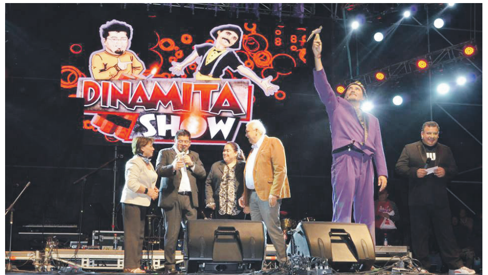
El dúo humorístico Dinamita Show se lució en el Festival Carnaval del Paloma, que se desarrolla en la comuna de Monte Patria.