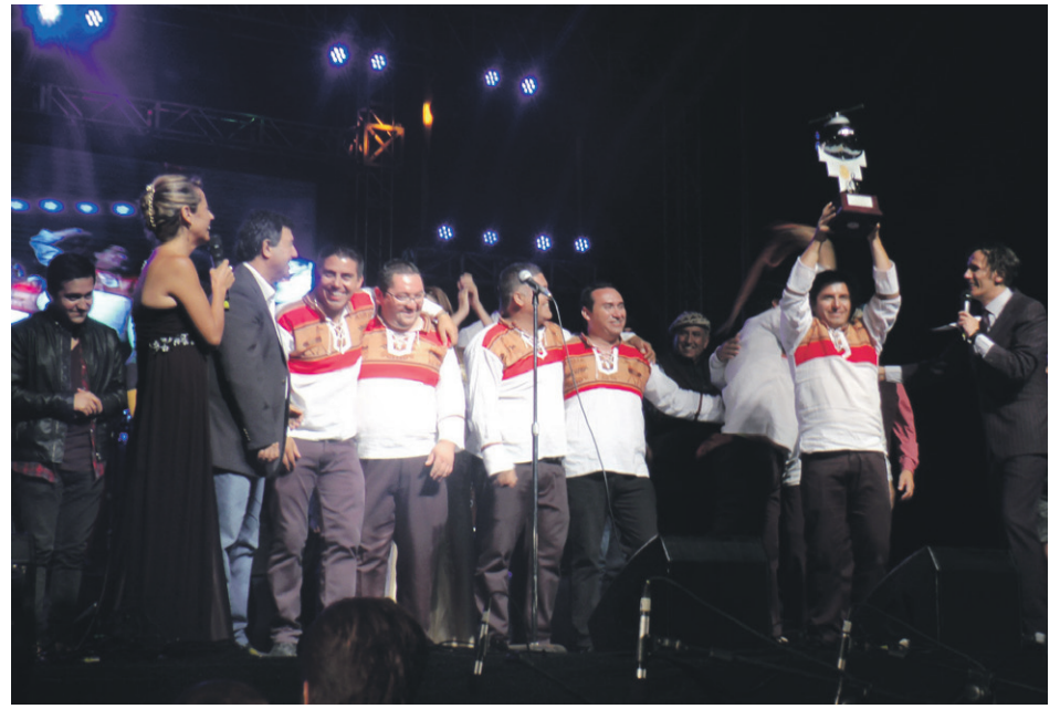
La agrupación Jacha Inti ganó en la competencia folclórica, en el Festival La Voz de la Montaña de Andacollo, que animó Sergio Lagos.

Hubo muchos otros festivales a lo largo de la región (incluyendo eventos de blues y jazz, con destacados exponentes nacionales y extranjeros). Lo importante es que casi todos tienen continuidad en el tiempo, convirtiéndose igual en una importante vitrina para los valores que siempre están surgiendo desde las tres provincias de la Región de Coquimbo. 0101R