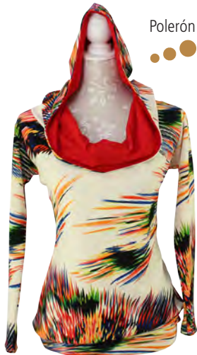
Polerón con capucha.