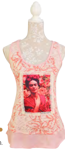
Polera Frida Kahlo.