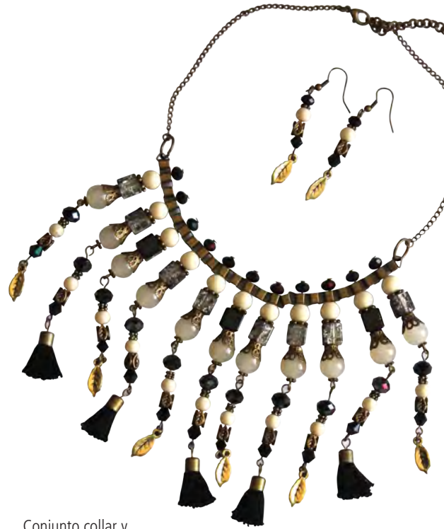
Conjunto collar y aros hechos a mano.