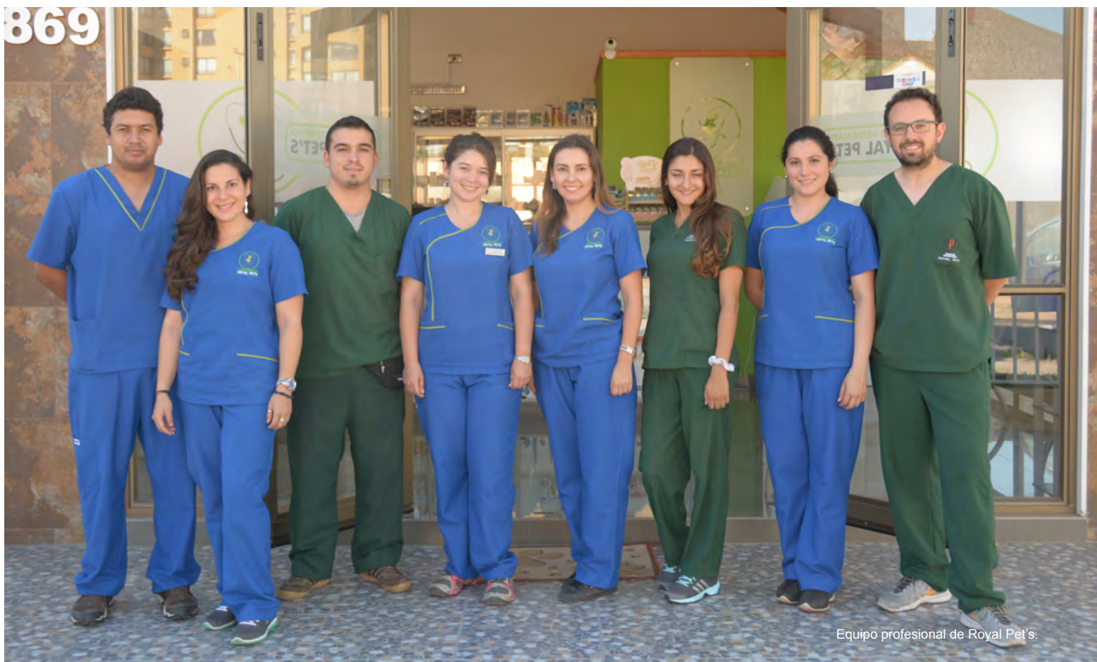
Equipo profesional de Royal Pet's.

Cirugía, radiografías y exámenes complementarios son sólo algunos de los servicios que ofrece esta moderna clínica veterinaria ubicada en el sector oriente de La Serena.