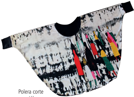
Polera corte murciélago estampada.

Así como los básicos no pueden faltar en el clóset femenino, las prendas de diseño de autor tampoco, ya que se trata de productos exclusivos que permiten aportar un estilo diferente a la tenida. ¿Quieres echar un vistazo? A continuación una selección de poleras y accesorios.