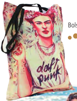
Bolso Frida Kahlo.