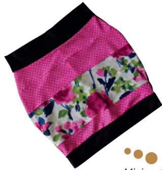
Mini en tonos rosa.