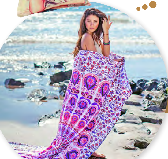
Manta de Mandalas.

Precios de ropa y accesorios consultar en tienda Subjetiva / Tel. 67087701 / Facebook: Subjetiva Puro Diseño. Precio de mandalas consultar en Instagram: Soulmatechile.cl y Facebook: Soul Mate Chile.