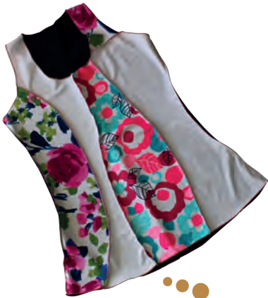
Polera Patchwork con costuras a la vista.