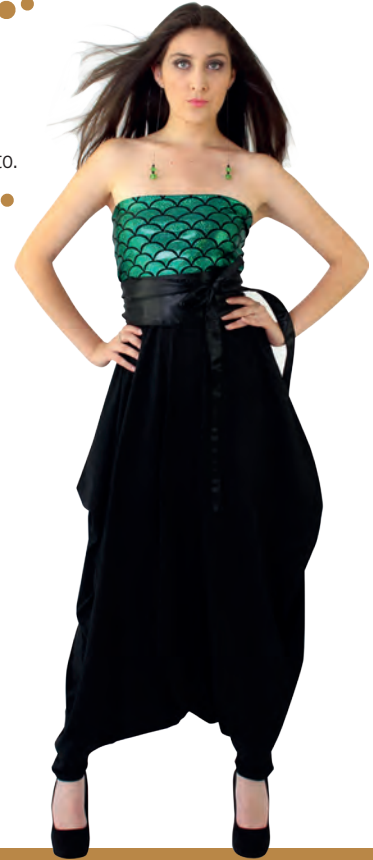
Enterito con cinto.