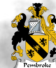
ESCUDO DE ARMAS DE LA CIUDAD DE PEMBROKE