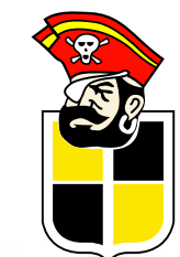
INSIGNIA DE COQUIMBO UNIDO 1962