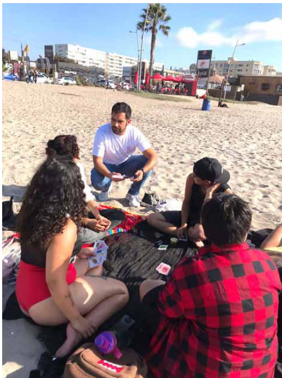
La tarde de ayer se realizó el hito que da inicio al trabajo de esta fundación, con la entrega de volantes informativos en la Avenida del Mar, concientizando sobre esta enfermedad.

Ya cuentan con el correo electrónico fundaciónmontserratarfina@gmail.