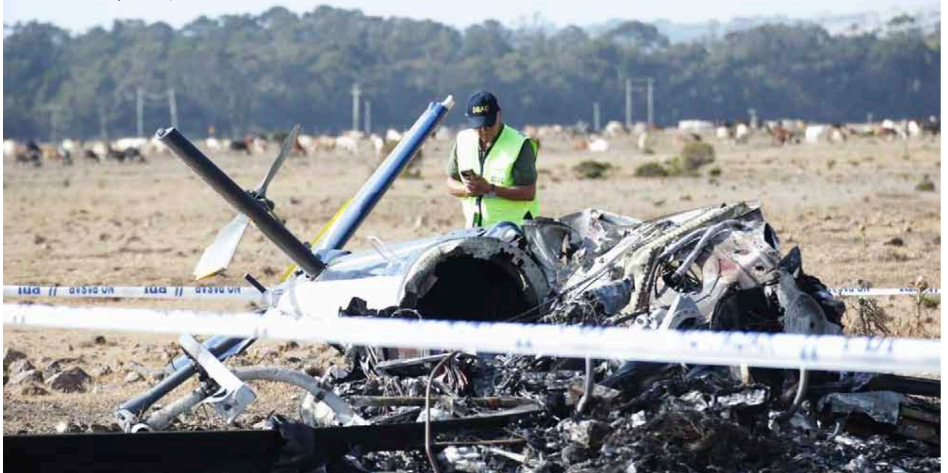
Reducida a cenizas quedó la mayor parte de la aeronave siniestrada.

“Ingresaron a este sector del aeródromo de Pichidanguí, con la finalidad de hacer una carga de combustible. En base a eso, el testigo señala que hicieron este movimiento —un giro, detalla más adelante— y al ascender, pierden el control y caen”, dijo el capitán Verne Andrade, subcomisario de Los Vilos.