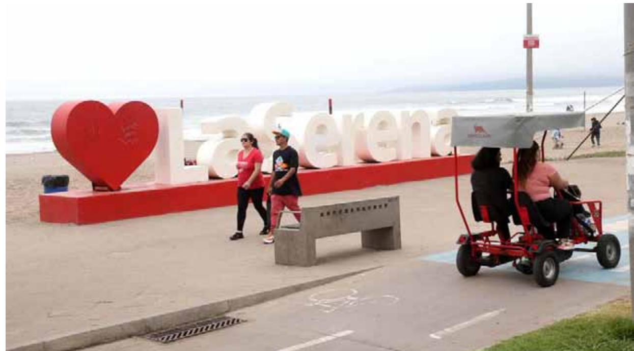
Un flujo turístico menor al esperado se ha registrado en la región durante el mes de enero.