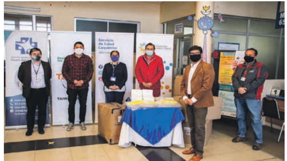
La donación desde Taiwán consiste en 5 mil escudos faciales, mil dispositivos para la toma de exámenes PCR, y 2 mil mascarillas de tela de cobre para adultos mayores.

“Nosotros hicimos el convenio con la Oficina Comercial y Cultural, y a través de ese convenio podemos recibir los dineros, hacer la compra del material y ponerla a disposición para que se pueda entregar a los destinatarios beneficiados. Por naturaleza son la primera línea, son quienes están enfrentando en primera instancia la dificultad que está teniendo la población chilena frente al Covid, y sabemos que los insumos son escasos, y por tanto a la primera línea había