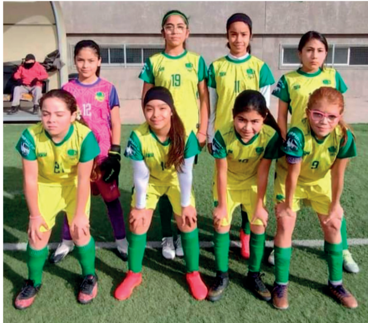
El fútbol femenino de Andacollo tiene futuro, porque a las jugadoras de la sub 13 les sobra talento.

En cuanto al torneo de fútbol femenino, el dirigente señaló que pronto comenzarán a trabajar con miras a las clasificatorias de septiembre en las series sub 13 y sub 35.