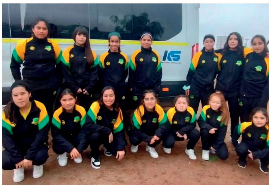
No solo hay que mostrar talento en la cancha, también buena pinta en los viajes.