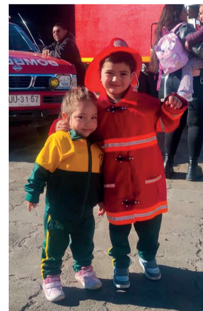
Niños y niñas sueñan con ser bomberos desde temprana edad.

Teck CDA dispone de canales directos para recepcionar opiniones, reclamos o sugerencias: