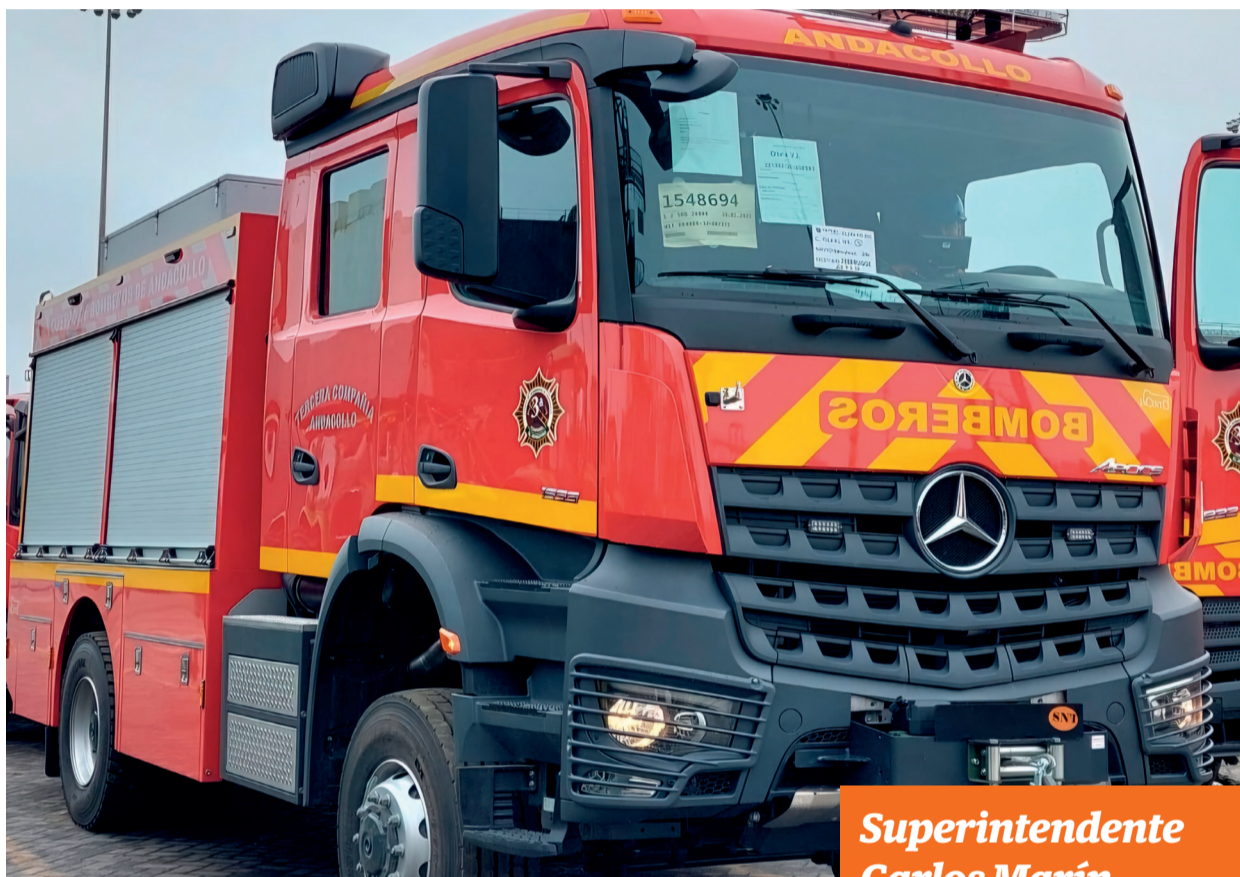
El flamante carro tendrá como base la 3ra Compañía El Manzano.

En todo caso, el Gobierno Regional aportó 60 millones y la Junta Nacional de Bomberos aporta la otra mitad y ahora sólo se espera la llegada. “El proceso ha sido largo y van ocho meses de tramitación. Ojalá pronto tengamos la camioneta aquí para beneficiar a la comunidad, pues tenemos un alto desempeño en las emergencias, tanto en lo tecnológico como en la capacidad humana”.