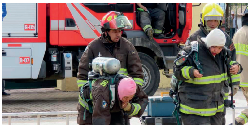
La capacitación de los voluntarios son cada día es más exigente y, por lo mismo, están mejor preparados.