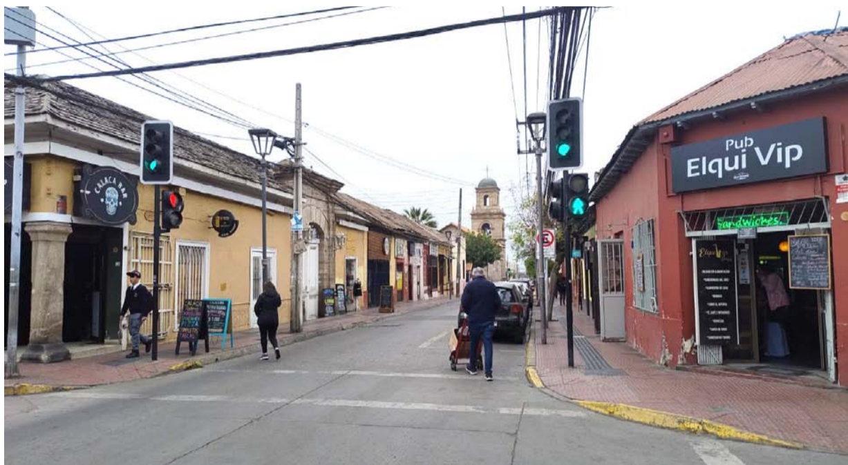
Una serie de negocios ubicados en calle O'Higgins han sido apuntados por ser focos de incivildades y delitos, tanto en su interior como en sus alrededores.

Este miércoles, los concejales revisaron recursos de reposición de cinco establecimientos, cuya autorización para vender bebidas alcohólicas había sido rechazada. No obstante, algunas autoridades criticaron que no fueran revisadas también, las autorizaciones otorgadas a una serie de negocios ubicados en calle O'Higgins.