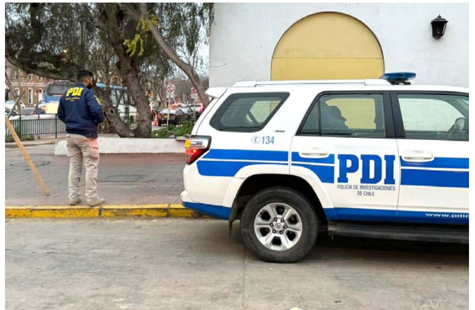
En pleno centro de La Serena ocurrió el homicidio de este lunes.