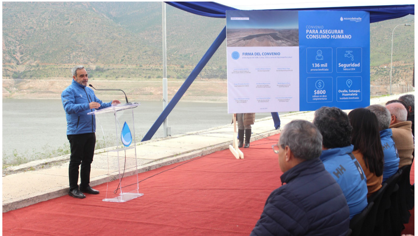
En el embalse La Paloma se desarrolló el acto en el que se firmó el convenio.

De esta forma, las gestiones llegaron a buen puerto, concretándose de esta manera, la firma de un convenio para priorizar el agua para consumo humano en Ovalle, acuerdo que fue cerrado este miércoles, de manera simbólica, en un acto desarrollado