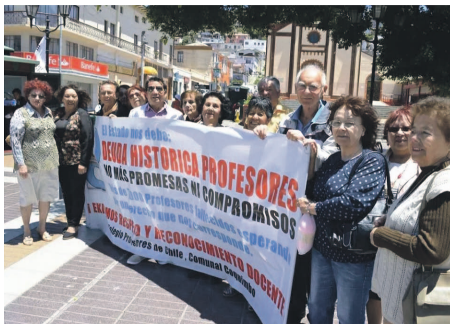
En contraste, todavía no hay una salida consensuada a la deuda que se ha mantenido con los docentes de La Serena, dependientes de la Corporación Gabriel González Videla,

Dirigentes gremiales destacan que la propuesta de pago crea "cierta desazón" ya que podría haber sido más elevada, tomando en cuenta la espera y las razones. En el panorama local, el paro docente podría llegar a su fin -tras un mes de haber sido convocado- si los profesores aceptan las condiciones de la CGGV.