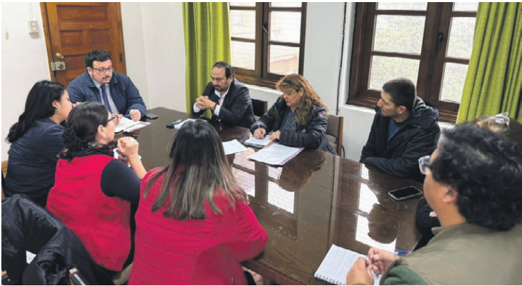
La comunidad educativa del Colegio Christ School señalan que el próximo martes se movilizarán. EL DÍA

La Secretaría Regional Ministerial de Educación de Coquimbo informó que el proceso del Sistema de Admisión Escolar (SAE) correspondiente al año 2026 aún se encuentra en desarrollo, mientras que el periodo de matriculas comenzará el 9 de diciembre. En este contexto, se hace un llamado a la comunidad educativa a mantenerse informada y participar activamente en las etapas del proceso.