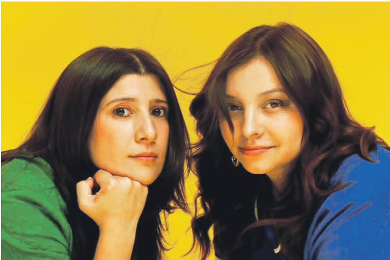
El grupo Supernova será el encargado de dar el cierre a la actividad que se desarrolla en la Plaza Gabriel González Videla.

puedan disfrutar de la música y vibra de esta recordada banda nacional”. A diferencia de las versiones anteriores, desde el municipio serenense se optó por no realizar esta celebración en los meses de verano, sino entre los meses de octubre y noviembre, para aprovechar el fin de semana largo y el flujo de turistas que visita la co-