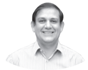
GREGORIO RODRÍGUEZ DIRECTOR DE CORFO COQUIMBO

Producir queso y leche de cabra ya es una tradición en la Región de Coquimbo. Una costumbre de larga data y que en el momento actual que vive Chile exige que para mantenerse vigente exista un mayor compromiso por otorgar nuevas y mejores oportunidades para la gente y sus territorios.