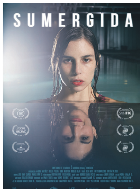
La película "Sumergida", será exhibida este martes 7 de enero a las 19:00 horas en el Centro de Extensión Municipal.

Y es así donde ya se cuenta con una nueva programación para el mes de enero y febrero, en donde el primer largometraje tendrá cita para el día martes 7 de enero a las 19:30 horas en el Centro de Extensión Municipal, con la cinta "Sumergida" (2019), dirigida por Andrés Finat, quien cuenta la historia de Ángela (23), una joven nadadora que padece de problemas del sueño. La protagonista tendrá que lidiar con la repentina desaparición de su madre y la llegada de Rebeca, una misteriosa chica que arrienda un cuarto en su hogar. Sin