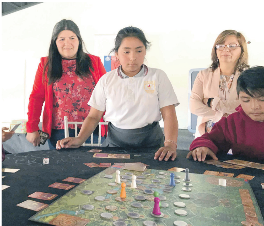
En la región de Coquimbo fueron 190 niños y niñas las que participaron de la iniciativa.