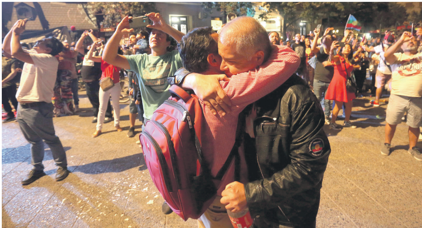
Un grupo de personas se reúnen para celebrar la noche de Año Nuevo en plaza