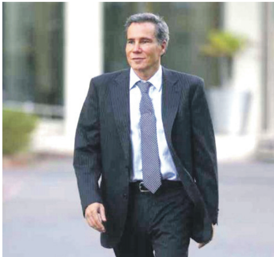
El fiscal argentino Alberto Nisman, en foto de archivo

La que según la página oficial de Netflix fue una "sospechosa muerte" sigue sin esclarecerse casi cinco años después y, aunque las primeras pesquisas concluyeron que fue un suicidio, un nuevo peritaje realizado por la Gendarmería Nacional Argentina a finales de 2017 determinó que el fiscal había sido asesinado por dos hombres tras haber sido drogado