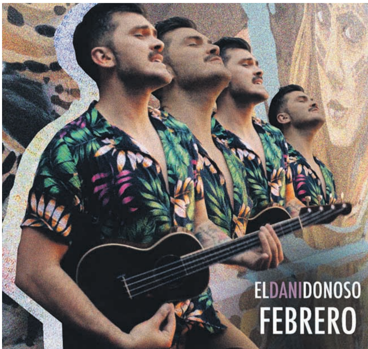
Este 2019 relanza su carrera como solista con un nuevo single y video llamado #Febrero, una canción inspirada en su paso por tierras aztecas, que refleja su madurez musical.

años permaneció como una de las principales voces de la orquesta del Festival Internacional de la Canción de Viña del Mar.