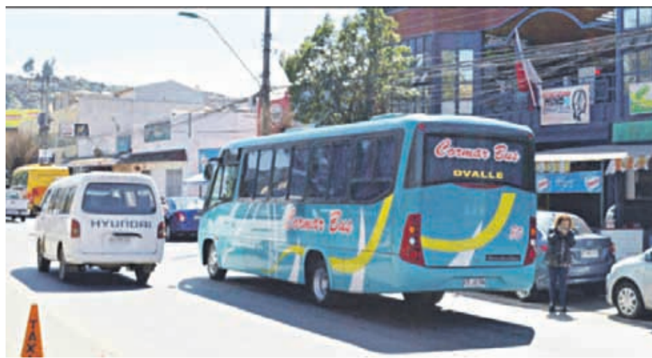
Los usuarios de Cormar Bus se mostraron indignados por los nuevos precios de las tarifas de viaje que estableció la empresa que recorre el tramo Ovalle-La Serena/Coquimbo

“Si bien el petróleo ha bajado en las últimas semanas, el tema mayormente va por el alza de los insumos. Nuestros costos operacionales también se han encarecido” reiteró, señalando al respecto que, “la gente lamentablemente no conoce cómo funciona esta industria. Nuestros costos operacionales