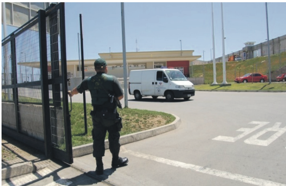
Según indicaron los dirigentes de los funcionarios de Gendarmería, el penal de Huachalalume alberga un importante número de reclusos de alta peligrosidad.