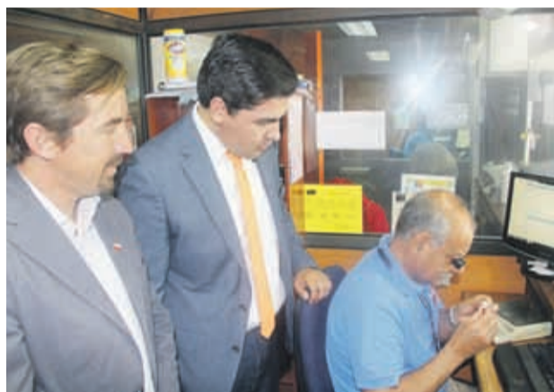
La institución tiene a la fecha $16 millones para repartir.

poder notarial. Ante el fallecimiento del empeñante, sus herederos pueden requerir el pago de este dinero, presentando la respectiva Posesión Efectiva.