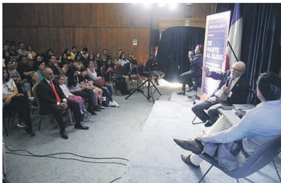
Unas 400 personas asistieron a la primera charla dictada por el profesor de la Universidad de Chile

“Este eclipse viene a engalanar a esta zona que ya tiene tanto contacto con la astronomía, donde las cúpulas del Tololo son casi un ícono regional, así que será un fenómeno muy interesante y único. Se dice que en 212 años es que podría verse otro eclipse total acá en esta zona, así que los del valle tienen un eclipse a domicilio”, dijo.