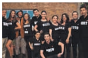
MEGA 22.00 Morande con Cia.