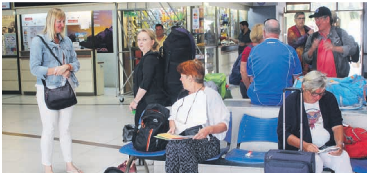
Se espera que cerca de 250 mil turistas lleguen en bus a la región durante el mes de febrero.