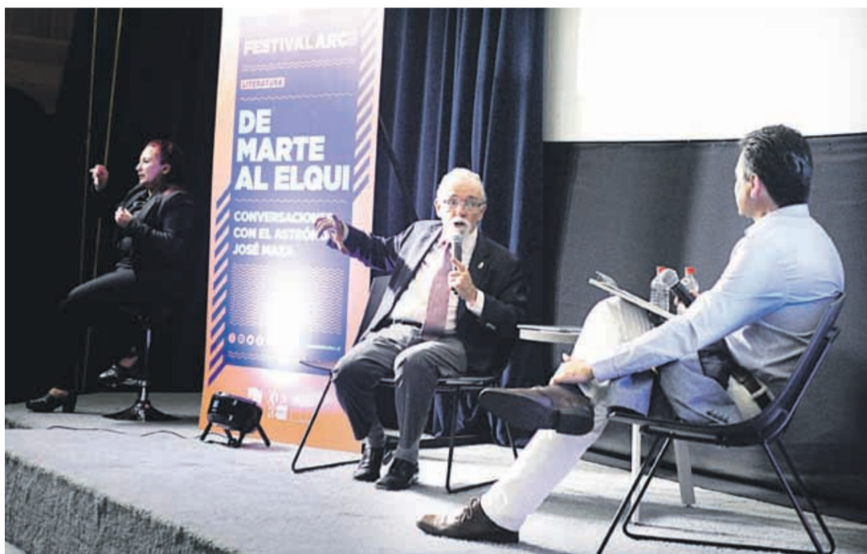
Maza recordó que el eclipse es un fenómeno totalmente natural y que ocurre esporádicamente

También hizo un repaso por los principales telesco-