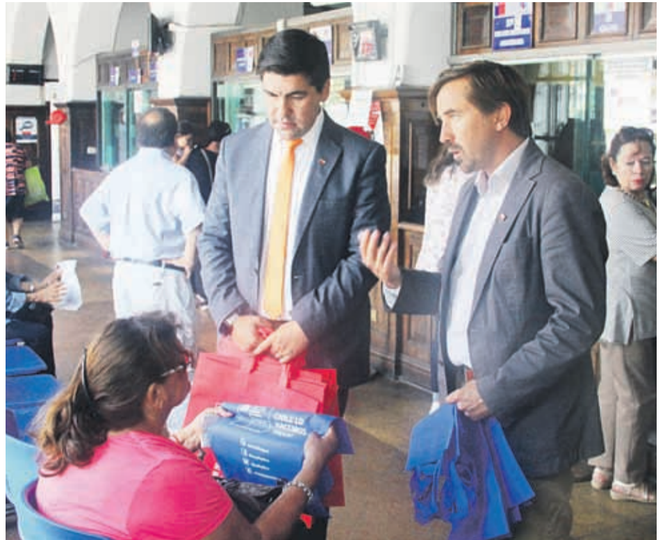
Las autoridades del Región de Coquimbo realizaron un llamado a los usuarios de la “Tía Rica” a retirar sus excedentes vigentes.

pueden llamar sin costo al teléfono 800 340 022 o desde celulares al 02 2690 6900. También lo pueden hacer vía whatsapp al +56 961218944.