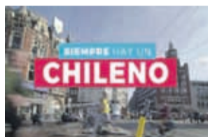
C13 22:30 Siempre hay un chileno

21.00 Meganoticias Central 22.00 Morande con Cia. 00.00 Pan Comido (RR)