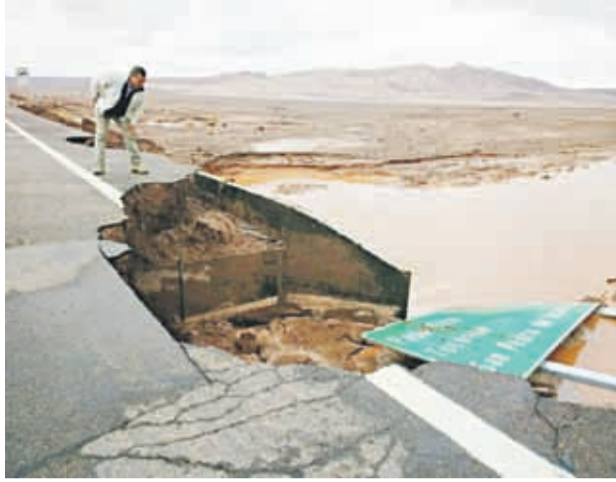
La fuerza de la crecida del río ha provocado anegamientos y cortes de rutas en varios sectores.