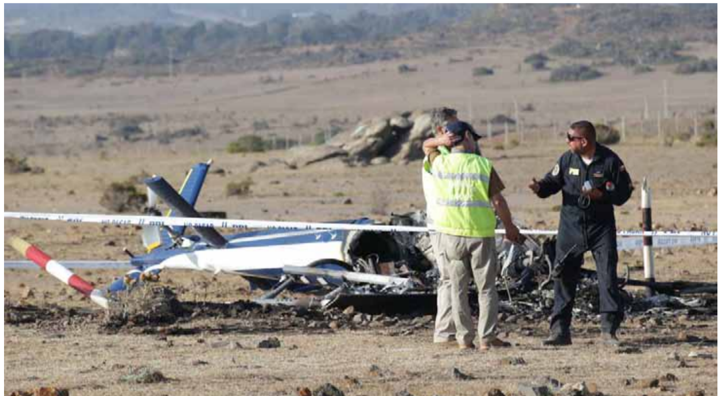
Las pesquisas para develar las causas del accidente se encuentran en plena ejecución.

A bordo, los detectives ya habían tenido importantes resultados, enmar-