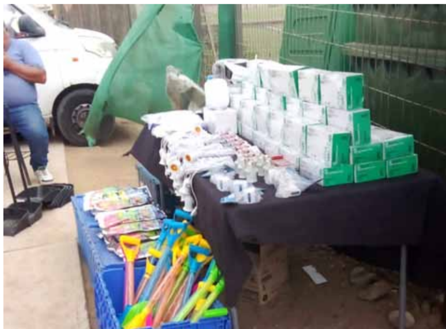
Una serie de vendedores ilegales se han instalado en las afueras del recinto en donde trabajan comerciantes establecidos.

Ante recientes hechos de violencia, acusan falta de seguridad y piden que autoridades cumplan con el compromiso de intensificar las labores de fiscalización.