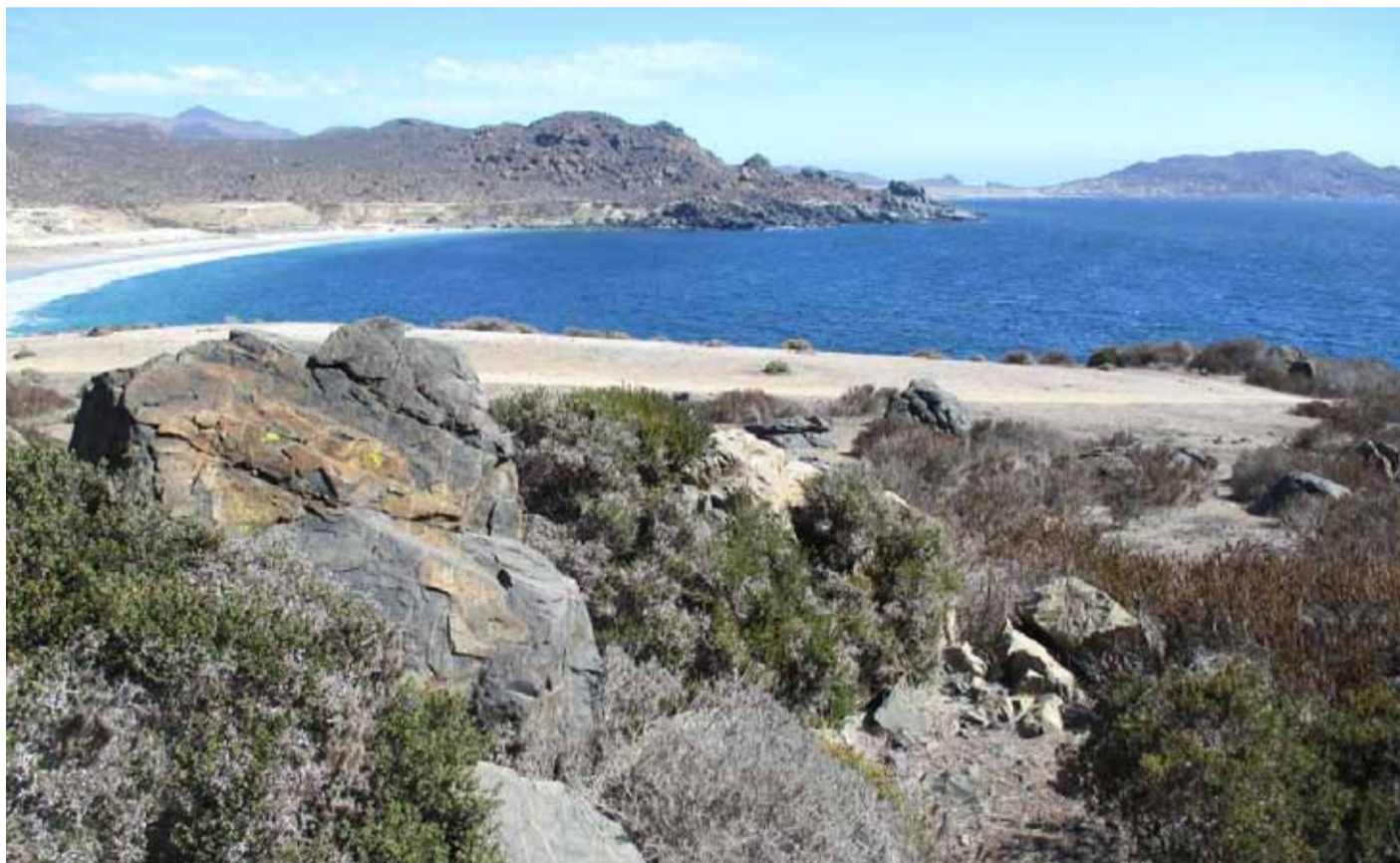
Gran cantidad de flora y fauna endémica fue identificada en el sector catalogado como santuario de la naturaleza.

Estos sitios definidos por el Ministerio del Medio Ambiente (Decreto Supremo N° 40 del 2013) son "porciones de territorio, delimitadas geográficamente y establecidas mediante un acto administrativo de autoridad competente, colocadas bajo protección oficial con