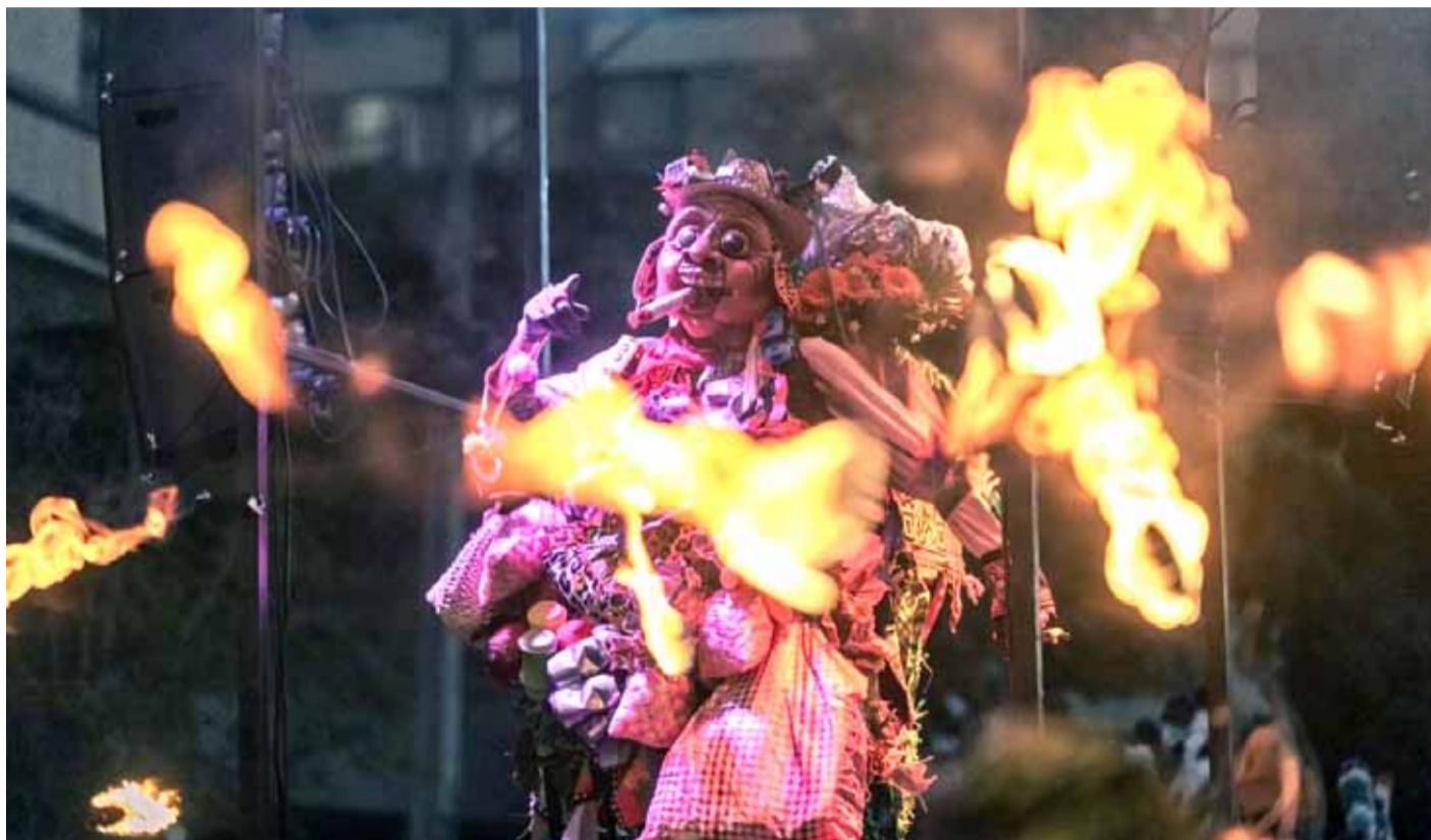
Este domingo, el público coquimbano podrá ser testigo de uno de los mayores espectáculos que Teatro a Mil trae a la región.

En el marco del festival Teatro a Mil, el montaje callejero del colectivo La Patogallina estará en avenida Varela, en pleno centro, entregando su mensaje sobre el universo simbólico y cultural del mundo andino.