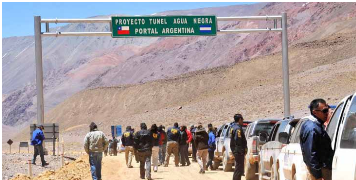
El Túnel de Agua Negra es considerada la obra más importante de las últimas décadas en América Latina.