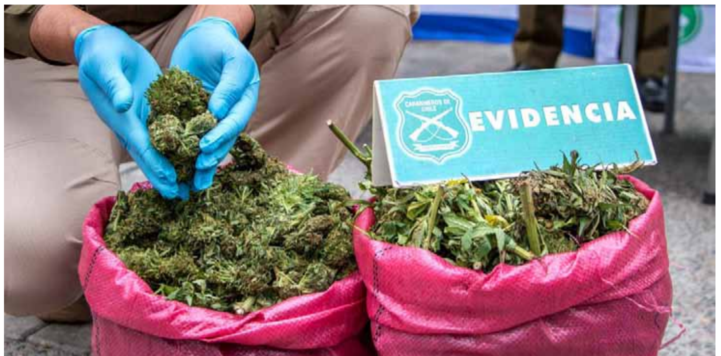
Carabineros del OS7 Coquimbo procedió a la incautación de más de 4200 plantas de marihuana y más de 72 kilos de droga elaborada

“Esto demuestra que la Fiscalía y Carabineros estamos dando batalla al tráfico de drogas y el crimen organizado que está detrás, porque nuevamente nos encontramos con plantaciones con cierto nivel de sofisticación; se encontró armamento y algunos artefactos explosivos ar-