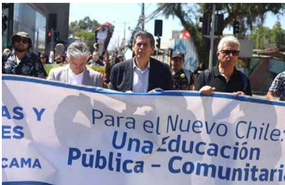
Los dirigentes del Colegio de Profesores acusan que estaban esperando compromisos concretos.

Los dirigentes del gremio docente decidieron iniciar una huelga de hambre, en protesta por la situación de los colegios en esa zona.