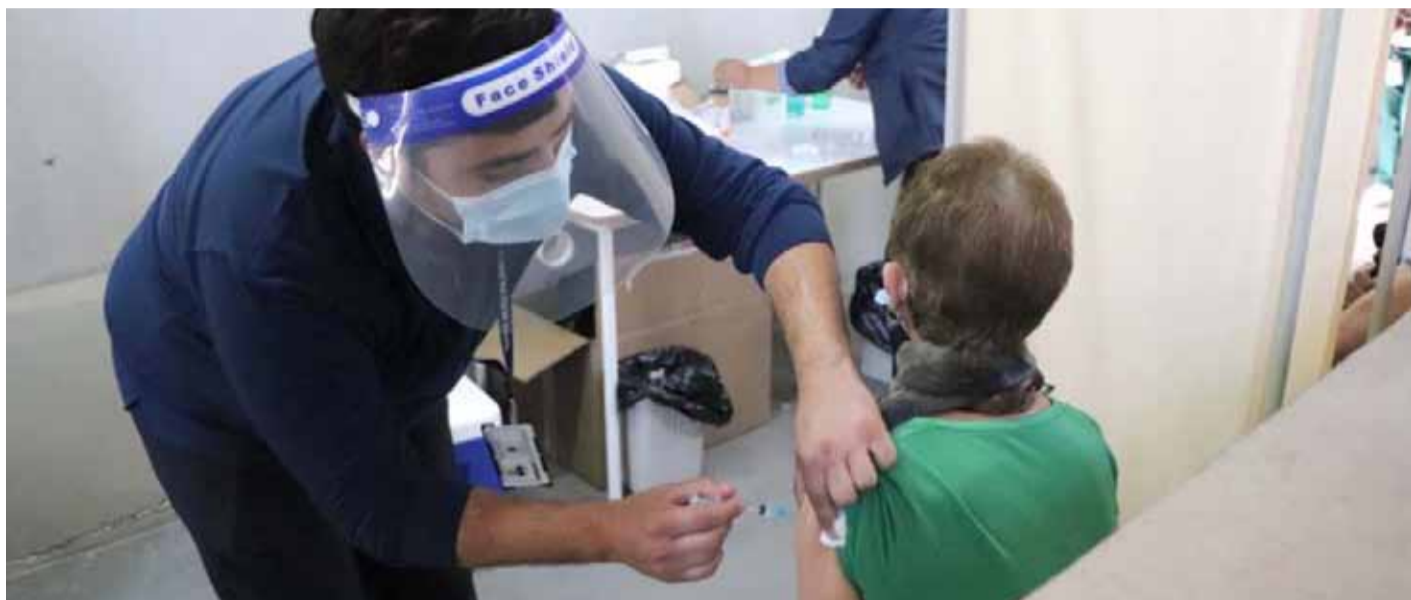
La recomendación de la Seremi de Salud es que la población pueda vacunarse, especialmente los grupos de riesgo.