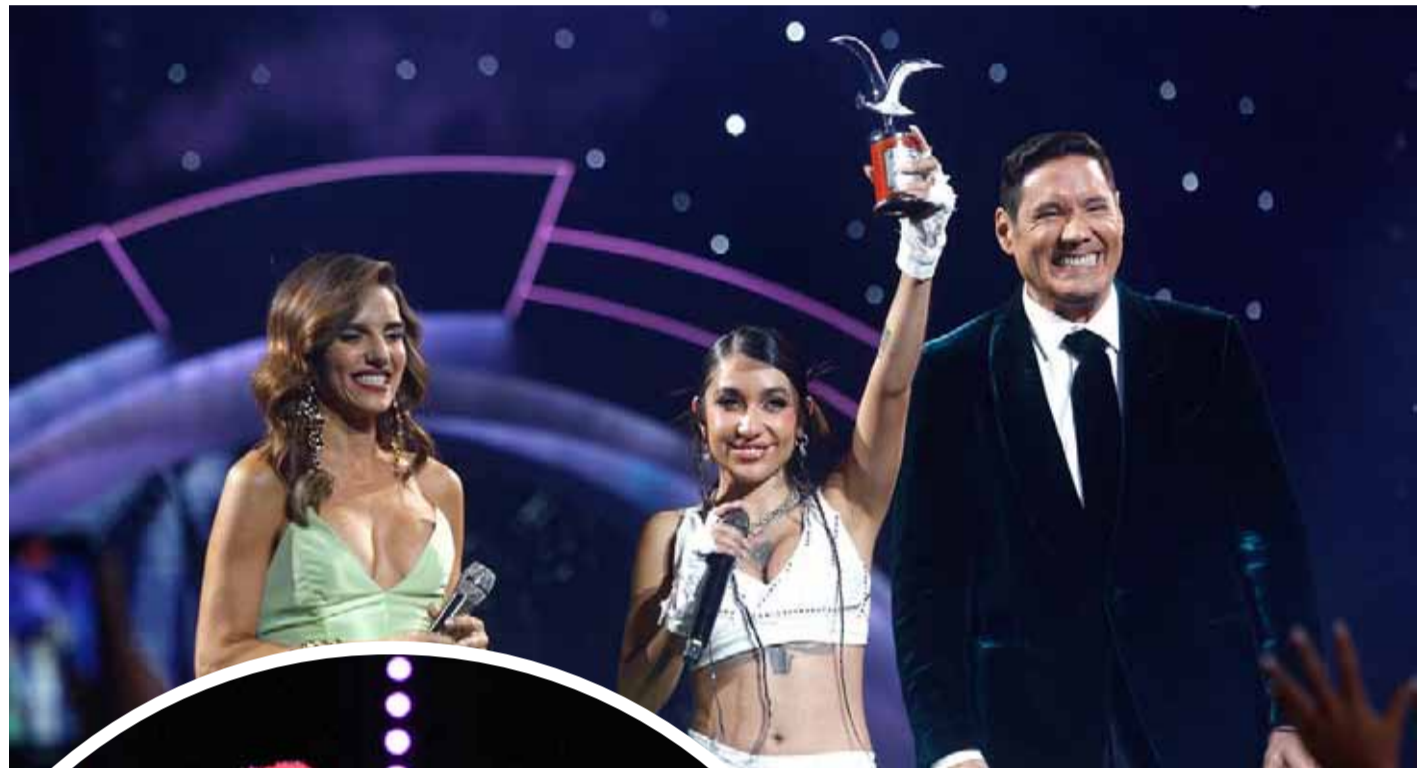
FESTIVAL DE VIÑA 2024 La artista trasandina María Becerra abrió la última noche del Festival de Viña del Mar, recibiendo las gaviotas de plata y oro.