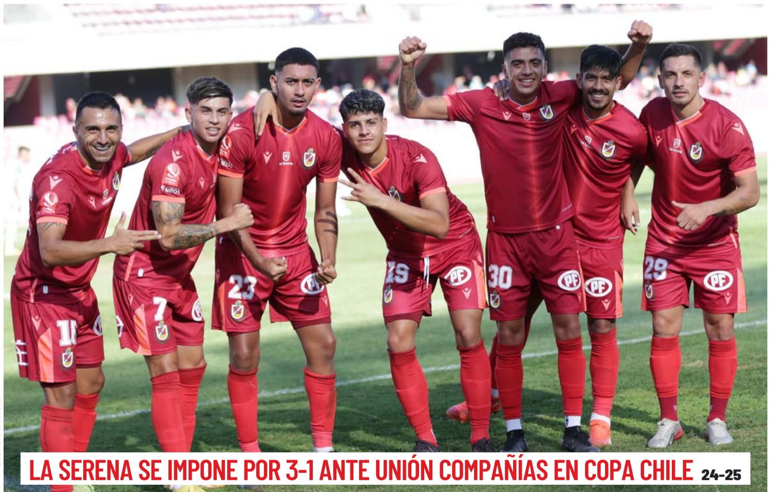
LA SERENA SE IMPONE POR 3-1 ANTE UNIÓN COMPAÑÍAS EN COPA CHILE 24-25