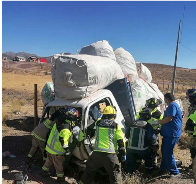
Voluntarios del Cuerpo de Bomberos de Combarbalá trabajando en el sitio del suceso del volcamiento de un camión ¾.

“De acuerdo a los datos recabados el vehículo station wagon venía circulando por Avenida Circunvalación