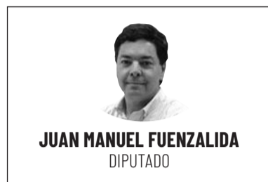
JUAN MANUEL FUENZALIDA DIPUTADO

Iniciamos el mes de abril, comenzando con la conmemoración de un nuevo aniversario de una de las instituciones más vitales para el país, Carabineros de Chile, que ha estado en la palestra durante estas semanas por lamentables hechos donde la delincuencia —descontrolada— arrebató la vida de dos funcionarios y por el cuestionamiento a la falta de herramientas efectivas para el control del orden público y la prevención de los delitos.