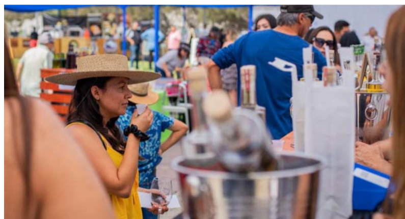
Visitantes disfrutando en la Fiesta de la Vendimia de Punitaqui 2023.

La festividad durará todo el fin de semana y tendrá stands artesanales, puestos de bebestibles de la zona y comida típica, además de dos escenarios para espectáculos musicales, entre otras cosas.