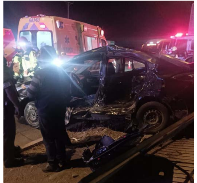
Accidente ocurrido en Avenida Costanera con Avenida La Chimba.

CUERPOS DE BOMBEROS DE OVALLE Y COMBARBALÁ