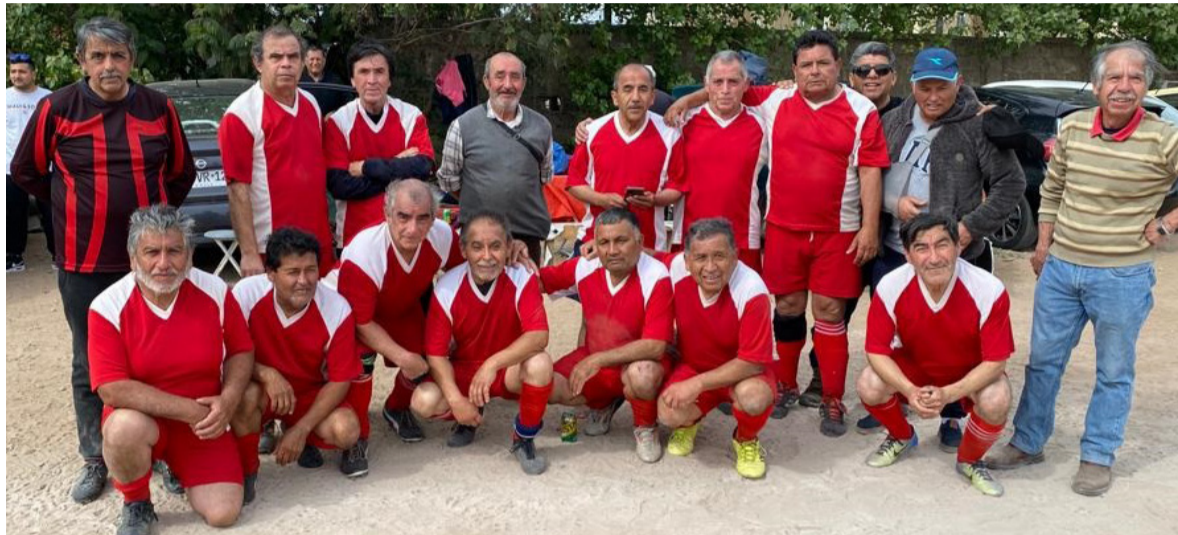
Los flamantes vice campeones de la Segunda División de la categoría 60 años en la Liga Comercial.