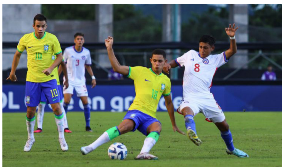
Flojo fue el debut del equipo nacional en Guayaquil, Brasil lo superó sin grandes complicaciones.

ambos pórticos, aunque al equipo que dirige Hernán Caputto le faltó mayor consistencia en la última línea. Los goles, apenas separados por seis minutos, resultaron determinantes para que el cuadro brasileño no se exigiera mayormente y administrara los tiempos del encuentro, en especial en la segunda fracción, cuando Chile salió en busca de revertir su suerte, aunque sin ninguna claridad