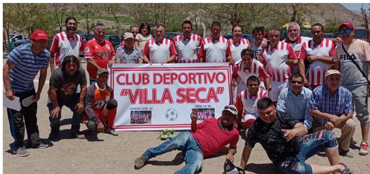
En el CD Villaseca se están preparando para enfrentar la temporada 2023 en la Asofútbol de Vicuña como también en la Liga Laboral.