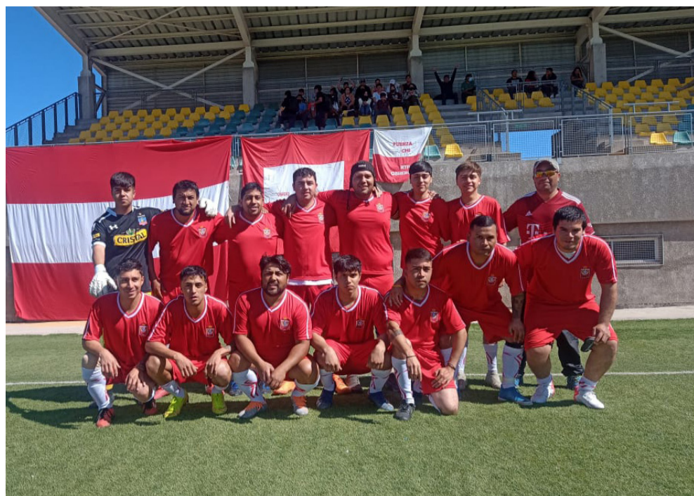
La institución dejó en el pasado eso de Macanudos, pero no se dejan pasar a llevar por nadie.