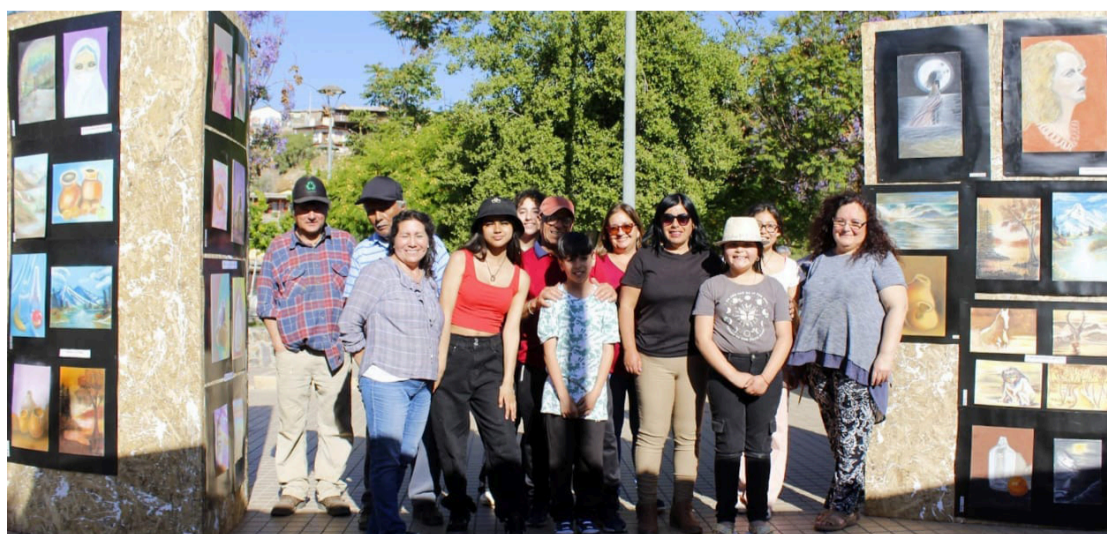
Los talentos para el dibujo podrán soñar con una exposición