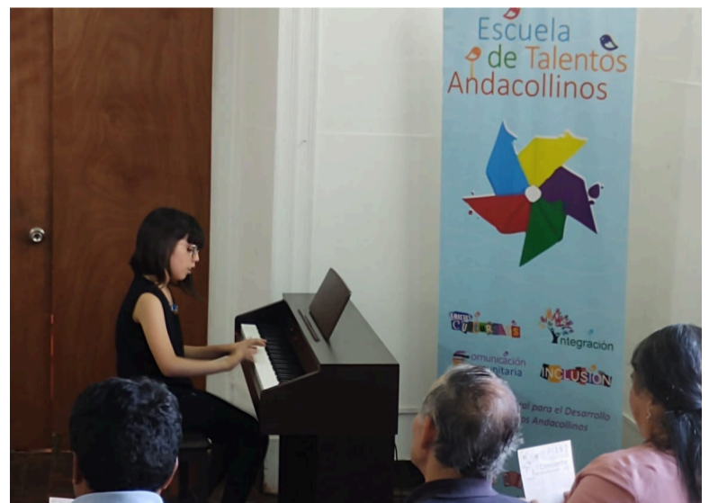
Los amantes de la buena música ya están inscritos en el taller de piano.