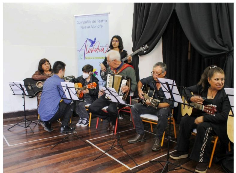
Los adultos mayores tendrán su taller de folclore.