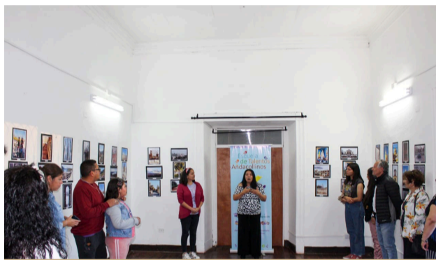
La fotografía también tiene su taller.