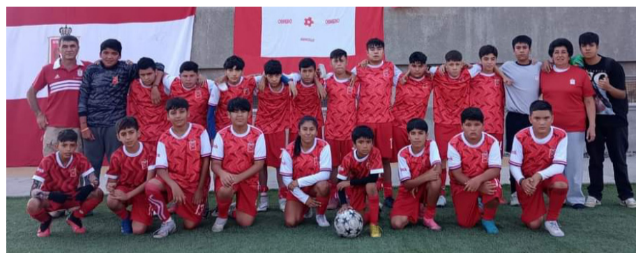
La serie infantil está dando alegrías a la barra.