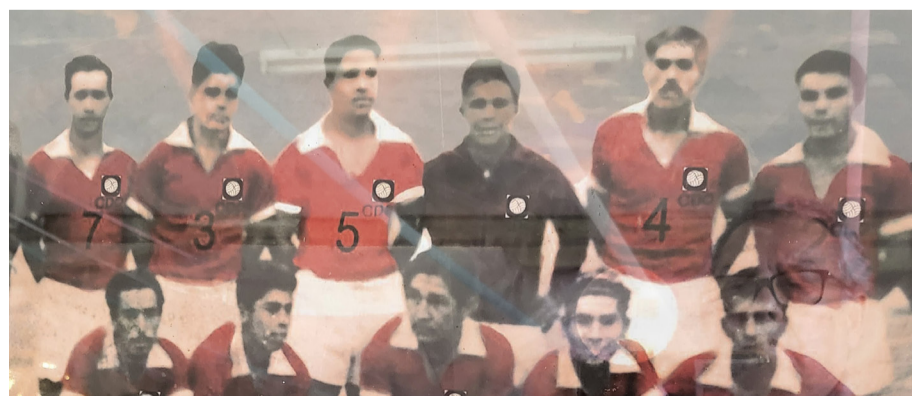
Los Macanudos de Obrero no solo eran buenos para la pelota, también aguerridos.