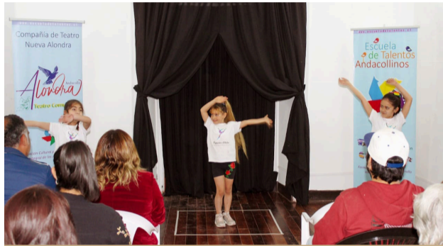
En la comuna nadie se podrá quedar fuera de los talleres que son gratuitos.