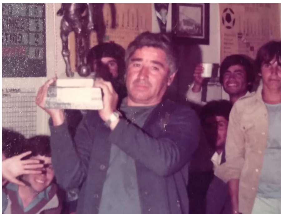
Más de un premio recibió el destacado jugador y dirigente.

Como jugador fue reconocido por sus goles olímpicos y fundar, junto a otros dirigentes, la asociación de árbitros de Andacollo.