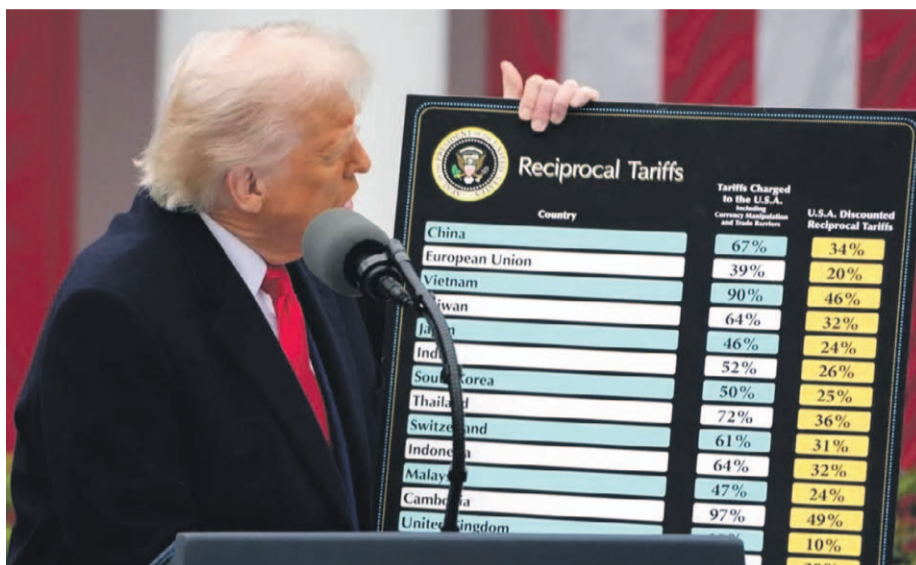
Trump hizo estos anuncios en un evento, llamado 'Make America Wealthy Again' ("Hacer a EE.UU. rico de nuevo").

El mandatario republicano también comunicó la misma medida para Argentina, Brasil y Colombia, y la justificó diciendo que estos países contemplan aranceles del 10% para productos estadounidenses.