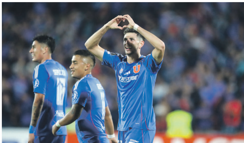
UNIVERSIDAD DE CHILE

La apertura del marcador le dio tranquilidad al representativo nacional que mantuvo el orden defensivo para contrarrestar al conjunto brasileño, que pese a tener el balón, no tuvo la claridad como para llegar a la paridad.