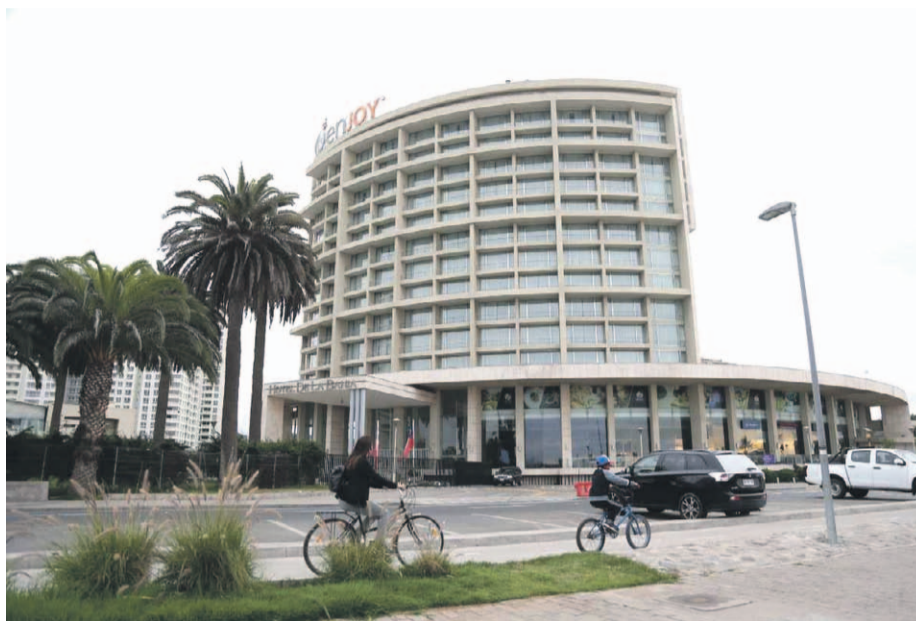
La solicitud fue presentada a fines de febrero a la Superintendencia de Casinos y la fecha no ha sido respondida por parte del ente regulador.

La cadena de casinos solicitó al ente regulador poder finalizar la administración en la comuna puerto además de Viña del Mar y Pucón, adjudicados en 2018. La medida se justificaría por la difícil situación financiera de la compañía tras la pandemia, a lo que se suma un proceso de reorganización.