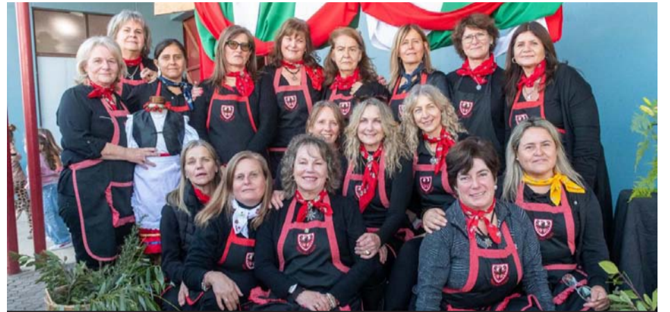
Comité organizador de la actividad.

Con un almuerzo de camaradería se conmemoró un nuevo aniversario de la llegada de la colonia trentina a la ciudad de La Serena. La actividad que convocó a toda la comunidad italiana, se realizó en la Scuola Italiana Alcide de Gasperi, donde las familias pudieron disfrutar y compartir de una agradable tarde al son de historias y anécdotas desde la llegada de los primeros inmigrantes a la zona.