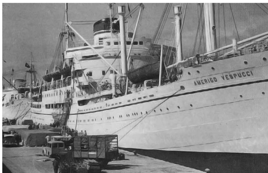
El vapor Amerigo Vespucci fue uno de los dos barcos en que llegaron las familias italianas a la Región de Coquimbo en 1951.

Atraídos por una promesa de una vida mejor, y dejando atrás una zona devastada por la Segunda Guerra Mundial, unos 200 migrantes trentinos cruzaron en 1951 el Atlántico para llegar a una ciudad en la que pudieron echar raíces y establecerse como nuevos chilenos, no sin pocos esfuerzos y sacrificios.