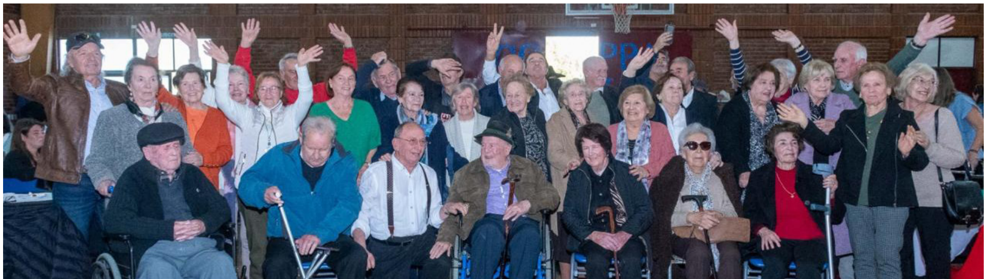
Los trentinos y sus familias.