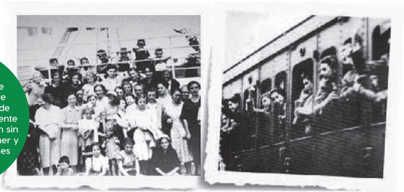
Para la comunidad ítalo-serenense es primordial conservar la cultura de aquellos que un día decidieron cruzar el Atlántico en busca de una vida mejor.

Con su corazón dividido entre la provincia italiana de Trento y la Región de Coquimbo, decenas de inmigrantes y su creciente descendencia, trabajan sin descanso para mantener y difundir sus tradiciones familiares y comunitarias.