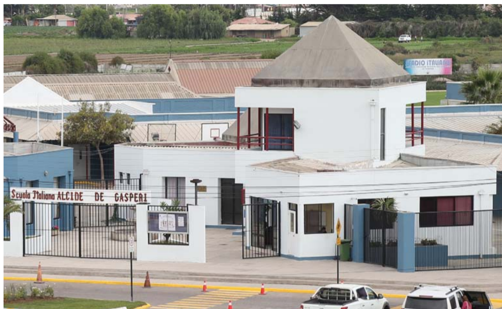
En sus inicios, la Scuola Italiana Alcide de Gasperi comenzó con tan solo 15 estudiantes. Hoy cuentan con una matrícula de 750 niños y jóvenes.

"Se valora mucho todo lo que hemos hecho como cultura italiana en La Serena. El objetivo es transmitir la cultura a nuestros hijos, pero también agradecerle a Chile el hecho de que nos han acogido, e invitar a