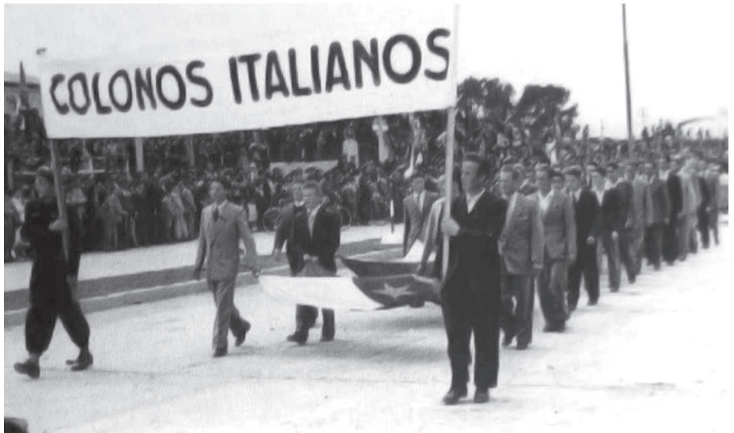
Histórica imagen de un desfile en el que participan los migrantes italianos recién llegados a La Serena.

“Nosotros cuando hacemos actividades, por ejemplo en la celebración de la llegada de los primeros italianos a Chile, nos reunimos alrededor de 500 personas, que es una cifra considerable para nuestra colonia”, detalló.