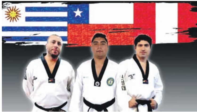
Los profesores que lideraron la convocatoria virtual quedaron muy conformes con la respuesta y participación.

En ese sentido y, aprovechando el entusiasmo reinante, explicó que en este mes de septiembre realizarán