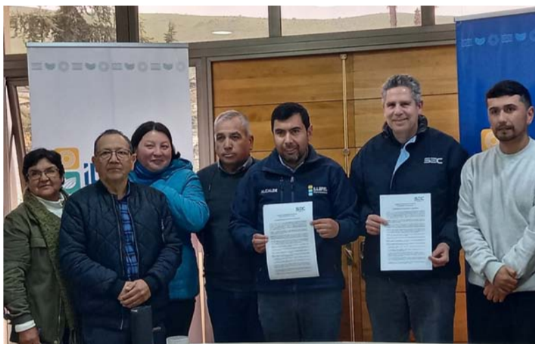
Illapel es una de los 163 comunas con convenios para los reclamos.

Además de sus canales de atención online y de sus oficinas regionales, la Superintendencia de Electricidad y Combustibles tiene convenio con 163 municipalidades del país donde las personas pueden realizar sus denuncias o consultas sobre la luz, el gas y los combustibles líquidos, acercando así su labor a la comunidad.