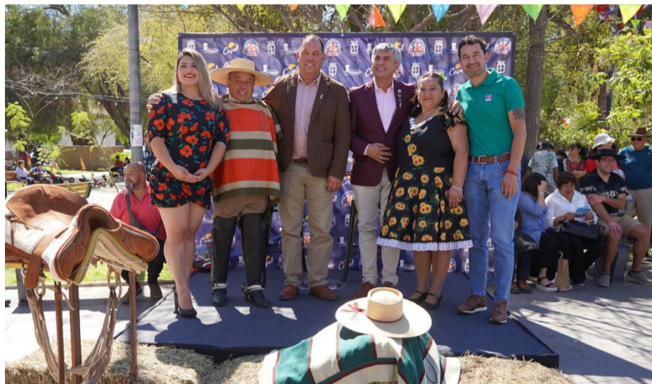
En la comuna de Vicuña se realizó el lanzamiento de la Pampilla de San Isidro, donde se presentó la parrilla de artistas presentes en el show,

Cabe destacar que, este año, la Pampilla de San Isidro tiene contemplado un programa de espectáculos