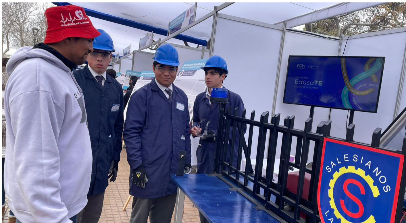
Son 15 las iniciativas en desarrollo por estudiantes de liceos técnico-profesionales de la Región de Coquimbo en colaboración con empresas locales, bajo el programa EdúcaTE.

EdúcaTE, iniciativa de ISA Interchile en alianza con Fundación Chile, impulsa la innovación en la educación técnica con proyectos que promueven la sostenibilidad y el desarrollo regional.