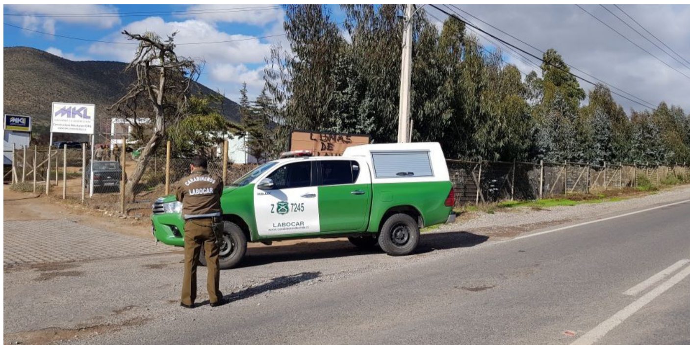
El menor fue hallado sin vida dentro de un tarro con agua que servía de bebedero de animales. La investigación quedó a cargo de la Labocar de Carabineros.

Sumado esto, se tiene que desde Fiscalía se dio a conocer que el cuerpo del niño, ya fue levantado por el Servicio Médico Legal para la autopsia y que a la fecha no hay detenidos por este caso, ya que hasta el momento, no se ha logrado establecer la participación de terceros.