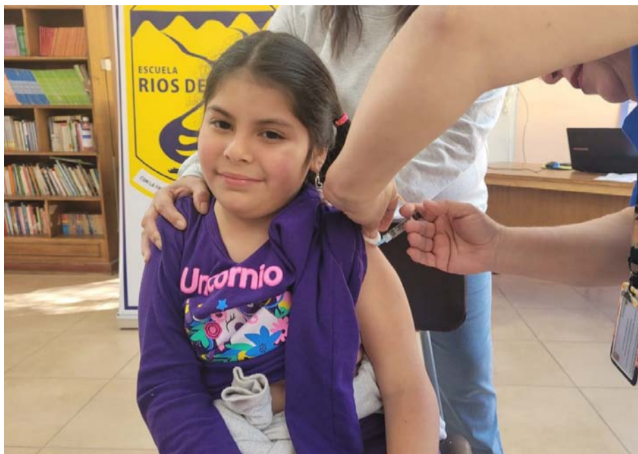
La iniciativa busca proteger a los niños en edad escolar contra la Difteria, Tétanos, Tos Convulsiva y las infecciones por Virus Papiloma Humano.

vacunación escolar se extiende por el territorio. Los equipos realizan una visita en todos los establecimientos sean públicos y privados. La campaña busca inmunizar a más de 48 mil estudiantes y actualmente, ya se cuenta con un avance mayor al 70% en cada una de las dosis y vacunas administradas, lo que es una muy buena noticia", explicó.