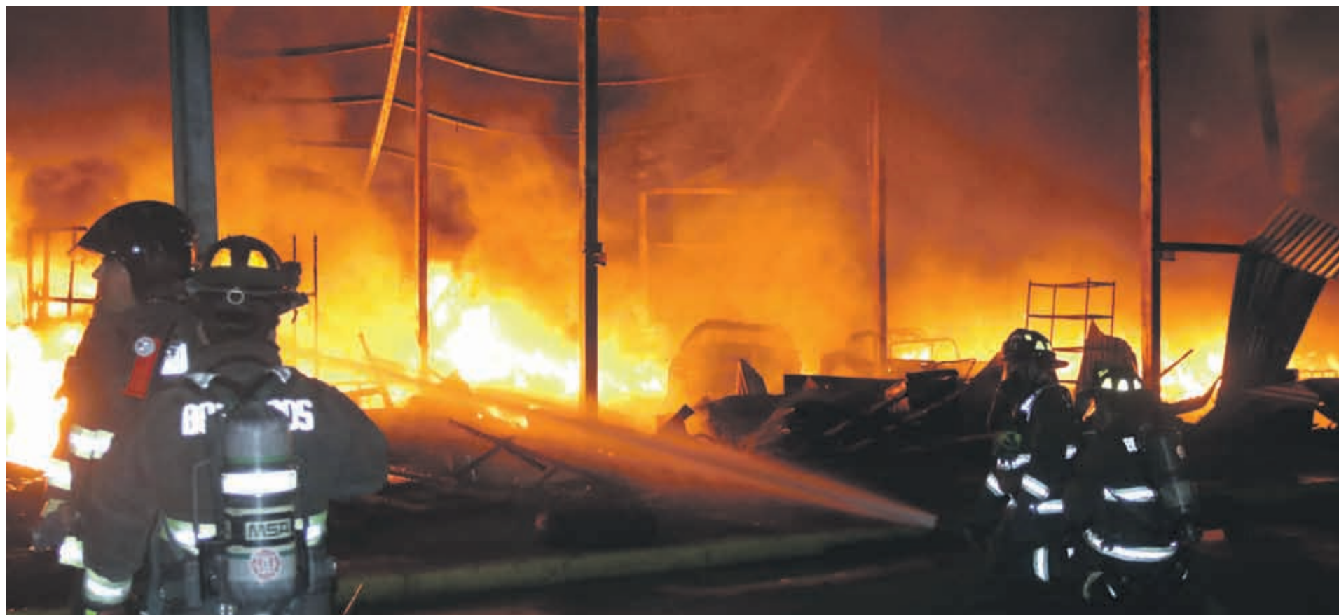
Al menos nueve compañías de bomberos de Coquimbo trabajaron el el siniestro de mayores proporciones ubicado en Avenida Costanera con 25 de Mayo.

NUEVE COMPAÑÍAS DE BOMBEROS TRABAJARON COMBATIENDO LAS LLAMAS