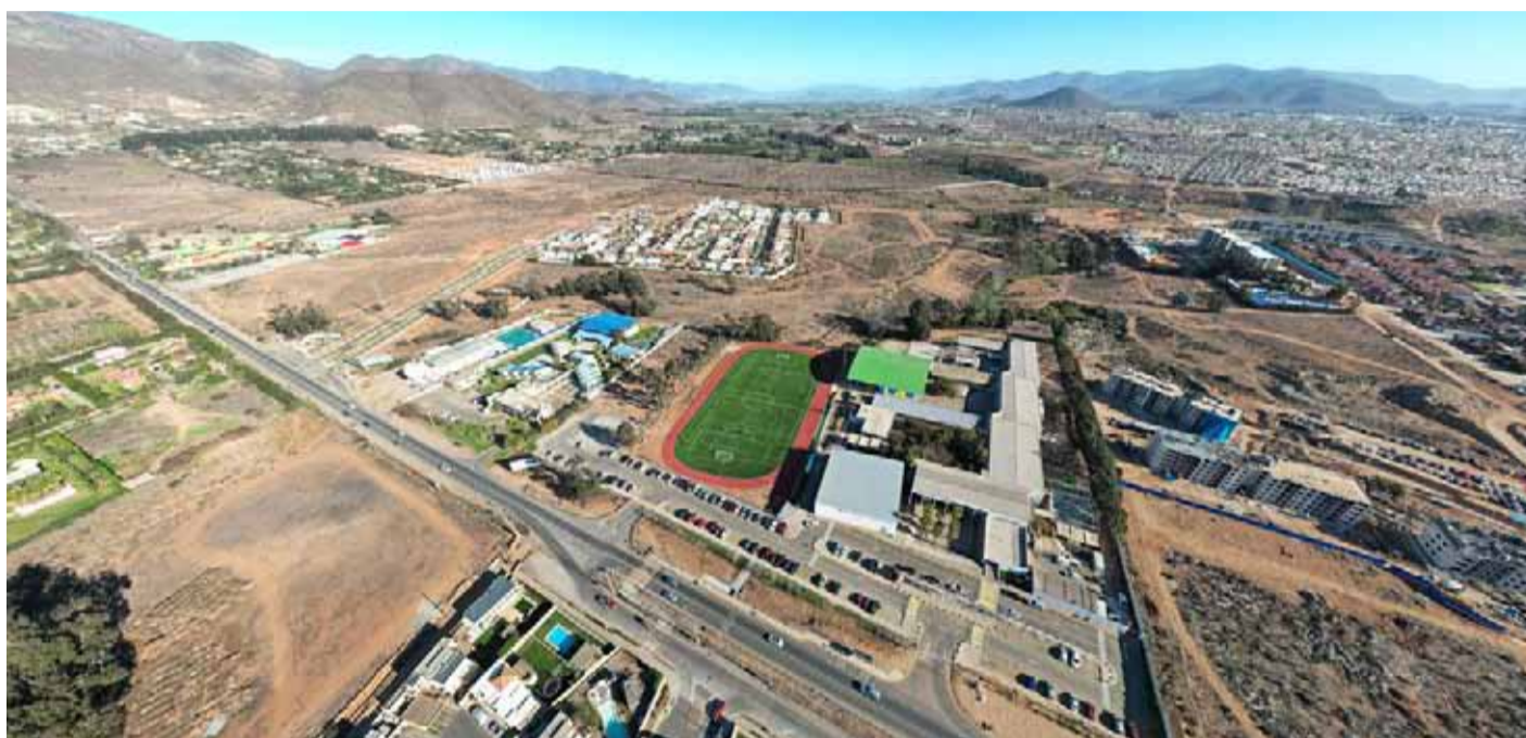
De materializarse la ruta alternativa se convertiría en uno de los proyectos más importantes en décadas en la región.

Pese a que el titular regional del Ministerio de Obras Públicas afirmó que durante noviembre se reunieron con comunidades y parlamentarios, representantes del sector privado siguen sin conocer las características de la ruta alternativa, proyecto que tendrá una extensión de aproximadamente 39 kilómetros, entre El Panul y el Sitio Arqueológico El Olivar.