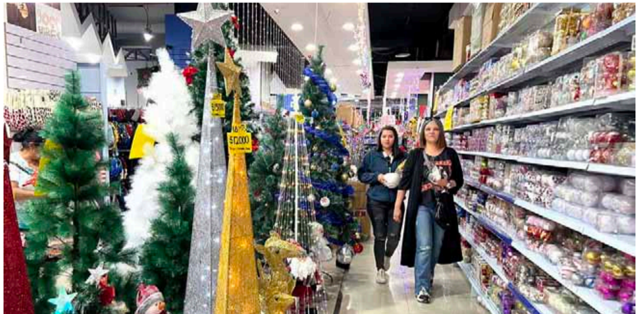
Los gastos aumentan de forma importante durante el mes de diciembre.

Las familias debieran elaborar un presupuesto y ceñirse estrictamente a él. Al mismo tiempo, hay que evitar pagar fuera de plazo para evitar cobros extras o multas. Ahorrar, además de administrar los gastos, entrega seguridad financiera y tranquilidad en caso de imprevistos como la pérdida del empleo, un accidente o enfermedad.